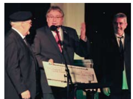
Spende von Godewind an das Lebenshilfswerk.