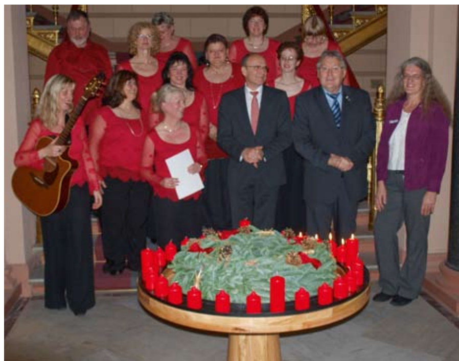
In der Staatskanzlei mit dem Ministerpräsidenten Erwin Sellering.

der Gemeinschaft unter Berücksichtigung der UN-Konventionen für Menschen mit Behinderung hervorgehoben und den Ministerpräsidenten herzlich eingeladen, die Werkstätten des Lebenshilfewerkes zu besuchen.