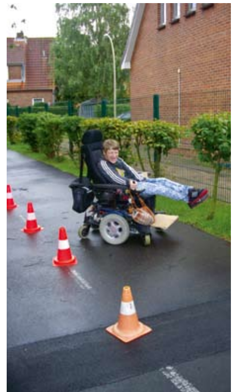
... und eine Slalomfahrt.