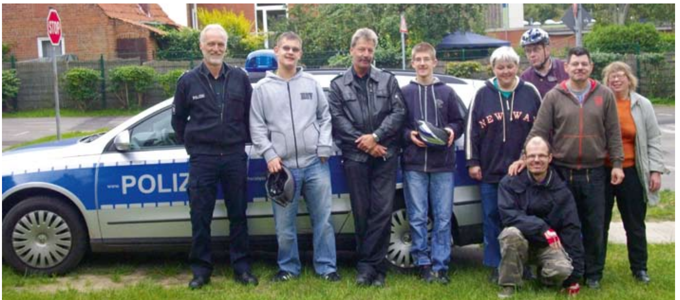
Alle sind sich einig: Das war in erfolgreicher Sicherheitstag.