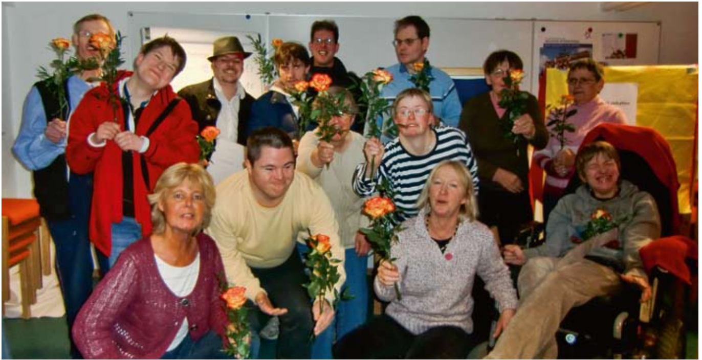
Beirat Wohnen Geestacht