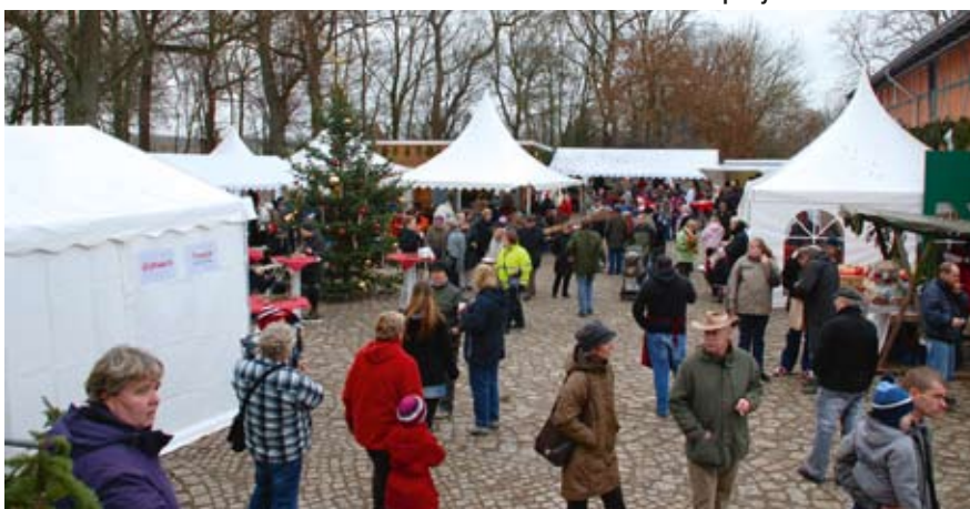
Viele Besucher waren gekommen.

Hier noch mal ein besonderer Dank an alle Mitwirkenden, die zum guten Gelingen beigetragen haben.