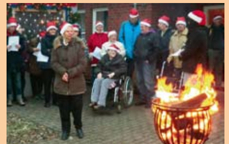
Vor der Wohnstätte bei Feuerkorb und Punsch.

In allen Gruppen der Wohnstätte wurden von den PädagogenInnen verschiedene Angebote vorbereitet. So konnten Weihnachtskarten gebastelt,