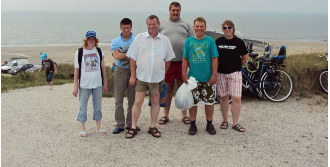
Am holländischen Nordsee-Strand.

war die Schlange dort so lang, dass wir das nicht rechtzeitig geschafft hätten. Aber die Einkäufer waren wenigstens erfolgreich. Für den nächsten Tag haben wir schon geplant selbst Hamburger zu braten, dafür haben wir dann noch in einem kleinen Einkaufsladen in Petten, unserem Nachbarort, eingekauft.