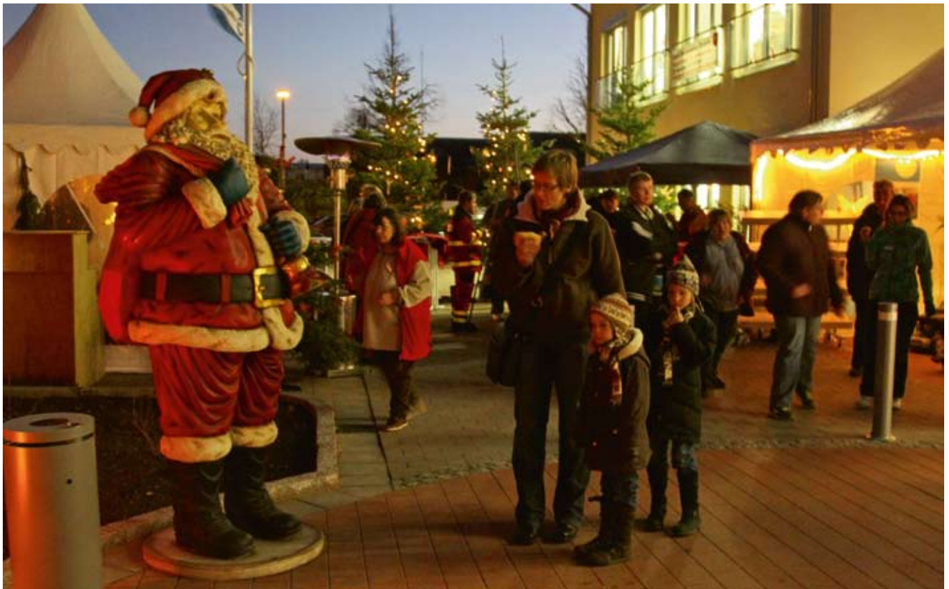
Neben dem Weihnachtsmann

Informationen zur Geschichte des Lebenshilfewerks und dem neuen „Haus der sozialen Dienste“ wurden erfahrbar und anfassbar. Außerdem wurden Einblicke in die neuen Dienstleistungsangebote des Hauses gegeben: das Bistro, die Seminar- und Konferenzräume, der Wäschepflegeservice und die Kulturwerkstatt. Viele dieser Angebote stießen bei den Besuchern auf großes Interesse und es wurden in vielen Gesprächen neue Kontakte geknüpft und Anfragen hinsichtlich der Nutzung des Hauses gestellt. Köstlichkeiten aus der Landwirtschaft des Arche Hofes, den Küchen des Lebenshilfewerks und des Erlebnisverkaufs Kneese versorgten die Gäste