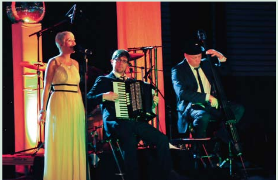
Weihnachtliche Songs festlich präsentiert.