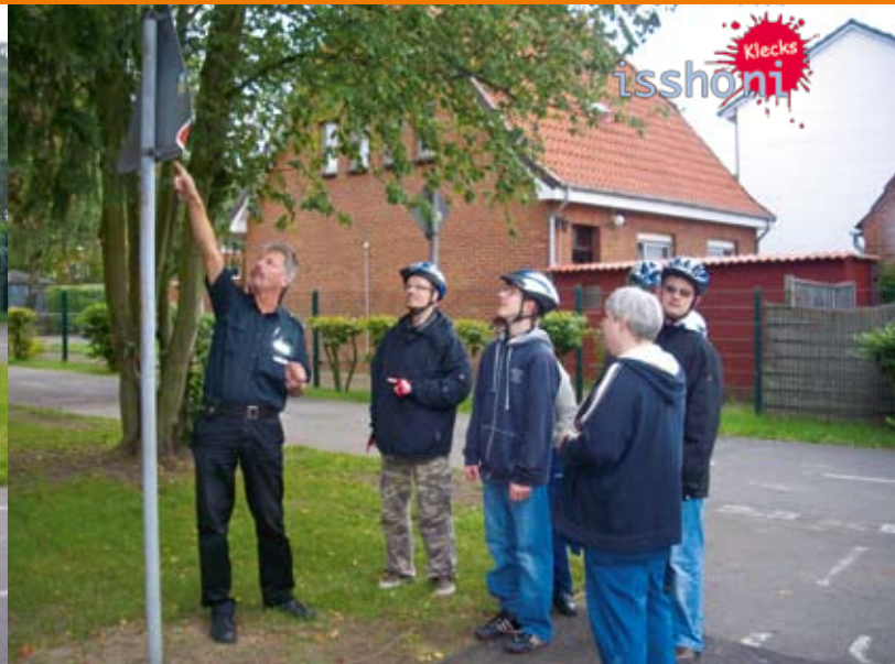
Es gab viel Interessantes zu entdecken: Verkehrsregeln ...