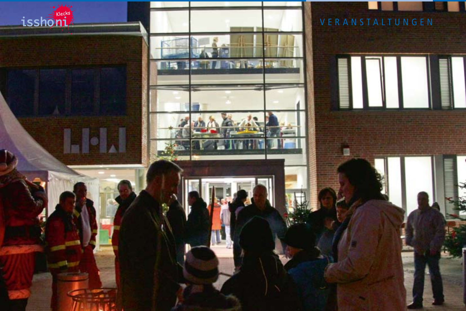
Vor dem Haus

kulinarisch und verzauberten den Eingangsbe- reich des neuen Hauses in eine vorweihnachtliche Atmosphäre. Produkte aus den Werkstätten, sowie ein Kulturprogramm mit Musik, Tanz, Fo- tos, Filmen und Malerei sorgten in den einzelnen Etagen des Gebäudes für bunte Begegnungen und Unterhaltung.