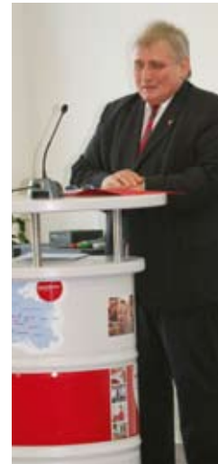
Innenminister Klaus Schlie.

arbeiterInnen, Beschäftigten und BewohnerInnen des Lebenshilfewerks den vielen Besuchern Aktionen und Präsentationen zu den Angeboten aus den Bereichen „arbeiten und fördern“, „lernen und erziehen“ sowie „wohnen und leben“.