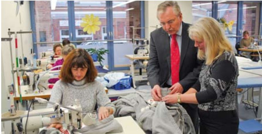
Genauere Prüfung der Näharbeit.