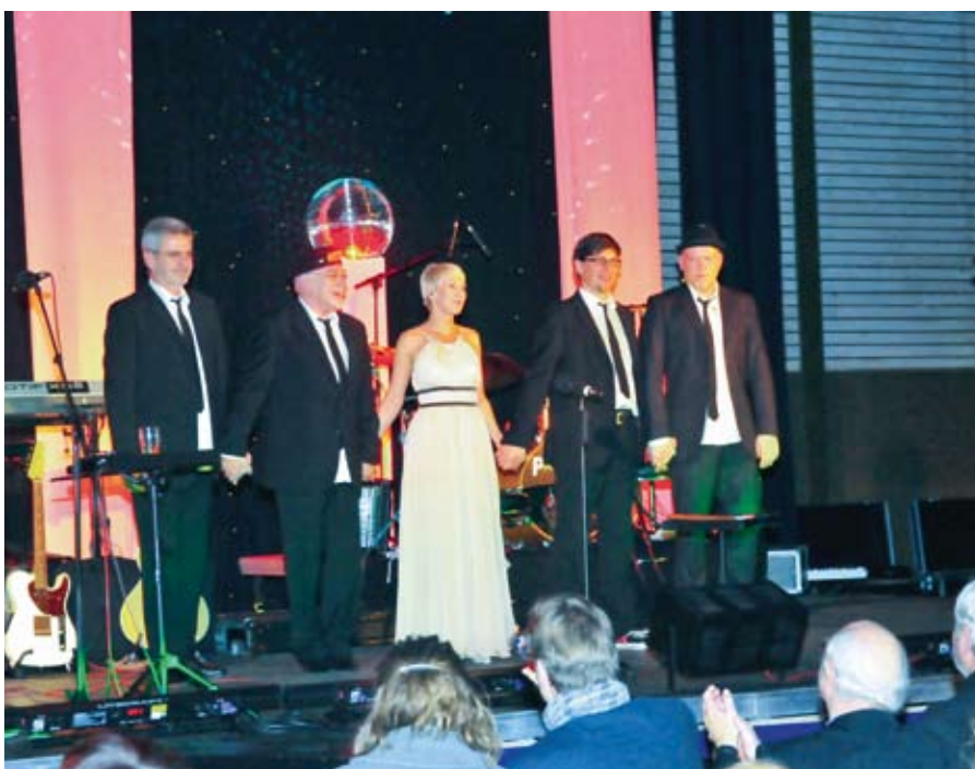
Freude über tosenden Applaus.