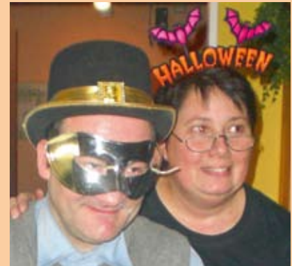
Hinter einer Maske versteckt.