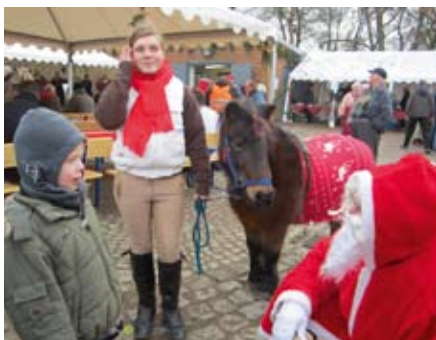
Ein Gedicht aufsagen ...