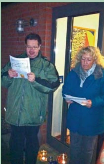
Gemeinsames Singen im Advent.