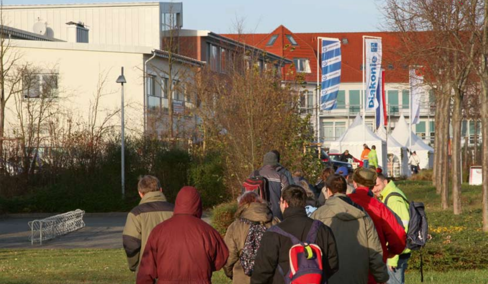
Auf dem Weg zum Haus der sozialen Dienste.