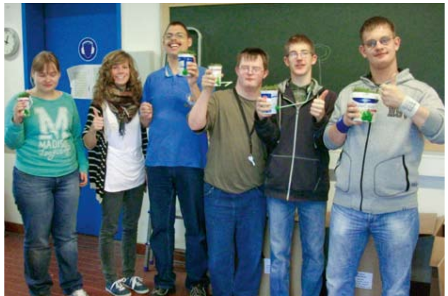
Experimentierfreu(n)de zum Thema „Wasser“.