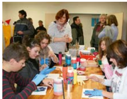
In der Kulturwerkstatt