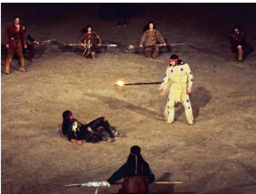
Winnetou im Kampf gegen die Bösen.