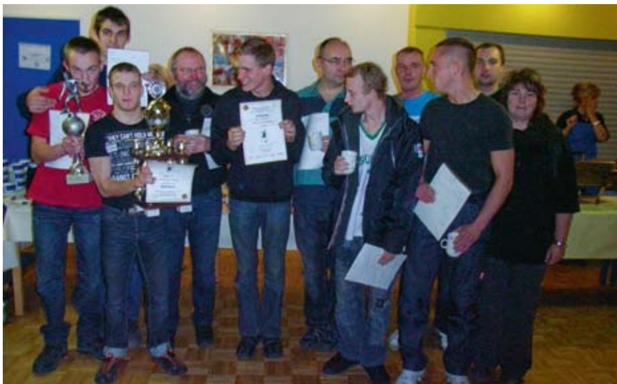
Die verdiente Siegermannschaft Arche-Hof.