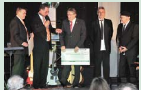
Spende von der Eckernförder Raiffeisenbank an das Lebenshilfswerk.