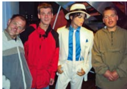
Hautnah bei Michael Jackson

Am nächsten Tag sind wir alle zusammen nach Amsterdam gefahren, hier haben wir schon mal erste Souvenirs eingekauft und uns ein wenig die Stadt angesehen. Amsterdam ist sehr groß, so dass wir erst mal Mühe hatten, einen Parkplatz