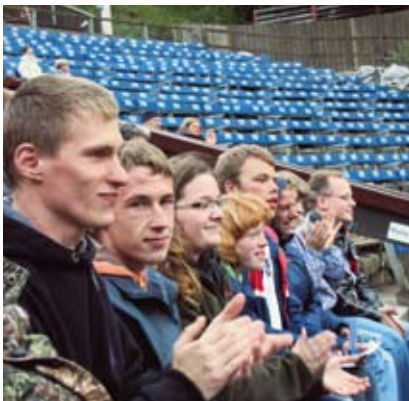
Beste Plätze ganz vorn.