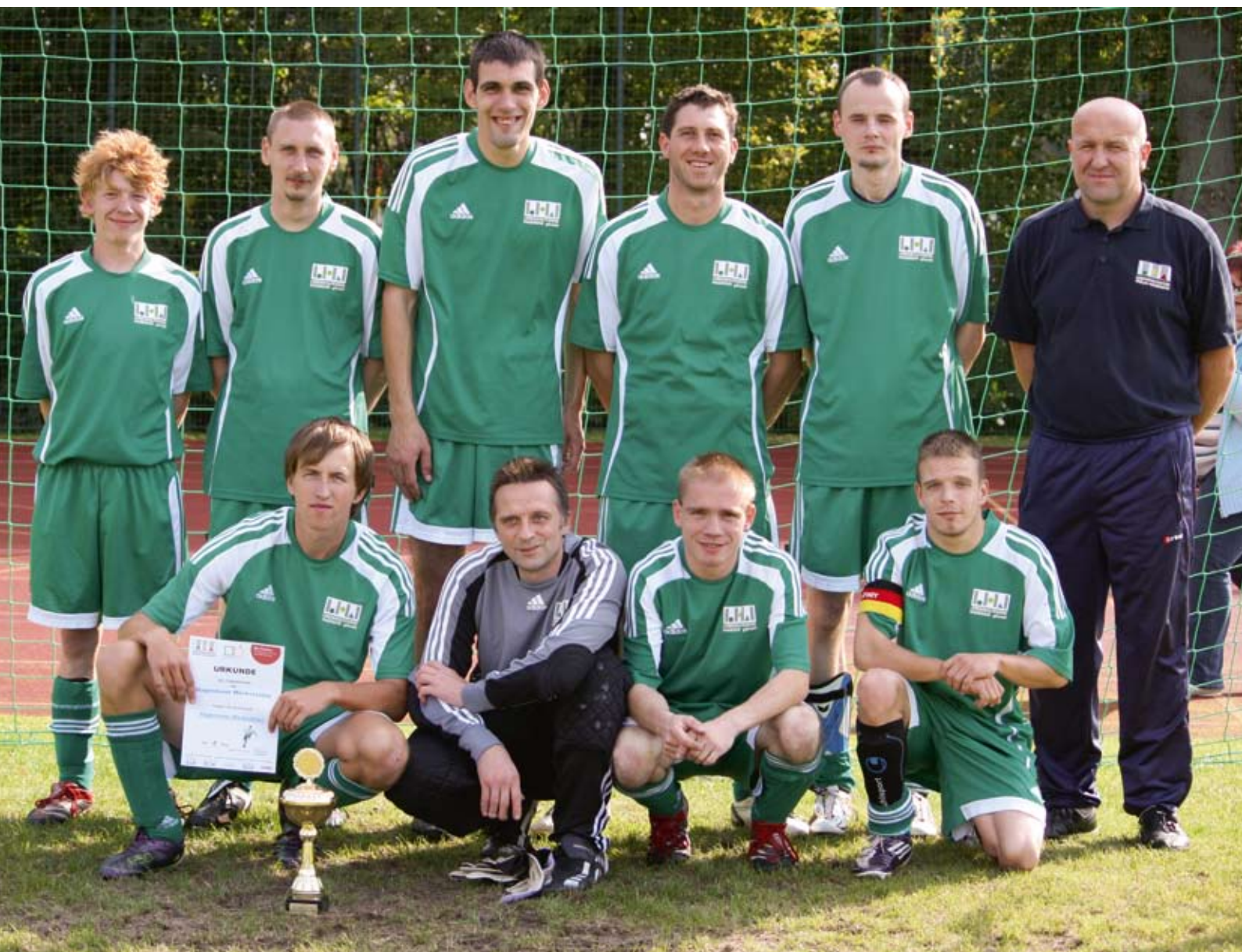
Die Mannschaft der Hagenower Werkstätten.