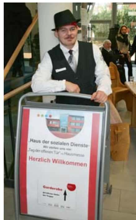
Herzlich Willkommen zur Hausmesse