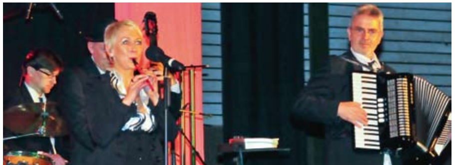
Godewind mit wunderschöner Weihnachtsmusik.

Wir trafen uns um 17.30 Uhr. Die Größe der Halle war für mich sehr beeindruckend. Ich war sehr aufgeregt, dachte aber es wird schon gut gehen. Als alle zusammen waren, haben wir heimlich unser Überraschungslied für Godewind „In der Weihnachtsbäckerei“ einstudiert. Dann haben wir noch kurz mit Godewind unsere anderen Lieder geprobt. Gegen 19 Uhr trafen dann die