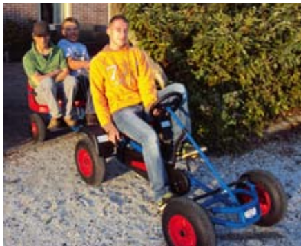
Eine Ausfahrt, die ist lustig ...

Wir hatten ein Ferienhaus namens „Weidezicht“ in Burgervlotbrug-Petten. Es lag direkt zwischen zwei langgezogenen Wassergräben. Das Haus war riesig. Das musste es auch sein, da wir ins-