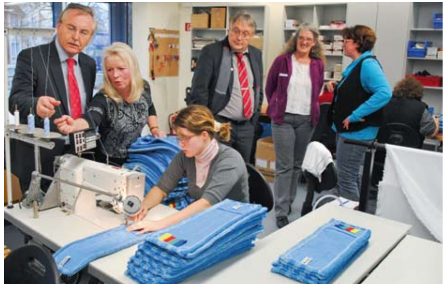
Verfolgung des Fadenlaufs.

Nähmaschinen surren, Stoffballen stapeln sich auf den Arbeitstischen, maßgeschneiderte Kleider, Garnrollen sowie Nadel und Faden sind überall gegenwärtig. Im Nähatelier in Hagenow herrscht rege und fröhliche Arbeitsatmosphäre und eine erwartungsvolle Vorfreude. Die Beschäftigten und Fachkräfte erwarteten einen besonderen Gast.