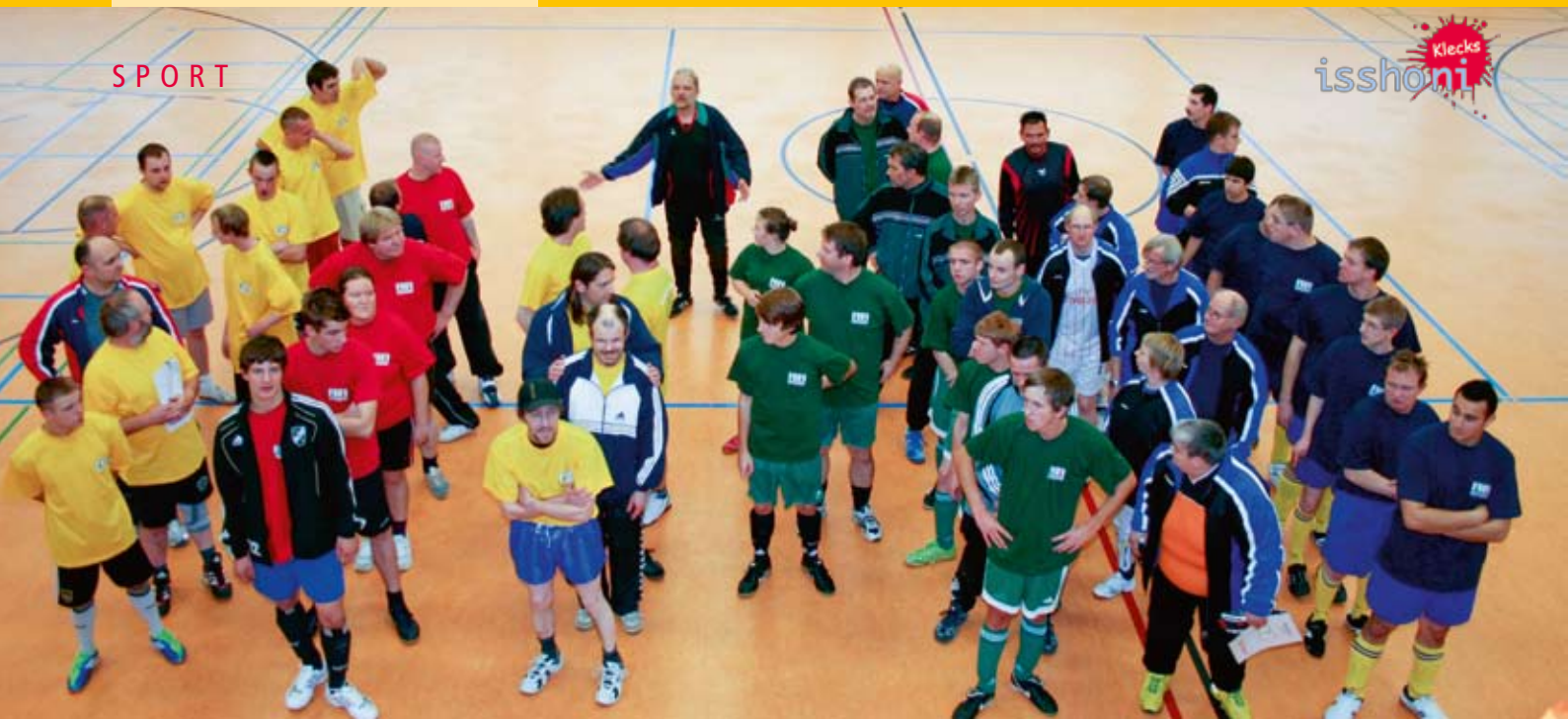
Alle warten gespannt auf die Begrüßung.