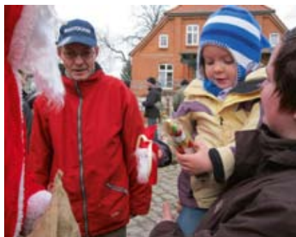
... beim Weihnachtsmann.

Am 26. November fand der 9. Weihnachtsmarkt auf dem Arche-Hof statt. Nach dem Ankommen startete der Markt mit einer Andacht von Pastorin Baier. Die Andacht wurde begleitet durch den Posaunenchor Pokrent und dem lebendigen Krippenspiel mit Beschäftigten und Mitarbeiterinnen der Hagenower und Boizenburger Werkstätten. Zur weiteren musikalischen Untermauerung des Tages trugen der Chor „Carpe Diem“, die „Parforcehornbläser Maurinetal“ und das „Duo Hautnah“ bei.