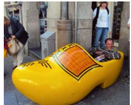
Der Schuh passt.

zu finden, aber verlaufen haben wir uns nie.