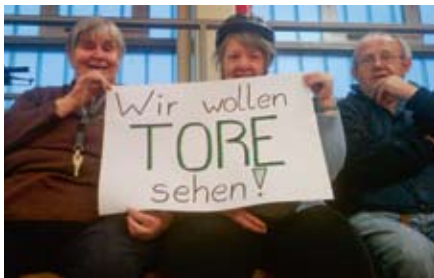
Die Geesthachter Fan-Kurve.

Ludwig Beckmann Geesthachter Werkstätten