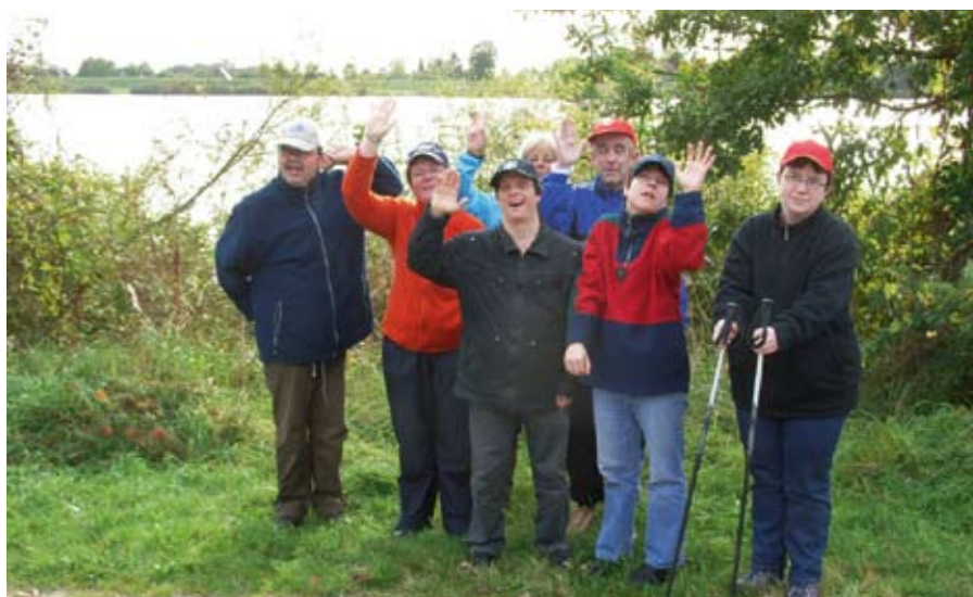
... kurze Verschnaufpause an der Elbe.