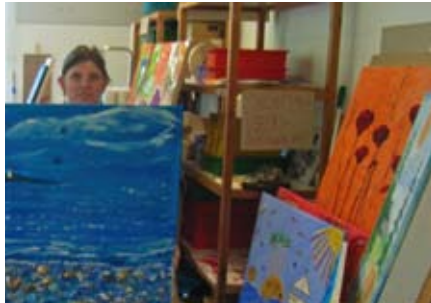
Malwerkstatt in Geesthacht

Der Titel ist „Der Till heckt mit dem Nasreddin“ Till Eulenspiegel kennt natürlich jeder - aber wer ist Nasreddin Hodscha? Nasreddin Hodscha ist ein weiser Narr aus der Türkei, der den Leuten ebenso wie Till Eulenspiegel einen Spiegel vor das Gesicht hält und sich über die „Dummheit der Menschen lustig macht“. Wenn die beiden Narren zu den verschiedenen Aktionen aufeinandertreffen gibt es bestimmt viel Interessantes zu entdecken. So wird es einen Workshop für Theater-Interessierte geben. Alle 14 Tage in