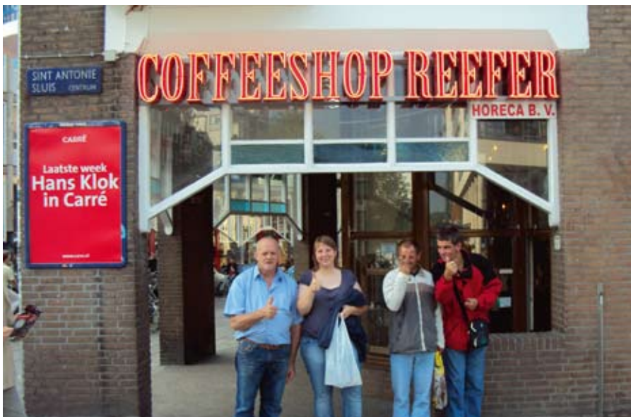
Vor einem Coffee-Shop in Amsterdam.