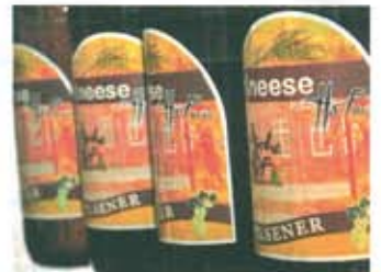
Das neue Etikett des Kneeser Bieres.

Beschäftigte der Werkstätten sind auch für das sogenannte „Bebügeln“ der Flaschen zuständig. Die Glasflaschen müssen nämlich alle manuell mit dem Bügelsystem versehen werden. Auch in Vielank selbst gibt es Arbeitsplätze für Behinderte, in der Küche und in der Brauerei. Und diese Kooperation funktioniert für beide Seiten mit großem Erfolg, wie Grätsch aber auch Inhaber Kai Hagen bestätigen. Beide haben vor Jahren auch die Idee für eine eigenes Bier der Lebenshilfe entwickelt. Langfristig will das Werk sogar in Kneese eine eigene Brauerei einrichten und später vielleicht einmal in Richtung Bio-Bier gehen. Obwohl das in Vielank gebraute