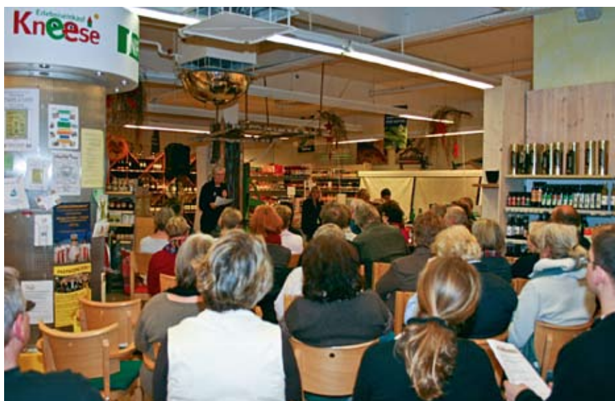
Viele Gäste beim Leseabend.