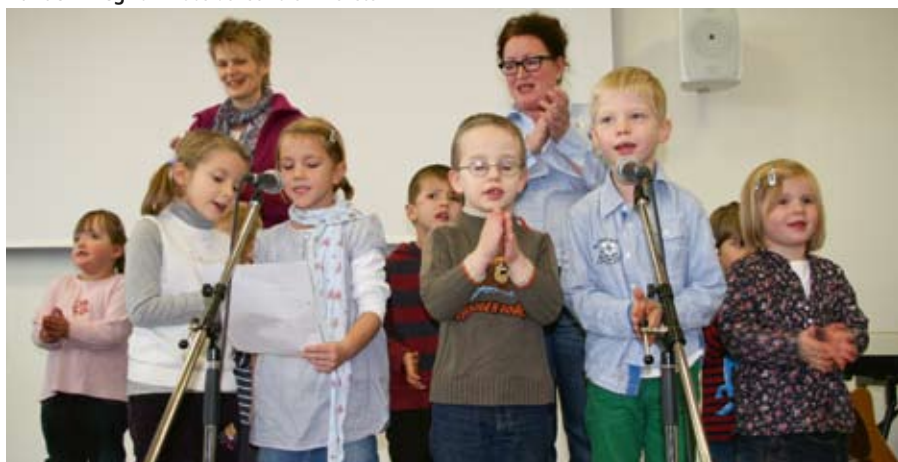
Claus und seine Freunde