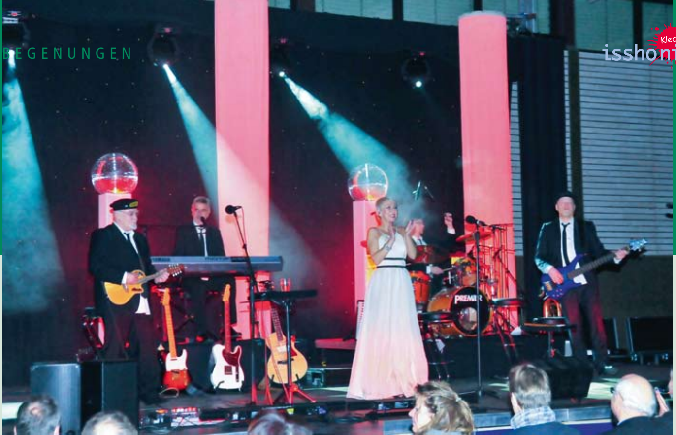
Festliche Stimmung beim Godewind-Konzert.