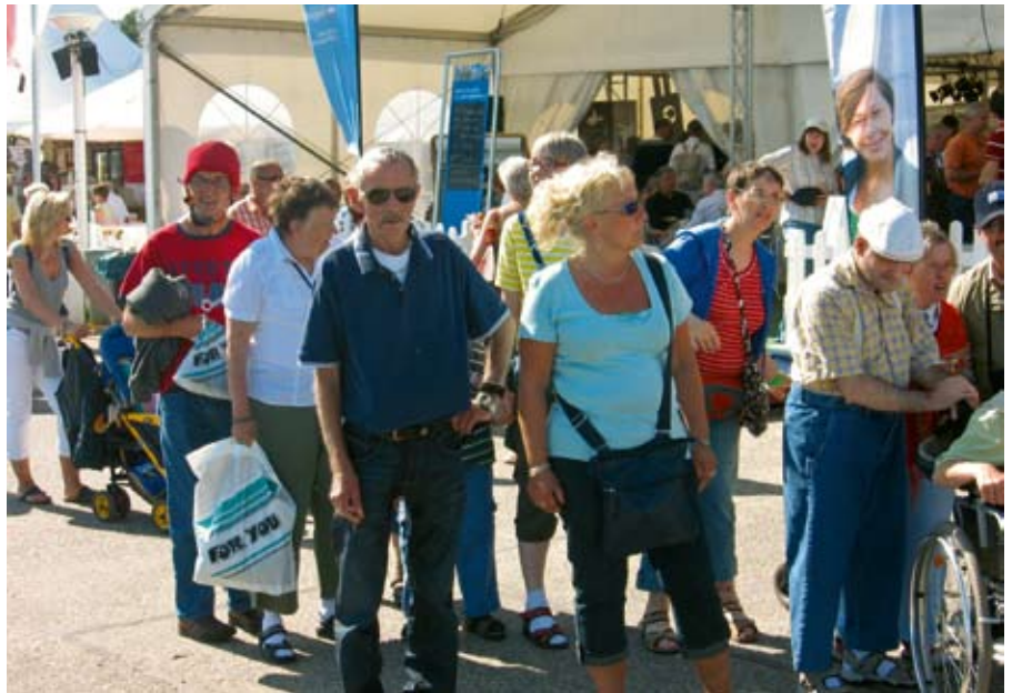
Spaziergang entlang der Promenade.

Dort herrscht viel Betrieb. Viele Menschen wollen die Travemünder Woche besuchen, und die Fähre ist ununterbrochen im Einsatz. Auf der anderen Seite angekommen, machen wir uns auf die Suche nach einem netten Plätzchen, um uns zu stärken. Es ist mittlerweile Mittag geworden, und unsere Mägen knurren, und Durst haben wir auch. In einem Straßencafe lassen wir uns nieder. Als alle mit Brötchen und Kaffee versorgt sind, genießen wir die Pause und beobachten die vorbeilaufenden Menschen. Anschließend bummeln wir weiter, Richtung Festmeile. Un-