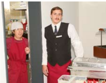
Fleißig im Bistro