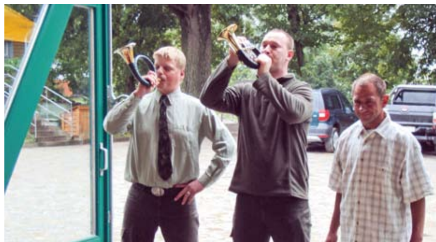
Die Jäger bringen ein Ständchen.