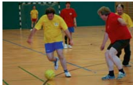
Der Ball rollt.