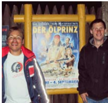
Beim Ölprinzen dabei gewesen.