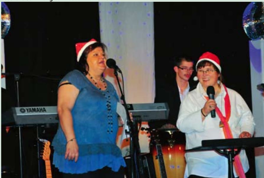
In der Weihnachtsbäckerei ...