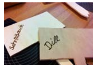
... fertig für das Kräuterbeet.