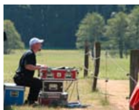
Tontechniker bei der Arbeit.

Auf dem Gelände an sich wurden diverse Stände aufgebaut, an denen man gucken und klönen konnte, aber auch für