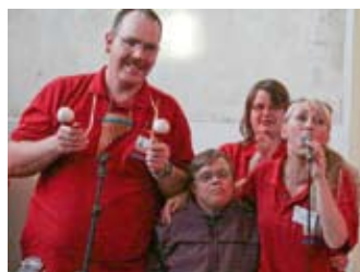
Live mit Fan