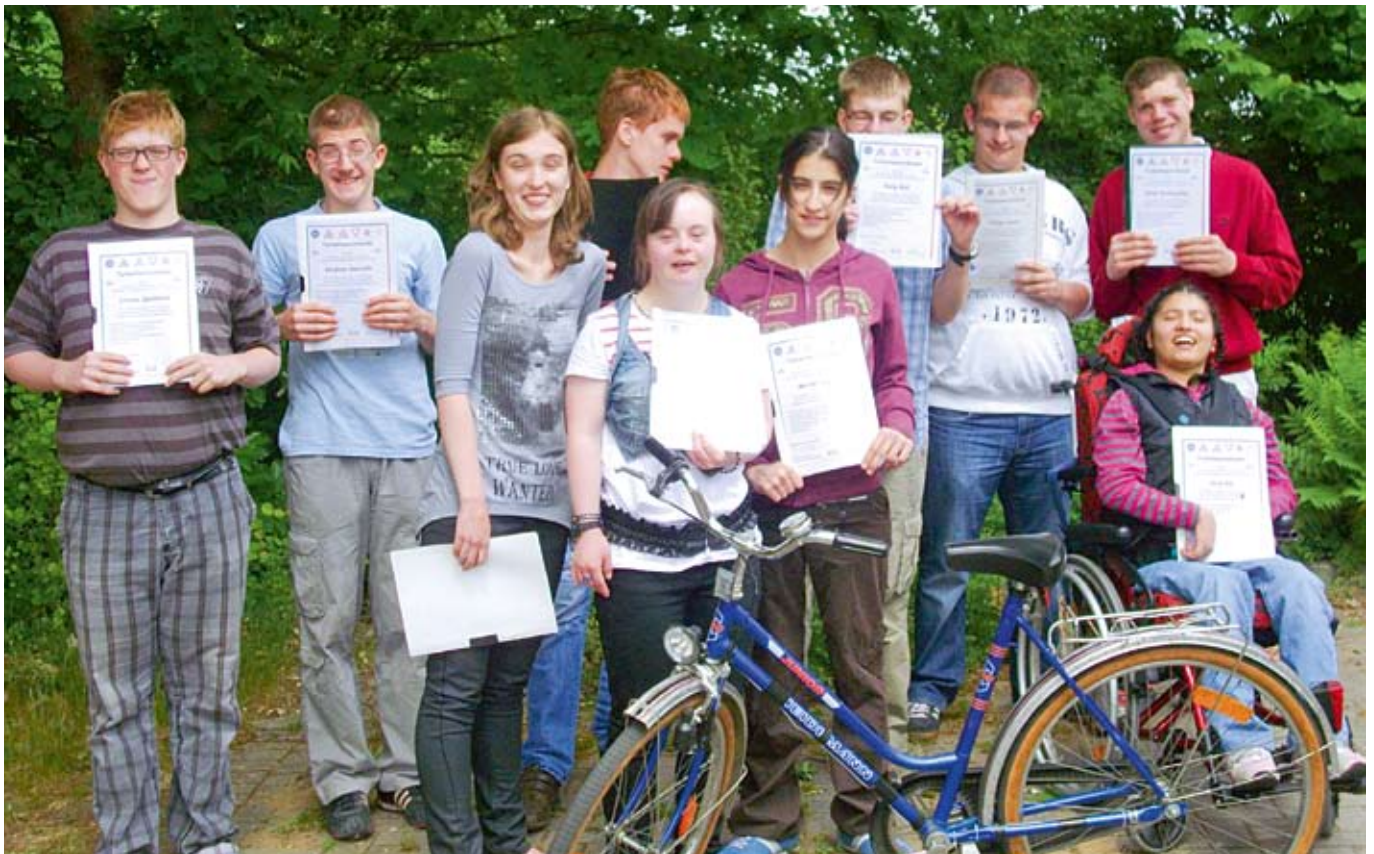
Stolz zeigen die Teilnehmer ihr Zertifikat.