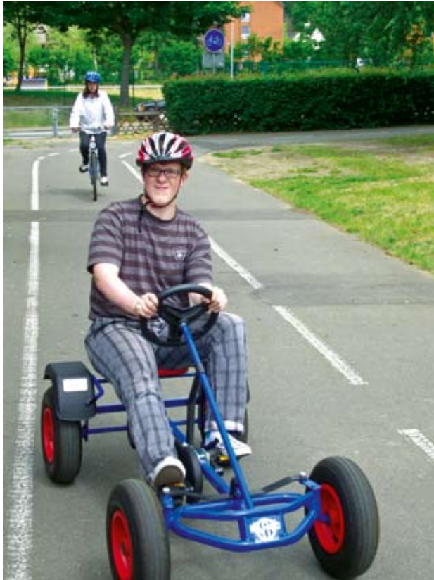
Auch Vierradfahren bringt Spaß.