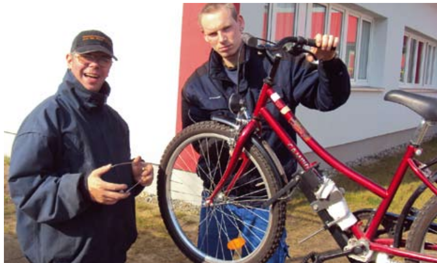
Funktioniert es? Testlauf für das Vorderrad.

Bei sonnigem Wetter reparierten unsere Monteure in Selbstverantwortung und Selbstbestimmung auf dem Gelände des ASB die Fahrräder. Nach Rücksprache mit den Mitarbeitern des Freizeithauses wurde dann das benötigte Material und Zubehör für die Fahrräder im Fachgeschäft gekauft.