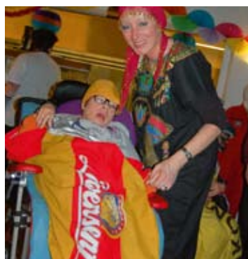
Als Löwensenf auf die Tanzfläche