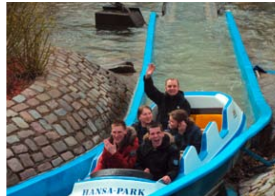
Nass aber lustig ...