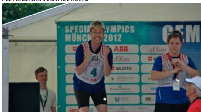
Große Freude: Medaille gewonnen.