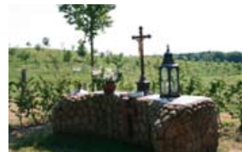
Baumkirche: Der Altar ist geschmückt.