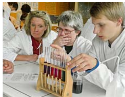
Das riecht wohl nicht gut.