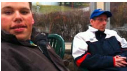
Kleine Pause zwischendurch.