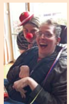
Rote Nase und herzliches Lachen.

Am 17. Februar feierten wir in der Tagesförderstätte am Tempelhofer Weg den Fasching. Unser Gruppenraum wurde feierlich mit Luftschlangen, Konfetti und vielen Luftballons, die dabei natürlich nicht fehlen durften, geschmückt. In einer fröhlichen, lockeren Runde konnten sich die mit Pappnasen und Hüten verkleideten Eltern, zu Betreuende und Mitarbeiter näher kennen lernen, austauschen sowie Fragen und Wünsche für die Zukunft äußern. Gleichzeitig sollte diese Feier für Information und Transparents über die Arbeit der Tagesförderstätte dienen. Durch das leckere Essen, die Faschingsmusik und der guten Atmosphäre war unser gemütliches Beisammensein ein gelungener Tag und wir freuen uns auf die nächste Faschingsfeier.