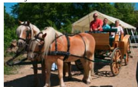
Eine Kutschfahrt ist herrlich ...