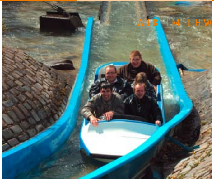
Nichts für Wasserscheue: Die Wildwasserbahn.