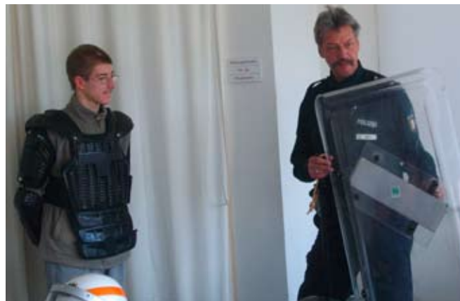
Jeder durfte eine Schutzweste anprobieren.