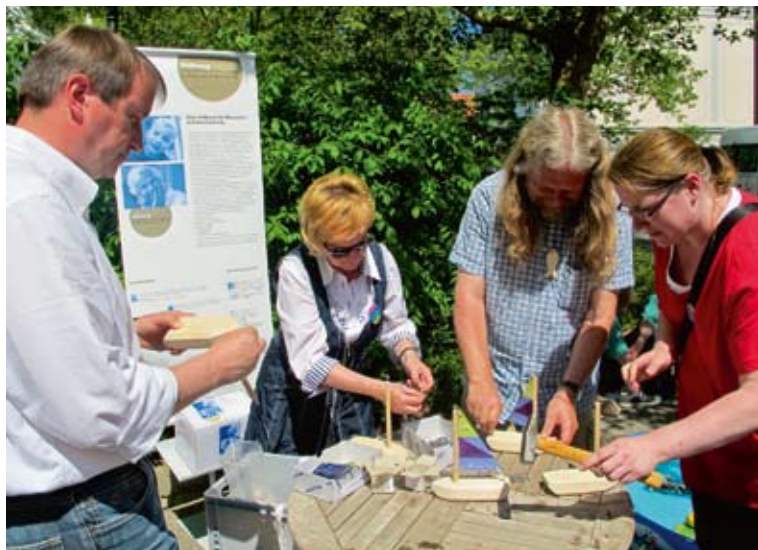
Die „Großen“ bauen auch Boote.