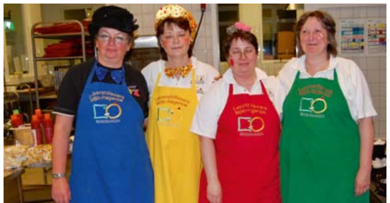
Die Fleißigen in der Küche.