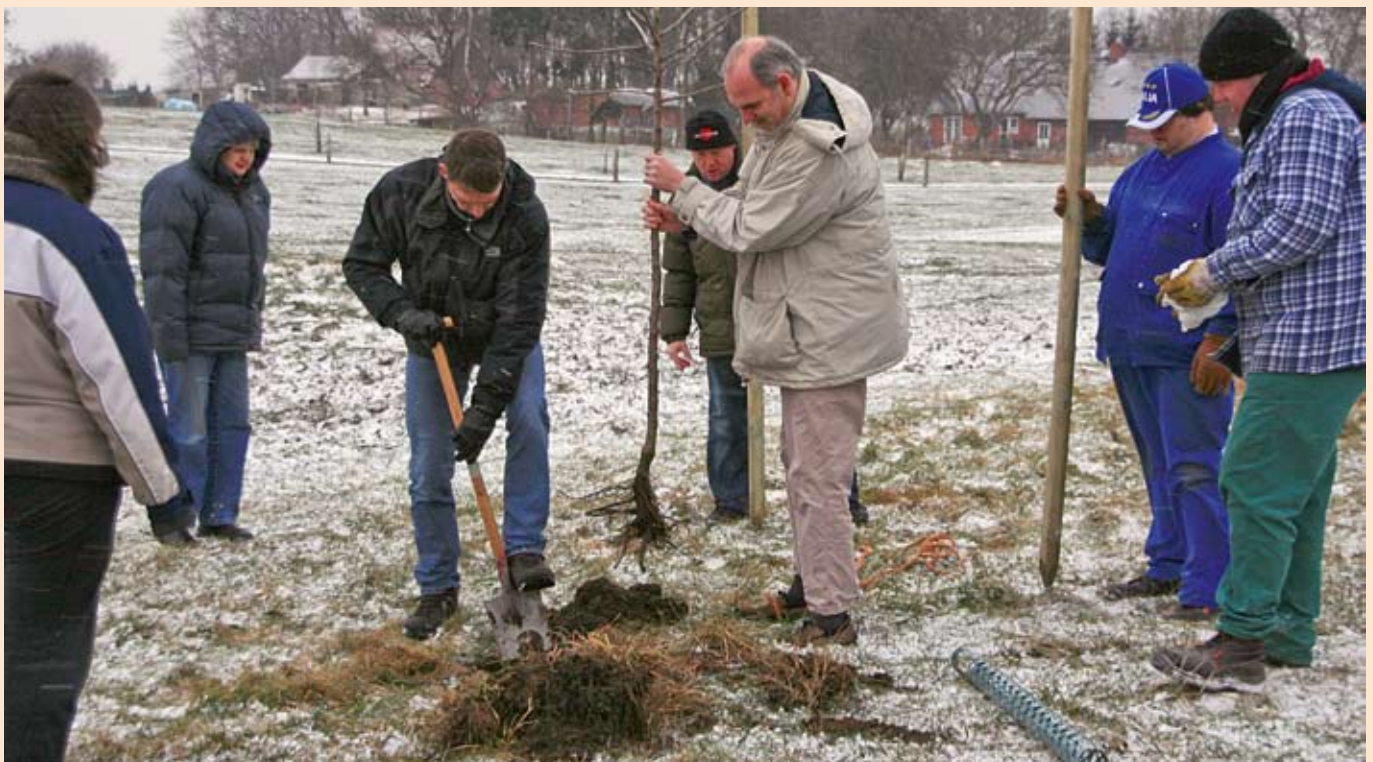
... pflanzen wir gemeinsam einen Baum.