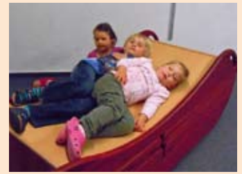
... ganz entspannt sein.

„Komm' wir gehen heute mal den „Klang wiegen!“ Wir gehen mit ein paar Kindern in den Therapieraum zur Klangwiege, das ist so ein riesiges Teil, ein echtes Ungetüm von Instrument! Ein riesiges Instrument zumindest für unsere Kinder. Die Erwachsenen denken, so ein großes Gerät, so eine kleines Kind ... Aber Kinder gehen damit anders um. Sie kommen in den Raum rein und steigen erst einmal eine Stufe höher ... auf die Wiege und dann rutschen sie auf dem Teil rum... „Leg dich mal hin und fühle mal, wie die Schwingungen durch den Körper gehen.“ Nein, da wird erst mal an den Seiten gezupft und dann auf den großen Lamellen geklopft!