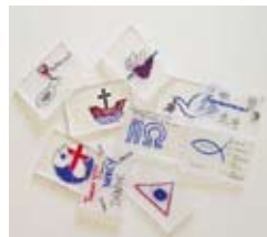
So sehen sie aus: Bemalte Scheiben für das Kreuz in der Holzbohle.