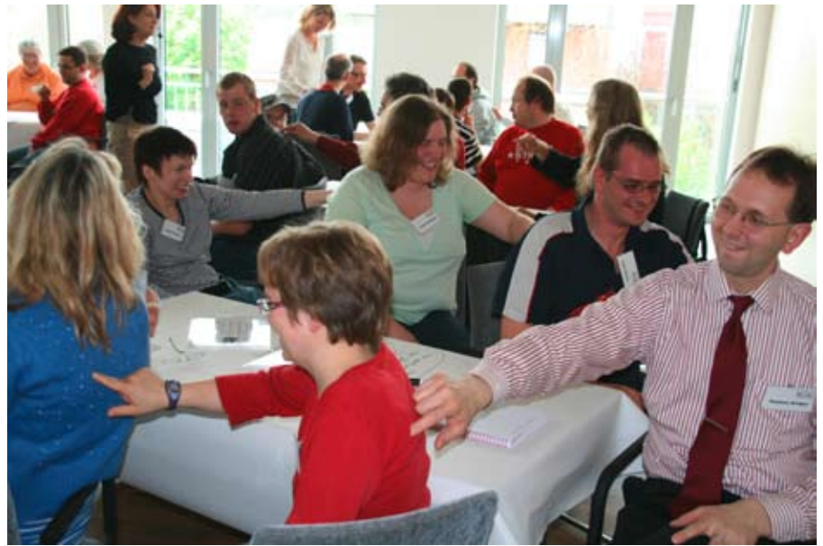
Zwischendurch eine kleine Auflockerung ...

Die Pausen waren genau so schön wie schon am ersten Tag und wieder ging ein großes Lob an das tolle Küchenteam. Die besonders liebevolle Versorgung wurde auch in der großen Abschlussrunde, in der alle sagen konnten, was ihnen gefallen hat und was sie sich wünschen, mehrfach betont. Es sollte mehr Veranstaltungen wie diese geben und wir wollen in den Werkstätten davon erzählen, waren nur einige der Wünsche.