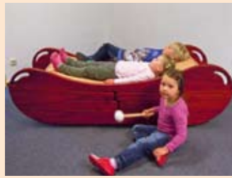
Auf der Klangwaage ...