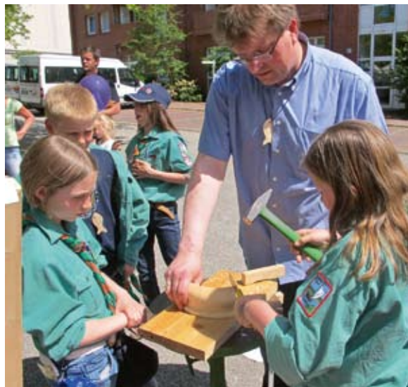
Von den Holzreifen schneiden wir Fische ab.