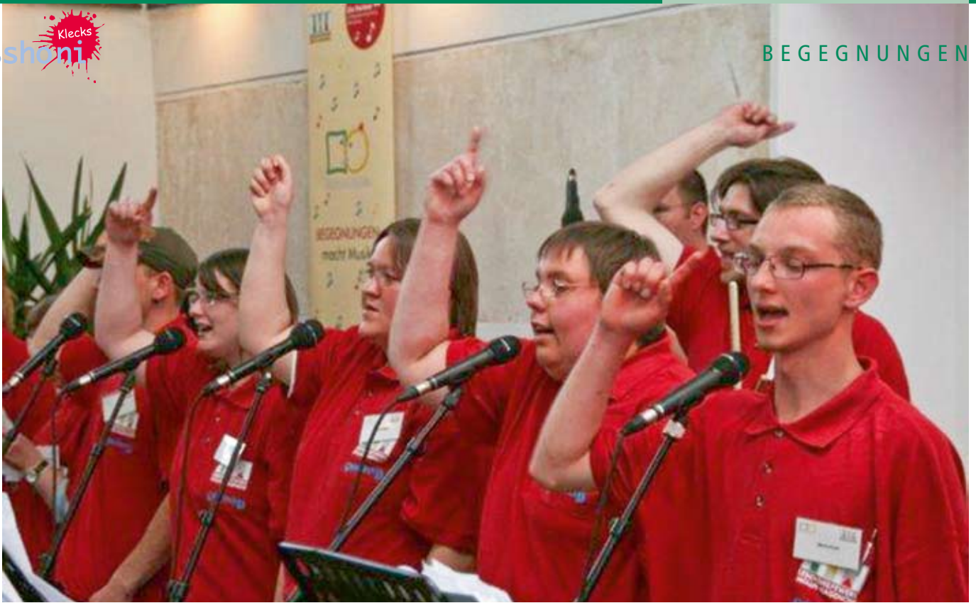
„Komm hol das Lasso raus!“