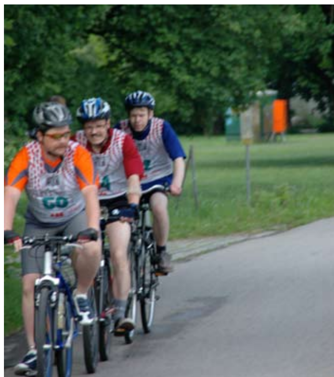
Dicht an dicht: Ein spannendes Radrennen.