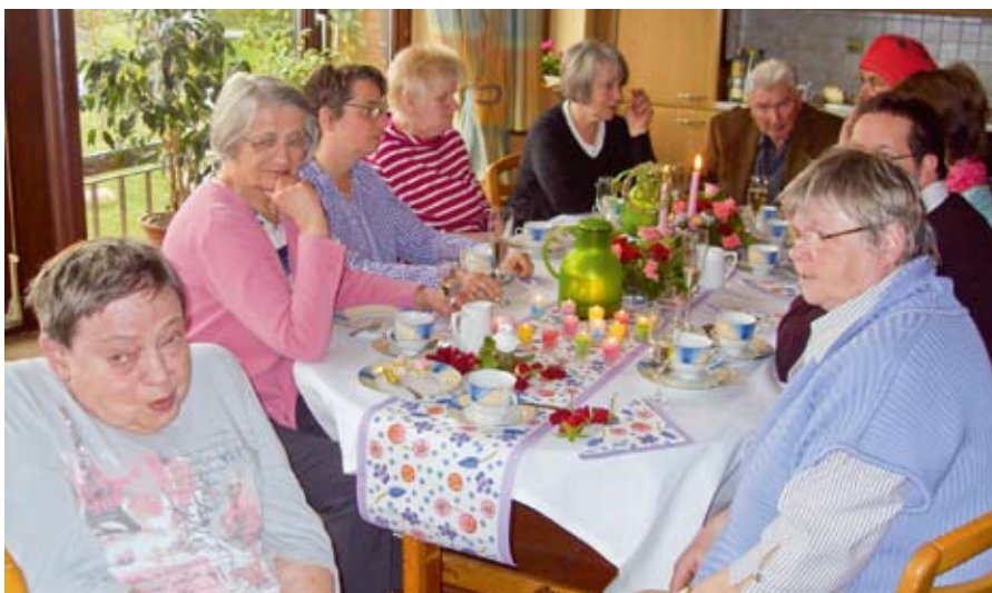
Die gemütliche Kaffeerunde.

Wir wünschen ihr noch viele Jahre voller Gesundheit, Freude und Zufriedenheit.