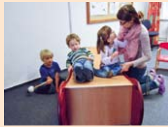
Einer gibt den Ton an, die beiden anderen lassen die Welle durch den Körper schwingen.