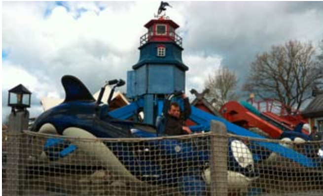
Achtung: Die Fahrt geht los!