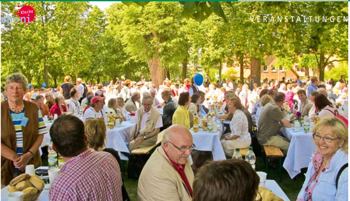
Zahlreich: Ca. 5000 Gäste bei der Ratzeburger Mahlzeit

wurden während des Tages und die Pfadfinder in ihrer Unterkunft auch darüber hinaus mit Verpflegung versorgt.