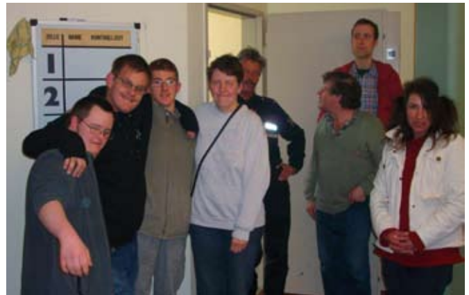
Vor einer Arrestzelle.

Eine maßgeschneiderte persönliche Schutzweste,