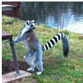
Der Lemur bleibt stur.