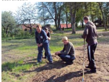
Bis wir Kräuter ernten können, wird es noch dauern.