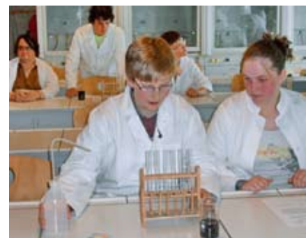
Jetzt beginnt das Experiment.