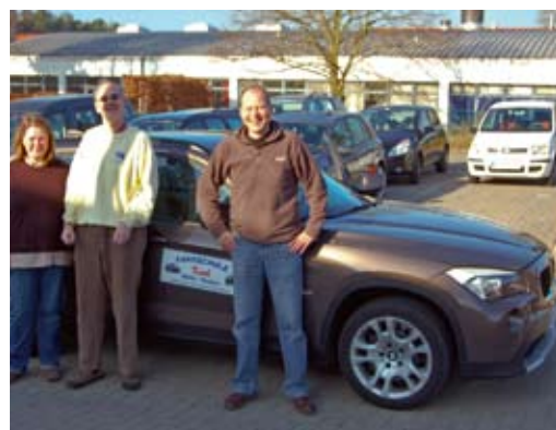
Vorfreude: Gleich geht die Fahrt los.