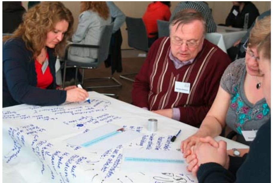
Ideen werden aufgeschrieben ...