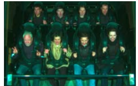
Wilde Fahrt: kopfüber im Karussell.