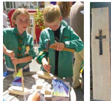
Links: Die kleinen Besucher bauen Boote. Rechts: Die Holzbohle mit dem noch leeren Kreuz

Aus gedrehten Holzringen wurden Fische geschliffen, geschliffen und mit einem Band versehen. Für eine große Holzbohle ist in einem vorbereiteten Kreuz ein Fensterbild aus Acryl-Glas gebaut worden. Die