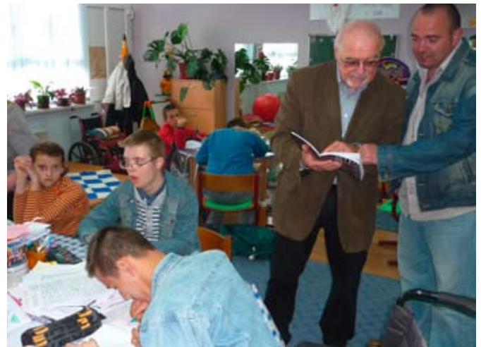
Behinderten Kindern wird ein Unterrichts- und Therapieangebot gemacht.

Die Lehrerinnen und Lehrer und auch andere hauptamtlich tätige Fachkräfte wünschen sich ebenfalls eine Fortbildung. Auch hier wird das Menschenbild eine Rolle spielen sowie heil- und sonderpädagogische Fachthemen. Außerdem sind alle an einem Austausch mit