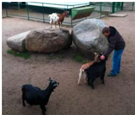
Ziegen in der Streichel-Zoo-Abteilung.