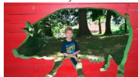
Schwein gehabt: Der besondere Durchblick ...