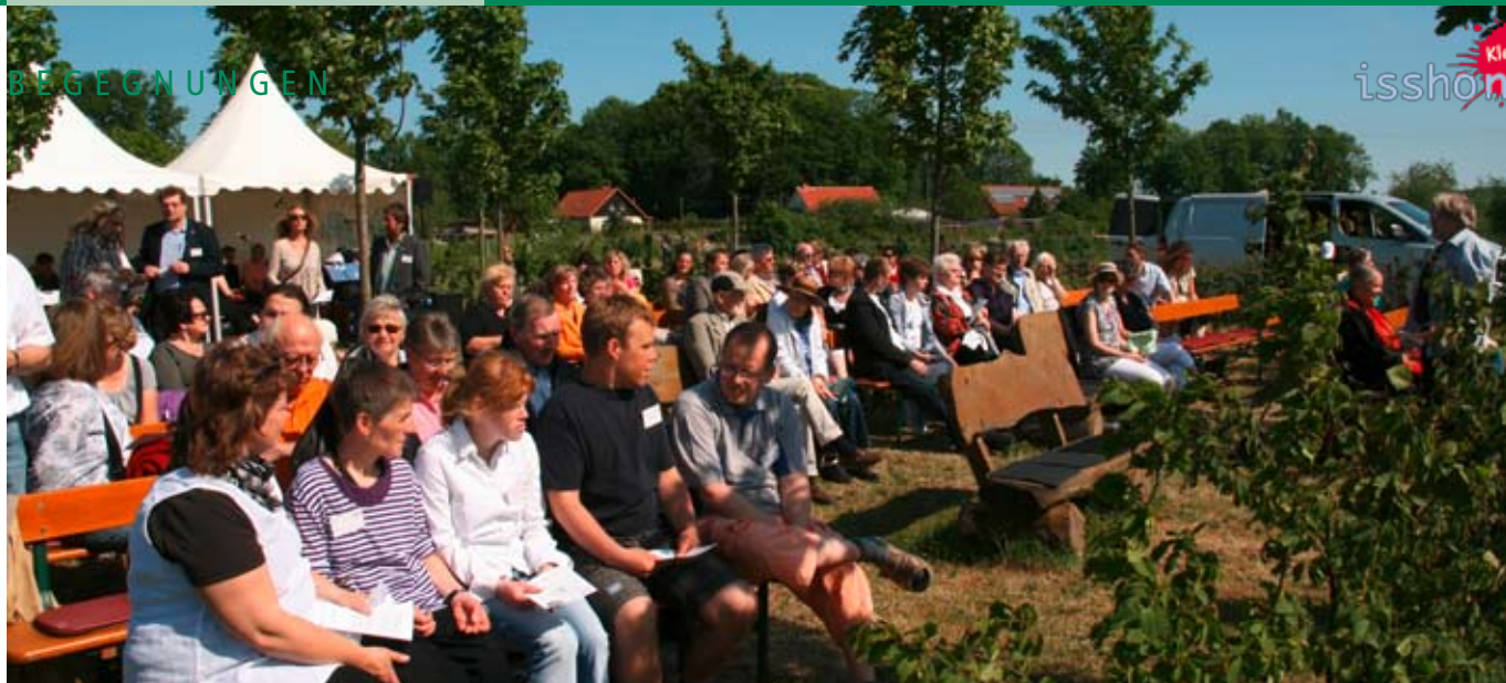
Gottesdienst in der Baumkirche.