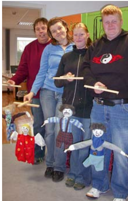
Die Marionetten und ihre Spieler.