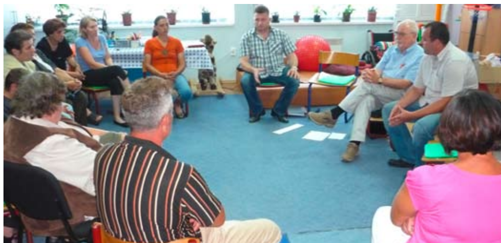
Eltern und Interessierte im Gespräch über das Projekt.