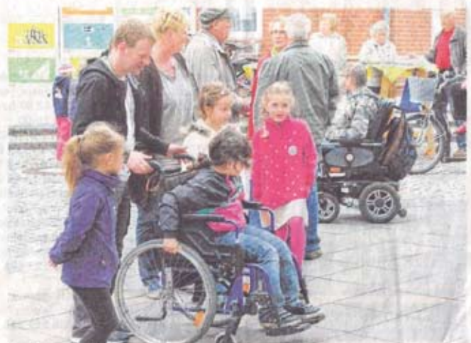
Kinder von der Kita Matroschka und vom katholischen Kindergarten waren die ersten Gäste, die die Mitmachangebote in Anspruch nahmen.

überwinden oder mit einem Langstock und zugebundnen Augen einen Weg zu ertasten. Der Vormittag im Klunk wurde von der Aktion Mensch unterstützt. Denn, so die einhellige Meinung aller Beteiligten, von einer barrierefreien Umwelt profitieren alle. Und je mehr