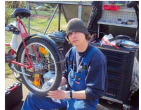
Fast fertig: Nach der Reparatur wird das Fahrrad auf Hochglanz poliert.

Die Arbeiten haben die Monteure mit großer Sorgfalt durchgeführt. Sie haben von den Mitarbeitern des Freizeithauses ein super Feedback bekommen.