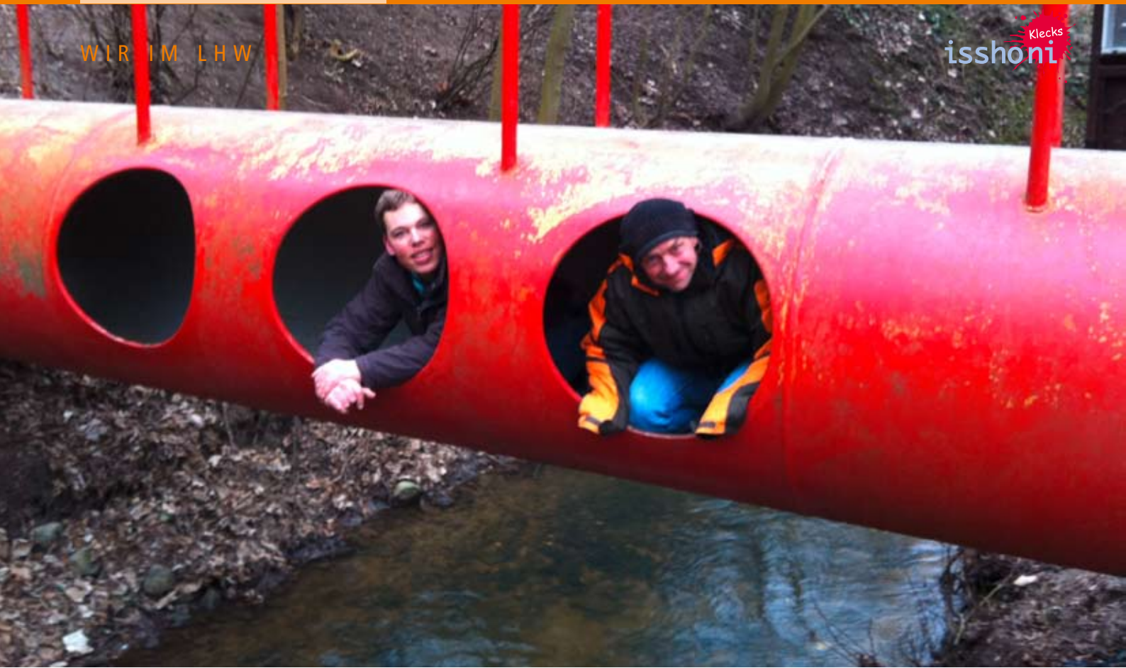
„Durch die Röhre gucken“: Ein besonderer Ausblick.