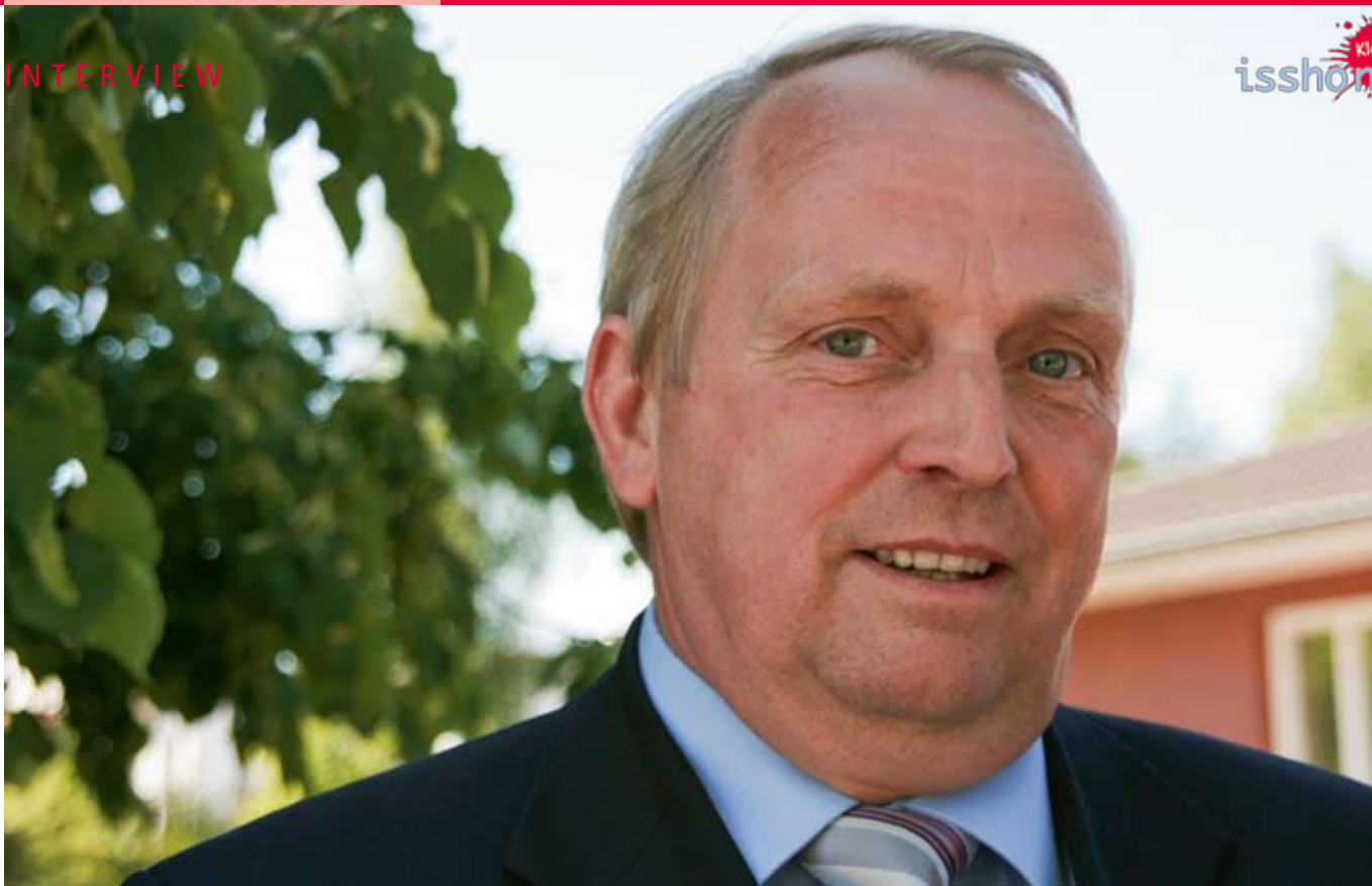
Dr. Till Backhaus – Minister für Landwirtschaft, Umwelt und Verbraucherschutz in Mecklenburg-Vorpommern