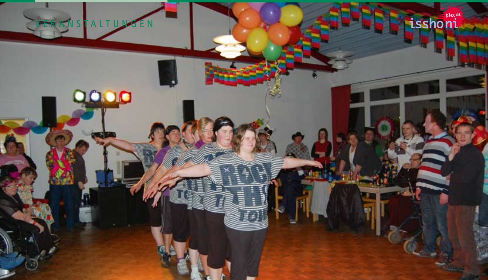
Die Tanzgruppe aus Hagenow gab ihr Bestes.