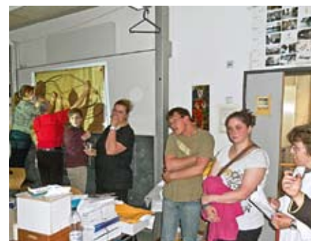
Wir zeichnen das Auto.