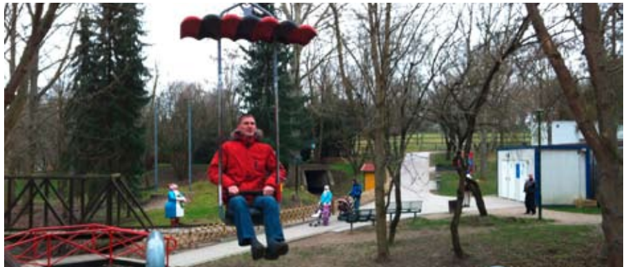
Auf Tour mit der Seilbahn.