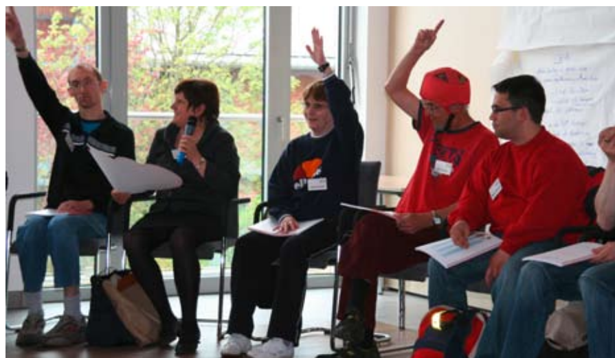
Rege Beteiligung an der Gesprächsrunde.

Als kleines Andenken bekam jede und jeder eine kleine Schnecke mit auf den Weg. Die Schnecke, die als ein Zeichen dafür einmal inne zu halten, ganz ruhig nachzudenken, nichts zu überstürzen, durch die ganze Konferenz begleitet hatte!