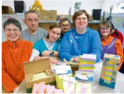
Wir sind die Verpackungsgruppe.

Am 26.01.2012 konnten wir vor Ort in Global Notes eine Führung mit Herrn Zeugner nutzen. In der Firma, die Papier weiter verarbeitet, arbeiten ca. 80 Mitarbeiter im Zwei- bzw. Dreischichtsystem. Eine große Halle und ein noch größeres Lager befinden sich in der unteren Ebene, die Büros in der ersten Etage. Die