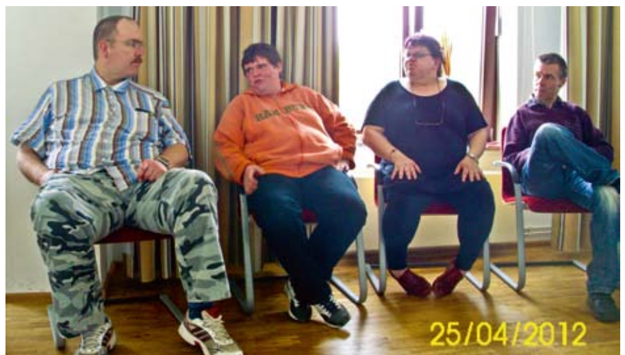
Werkstatrat Hagenower Werkstätten und Betriebsstätten

Es war alles in allem eine gelungene Veranstaltung mit gutem Essen, Gesprächen und Freizeitaktivitäten. Der „Blick über den Tellerrand“ hat sich wieder einmal gelohnt.