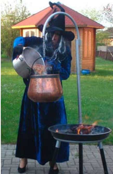
Walburga Blocksberg am Kessel.

Am 30. April war ich, Walburga Blocksberg, auf dem Weg zum Brocken, wo wie in jedem Jahr die Walpurgisnacht gefeiert wird.