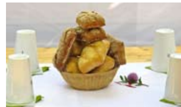
Teil der Ratzeburger Mahlzeit: Frische Brötchen.