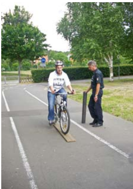
Geschick mit dem Rad übers Brett.

Auch alles, was nach der StVZO (Straßenverkehrszulassungsordnung) am Fahrrad vorgeschrieben ist und vorher im Berufsbildungsbereich geprüft oder repariert wurde, wurde gründlich besprochen und erarbeitet;. Alle Räder wurden nochmals mit der Checkliste geprüft, bis sie verkehrssicher waren.