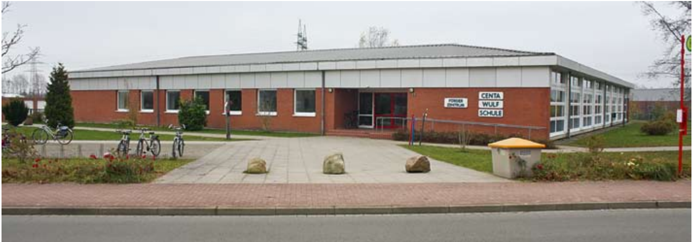
Neues Zuhause: Hier wird das neue Berufliche Förderzentrum Schwarzenbek einziehen.