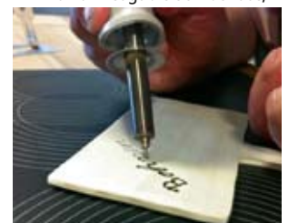
... beschriftet sie mit dem Brennstab ...