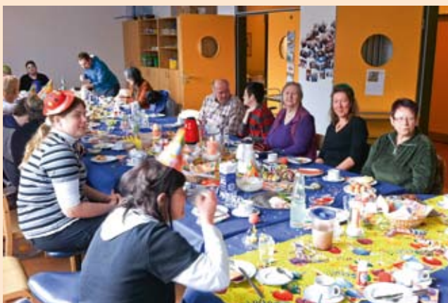
In fröhlicher Runde am bunten Tisch.

Am 17. Februar feierten wir in der Tagesförderstätte am Tempelhofer Weg den Fasching. Unser Gruppenraum wurde feierlich mit Luftschlangen, Konfetti und vielen Luftballons, die dabei natürlich nicht fehlen durften, geschmückt. In einer fröhlichen, lockeren Runde konnten sich die mit Pappnasen und Hüten verkleideten Eltern, zu Betreuende und Mitarbeiter näher kennen lernen, austauschen sowie Fragen und Wünsche für die Zukunft äußern. Gleichzeitig sollte diese Feier für Information und Transparents über die Arbeit der Tagesförderstätte dienen. Durch das leckere Essen, die Faschingsmusik und der guten Atmosphäre war unser gemütliches Beisammensein ein gelungener Tag und wir freuen uns auf die nächste Faschingsfeier.