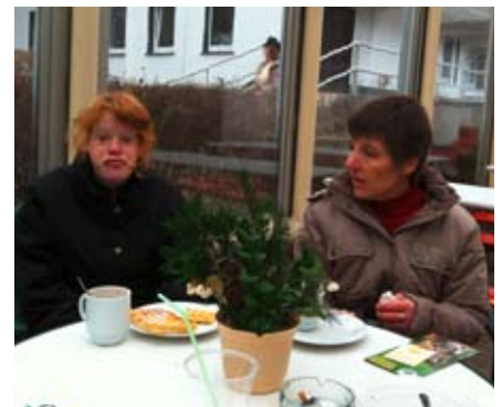
Stärkung muss sein: Die Waffeln schmecken lecker.