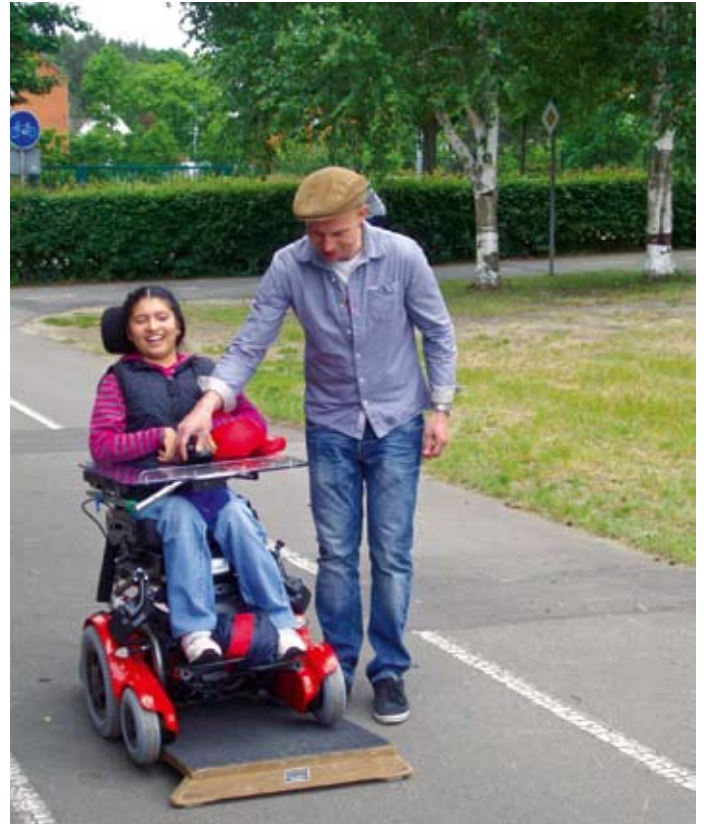
Hier wird es kippelig.