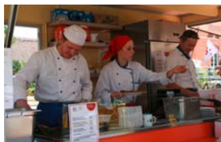
Die Fleißigen Helfer am Grillwagen.