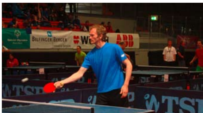
Hochkonzentriert: Beim Tischtennis.