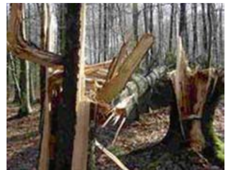
Vom Wind umgeknickte Bäume: In der Fachsprache heißt das „Windbruch“