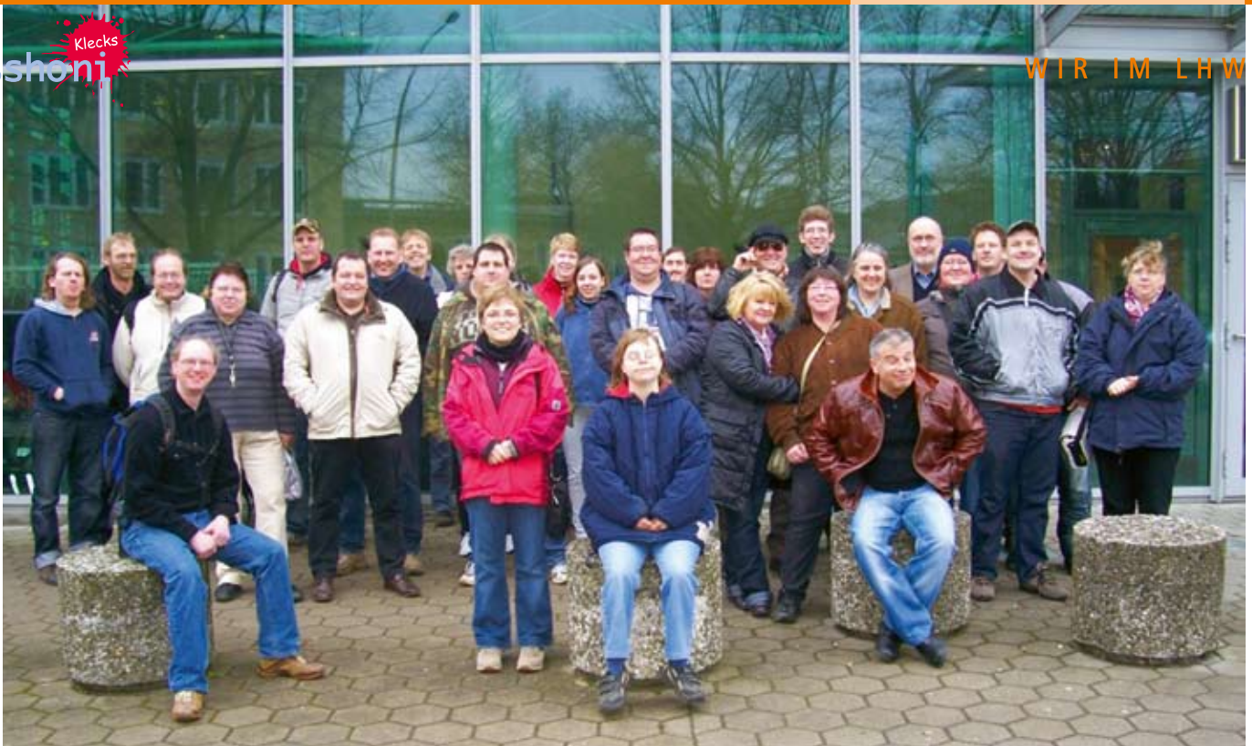
Hier die Internorga-Reisenden.