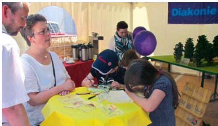
Gemeinschaftsarbeit: Die Scheiben für das Kreuz in der Bohle bemalen und beschreiben.

Holzbohle mit dem bunten Acryl-Glas-Kreuz wird auf dem Arche-Hof Domäne Kneese in der Baumkirche JODOKUS ihren Platz finden. Eine große Herausforderung haben die MitarbeiterInnen der Küchen des Lebenshilfswerkes gemeistert. Die Veranstalter des Gründungsfestes, die Künstler auf der Bühne und die ca. 1300 Pfadfinder, die auf dem Gründungsfest für einen reibungslosen Ablauf und Organisation sorgten,