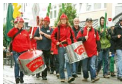
Tolle Unterstützung von Sambalegria.