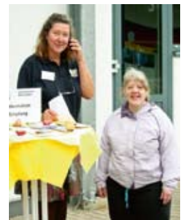
Wir begrüßen unsere Gäste.

Musik, Mitmach-Aktionen, Kaffee, Kuchen und Gegrilltem rundete den gelungenen Tag ab.