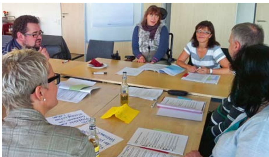
Regel Austausch mit dem Besuch aus Kappeln.

Zum Thema „ICF – leichte Sprache“ luden wir uns eine Gruppe von Beschäftigten aus den Kappeller Werkstätten ein, die sich schon seit längerem mit diesem Thema beschäftigt. Wir trafen uns im „Haus der sozialen Dienste“ in Mölln und übersetzten in kleineren Arbeitsgruppen einzelne Punkte der ICF in den Bereich unserer Arbeit. Das war für alle ein spannender Tag und wir hatten viel Spaß mit den Kappeller Kollegen.