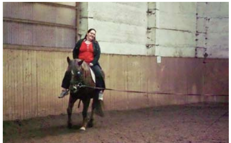
Skolli bei der Arbeit.