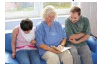
Oben: Vorlesestunde auf dem neuen Sofa.