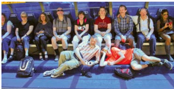
Wir Bildungshungrigen im Bernabeu-Stadion.