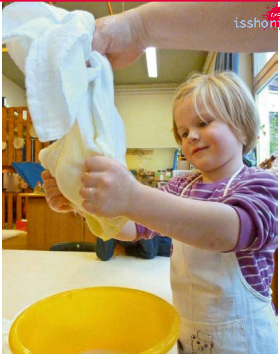
Butter machen ...

Armut ist ein riesiger Bereich, da sind Kinder arm an Liebe und Geborgenheit, da fehlen aber auch einigen Kinder wirklich Mittel zum Leben und viele erleben zu Hause keine Tischgemeinschaft, weil die Familie nicht mehr zum Mittag und Abendbrot zusammenkommt. Es gibt nur noch eine lose Gemeinschaft der Essenden vor dem Fernseher und wir nehmen mit Erschrecken war, dass unsere Kinder gar nicht mehr wissen, was sie essen und woher es kommt... Wir, als