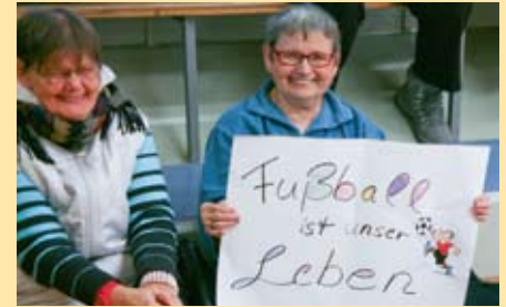
Der Geesthachter Fanblock.