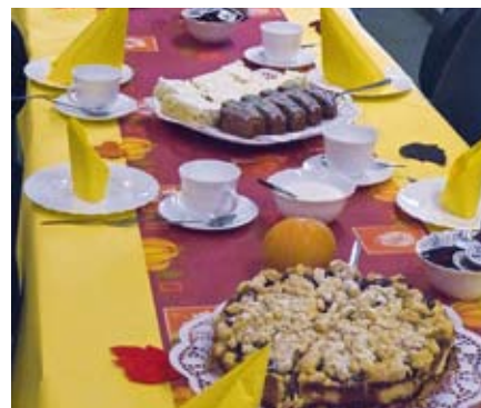
Die liebevoll gedeckte Kaffeetafel