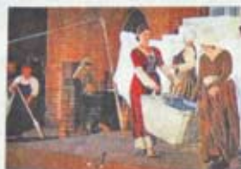
Lebendig gespielt: das bunte Markttreiben vor dem historischen Rathaus.