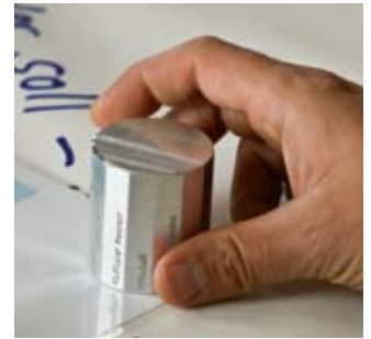
„Der Dialogroller – Wer ihn hält hat das Wort“.

VERBUNDENHEIT Durch die Begleitung eines Menschen wird immer auch unsere eigene Geschichte mit angesprochen. Verbundenheit kann auf verschiedenen Ebenen gesehen werden. In Konflikten z.B. sind wir immer miteinander verbunden. Wir sind mit Menschen verbunden, mit Organisationen verbunden, mit gesellschaftlichen Zusammenhängen verbunden. Wir sind autonom und immer zeitgleich Teil eines Netzwerkes. Ein Bewusstsein hierfür zu haben, meint dieser Aspekt der Verbundenheit.