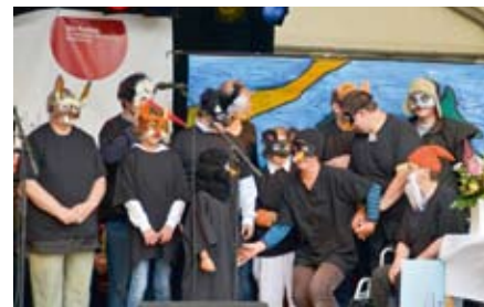
Die Darsteller der Gottesdienstaufführung.

Eine alte, ausgediente Schullandkarte ergab angemalt ein schönes Waldbühnenbild. Mit dem Stinktier William wollte am Anfang keines der Tiere etwas zu tun haben. Aber William bewies, dass er im Gegensatz zu allen anderen Herz und Zivilcourage besaß. Als einziger half er einem Schwächeren in der Not. Das erkannten die Tiere schließlich und gemeinsam konnten sie eine erneut drohende Gefahr abwenden und William war nicht länger der Außenseiter.