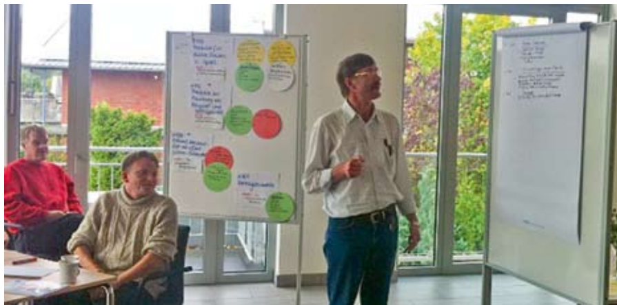
TGS Seminar: Vieles wird gemeinsam erarbeitet.

In den bisherigen Treffen wurden die theoretischen Grundlagen geschaffen. Als erstes ging es darum die Begriffe Teilhabe, Planung und Gestaltung zu klären. Bei dem nächsten Treffen ging es um die Inhalte der Teilhabeplanung bzw. Hilfeplanung. Danach ging es um die ICD 10 und die ICF. Die ICD 10 ist die Internationale statistische Klassifikation der Krankheiten und verwandter Gesundheitsprobleme. Diese Klassifikation wird von allen Ärzten auf der Welt angewendet. Die ICF ist die Internationale Klassifikation der Funktionsfähigkeit, Behinderung und Gesundheit. Sie beschreibt den funktionalen Gesundheitszustand, die Behinderung, die soziale Beeinträchtigung sowie die relevanten Umweltfaktoren von Menschen.