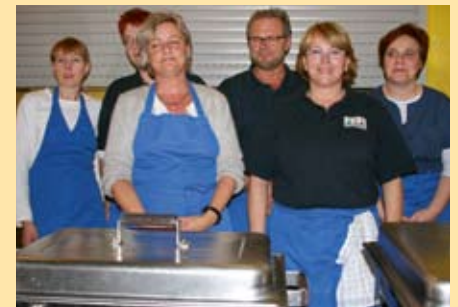
Ein Dankeschön an das Küchenteam.