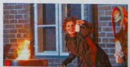
... von dieser Welt – und fällt als Apothekerin Hexengebräu ab.