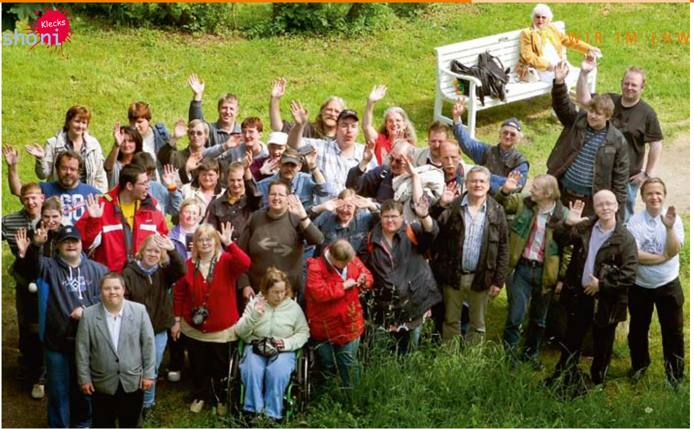
Wir sind die Lichtwerker vom Fotoclub.