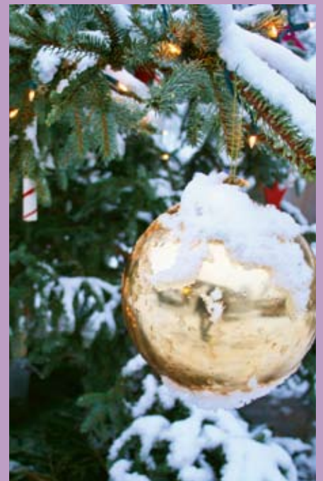
Was glitzert denn da?