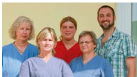
Das Team der Tagesförderstätte.