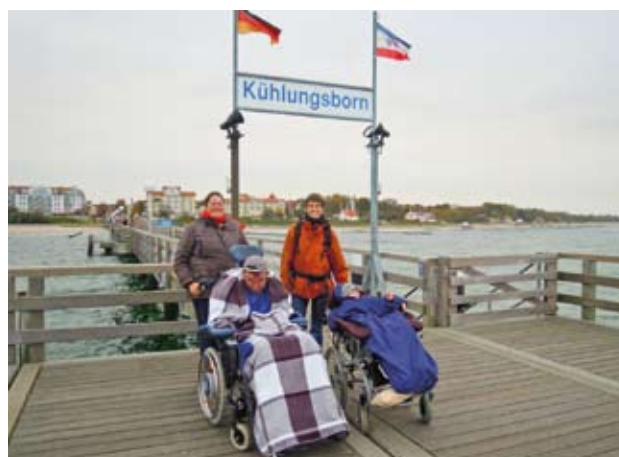
Auf der Seebrücke Kühlungsborn.

Anschluss fuhren wir nach Rerik, um eine zweistündige interessante Schifffahrt im Salzhaff zu unternehmen.