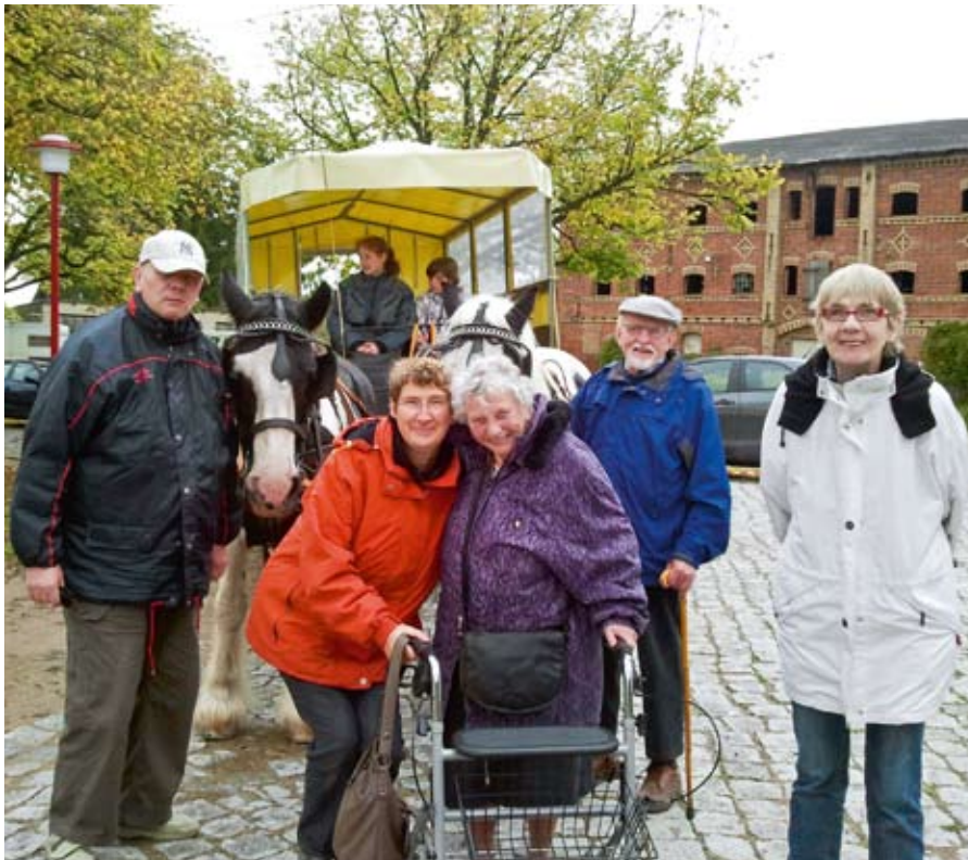
Die Ausflügler genossen die Kutschfahrt durch Kneese.