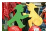
Gemeinsam sind wir stark.

Am Rathausmarkt war der Treffpunkt aller der Einrichtungen und Verbände, aus ganz Schleswig-Holstein und Mecklenburg-Vorpommern, die sich an der großen Aktion beteiligten. Da war was los! Alle hatten sich tolle KRACH-MACH-Instrumente, Verkleidungen und Aktionen ausgedacht um diesen Tag zu gestalten. Viele kreative Ideen gab es zu bestaunen und viele unterschiedliche Menschen waren dabei.