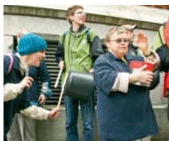
Trommeln was das Zeug hält!