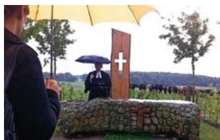
Unverdrossene 2- und 4-Beiner nahmen an der Einweihung des Kreuzes teil.

mit Herrn Scriba zur Baumkirche. Hier stieg die Teilnehmerzahl rasant an. Etwa 100 Rinder unserer Angus-Herde konnten ihre Neugier nicht zügeln und verfolgten die christliche Handlung aus nächster Nähe.