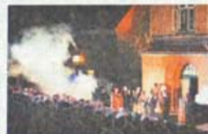
Volle Ränge: Das Publikum ist begeistert.