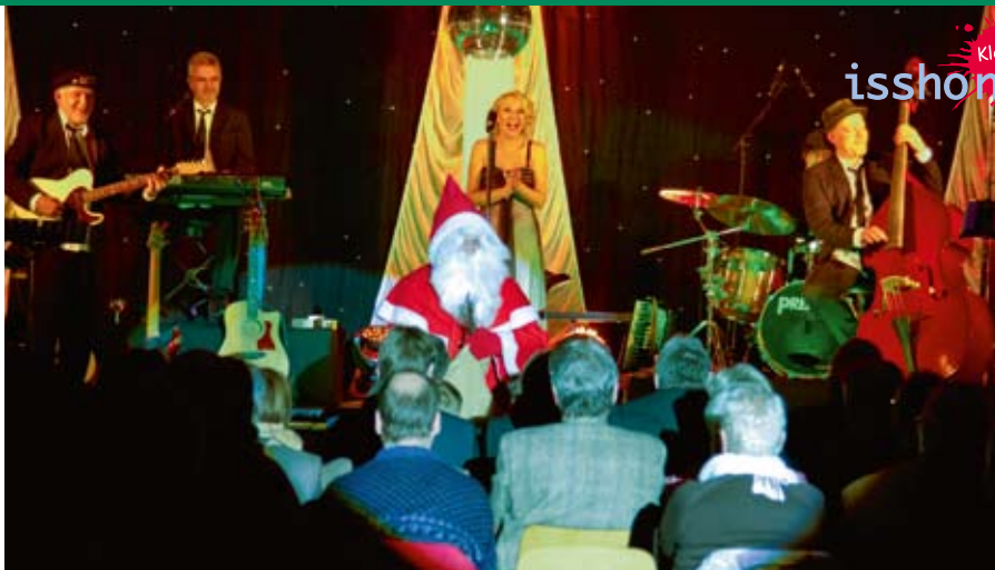
Ein Fan im roten Mantel von ganz weit oben.