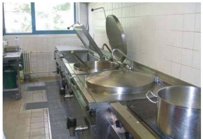
... da passt ein bisschen mehr rein.