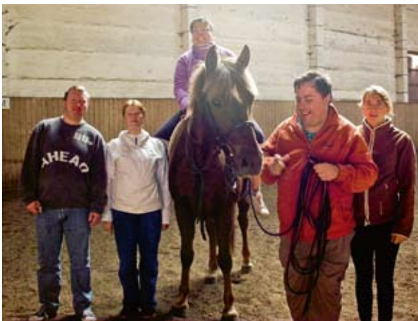
Skolli und seine Fans.