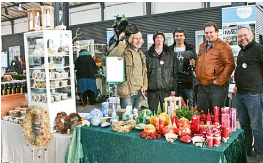
Das Team vom NDR mit den Protagonisten des LHW auf dem Markt in Wismar.