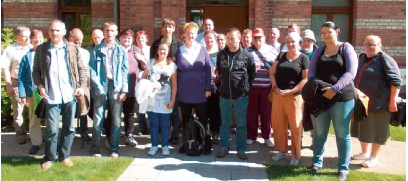
Das Treffen des Werkstattrats