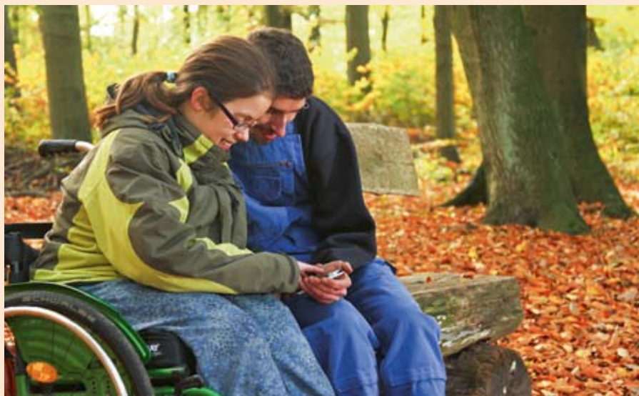
Romantischer Herbsttag: Wer sagt denn, dass man gemeinsam auf einer Bank sitzen muss? So geht es doch auch!