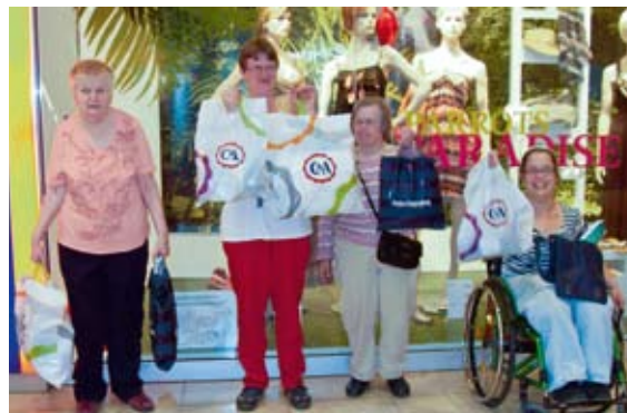
Die Damen beim Shoppen.