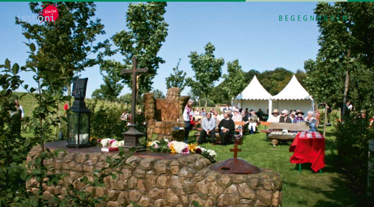
Die Baumkirche auf dem Archehof-Gottesdienst zur Bewahrung der Schöpfung.