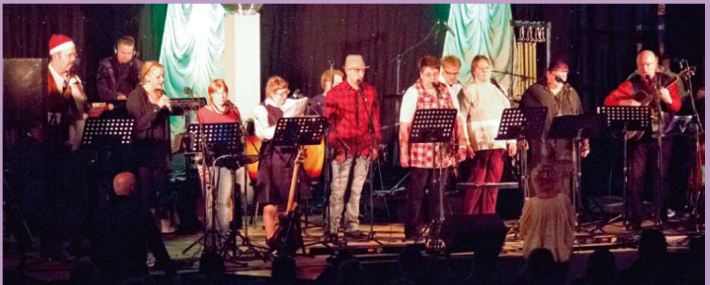
Beim Godewind-Weihnachtskonzert: Bandicap macht Stimmung