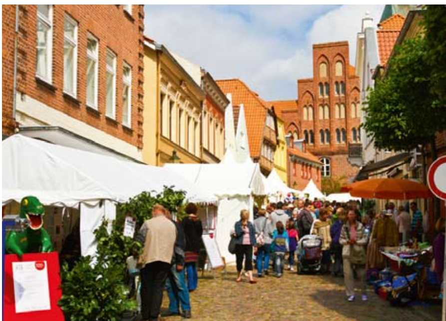
Die Marktstraße am Sonntag.