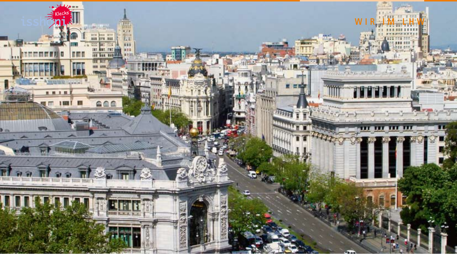
Madrid von oben.

Wir konnten zu einem tollen Sonderpreis dieses Stadion besichtigen, saßen auf den gepolsterten Sitzplätzen der Topspieler wie Sami Khadeira und Mesut Özil und bestaunten die vielen glänzenden Pokale. Wegen der Hitze mussten wir etliche Pausen einlegen und kühle Getränke zu uns nehmen.