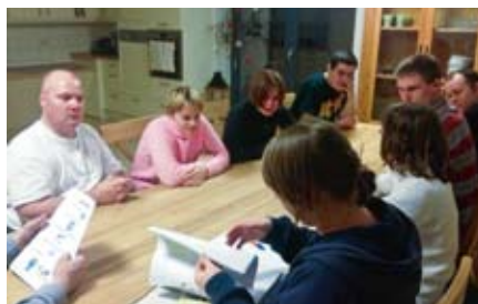
Es gab viel zu besprechen.

Die BewohnerInnen beginnen ihre Heimbeiratssitzung mit dem gemeinsamen Kochen eines Gerichts ihrer Wahl. Dieses wird dann zusammen eingenommen. Im Anschluss eröffnet der Vorsitzende des jeweiligen Hauses die Heimbeiratssitzung und begrüßt seine MitbewohnerInnen. Zuerst wird das Protokoll der letzten Sitzung verlesen, meist übernimmt