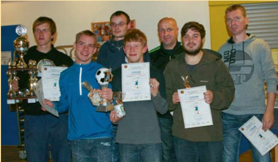
Die Sieger aus Hagenow.