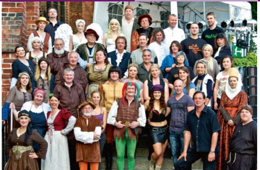
„Zwischen Himmel und Hölle“: Das Ensemble.