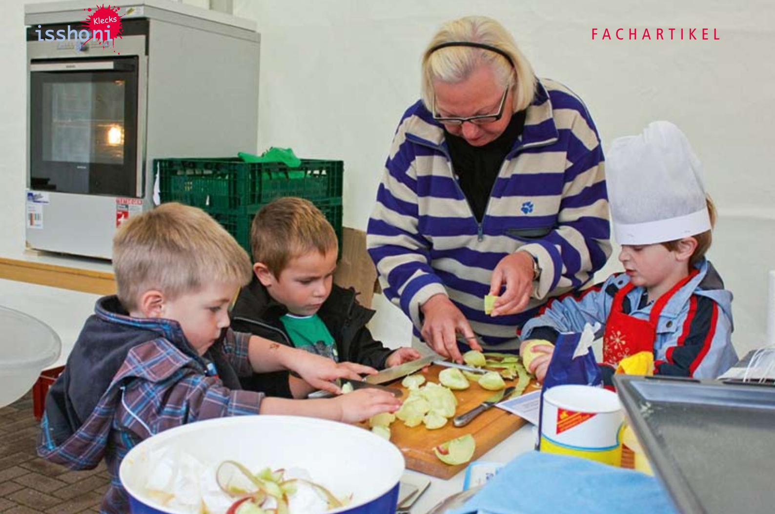
Gemeinsam Kochen: Emsiges Schnippeln ganz ohne Tränen.