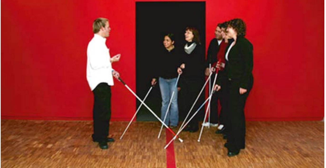
Dialog im Dunkeln – eine Ausstellung zur Entdeckung des Unsichtbaren. Die Gärtner aus Geesthacht haben es entdeckt!