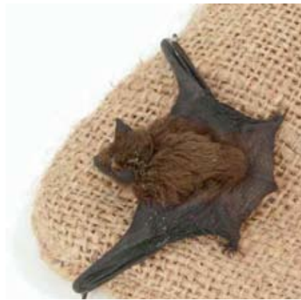
Steht unter Naturschutz: Die Fledermausart „Kleines Mausohr“.

Die Fledermaus und die Eule sind sehr wichtige Tiere für uns, da diese sich von Insekten und Mäusen oder Ratten ernähren, die für uns Menschen natürlich auch unangenehm werden können.