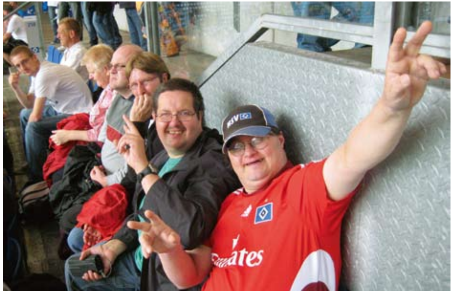
Echte Fans beim HSV 125 Jahre Liga Cup

Wir Fußballfans von den Möllner Wohnstätten fuhren mit 2 Kleinbussen frühzeitig los, um nichts von diesem Fest zu verpassen. Im Stadion angekommen genossen wir die einzigartige Arenaatmosphäre. Lotto-King-Karl heizte die Stimmung an und die Finalspiele begannen. Unser HSV verlor dann leider mit 0:1 gegen die starken Bayern. Das Endspiel entwickelte sich zu einem wahren Fußballkrimi. Die Bremer führten schnell mit 2:0 dann holten die Dortmunder auf und gingen mit 3:2 in Führung. Kurz vor Ende gelang den starken Bremern noch der 3:3