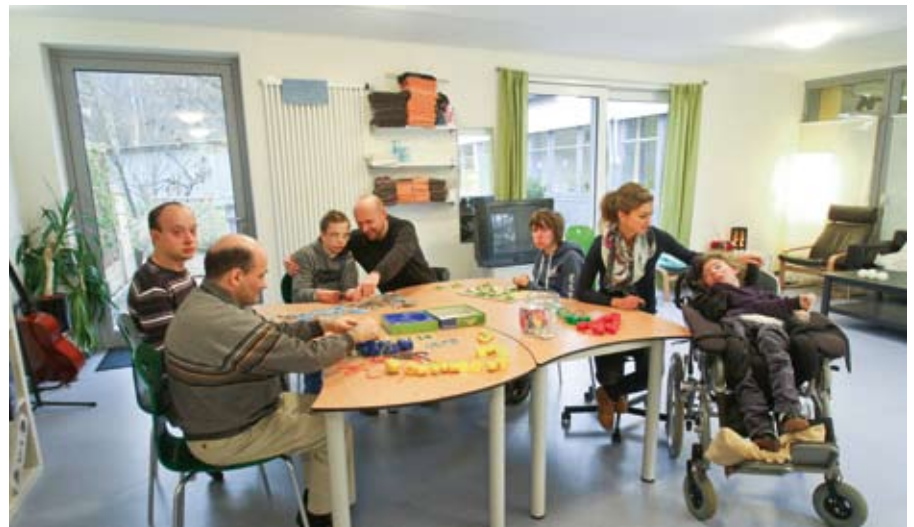
Schöne neue Räume für der Tagesförderstätte.

Ende August konnte, mit mehr als 6-monatiger Verspätung, der Anbau unserer Tagesförderstätte in Betrieb genommen werden. Die Betreuten und Betreuer waren froh, dass nach vielen Einschränkungen durch die Baumaßnahmen endlich Ruhe einkehrte und die hellen, freundlichen Räume in Besitz genommen werden konnten!