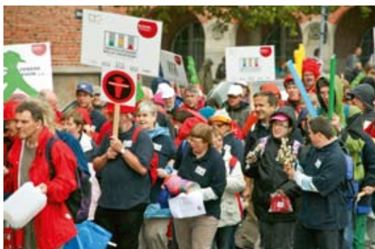
Wir sind viele!