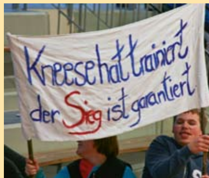
Der Fanblock aus Kneese hatte hier noch Hoffnung auf den Turniersieg.

Auch in diesem Jahr fand wieder das Fußballturnier des LHW-Verbandes in Geesthacht statt. Bereits im Eingangsbereich der städtischen Sporthalle konnten sich die Zuschauer mit Kaffee, Kuchen und kleinen Snacks eindecken. Angetreten sind 6 Mannschaften. Jeder spielte gegen jeden, 10 Minuten pro Spiel. Genug Zeit den zahlreichen Zuschauern viele Tore zu präsentieren und seine Mannschaft zum Sieg zu führen. Mit Fairness, starker Beinarbeit und viel Schweiß setzten die Mannschaften dieses um. Bejubelten gemeinsam mit den Fans die geschossenen Tore und auch wenn kein Tor geschossen wurde, wurden die SpielerInnen durch Plakate, Klatschen und Rufe angefeuert. Das Anschließende Essen in der Werkstatt im Heuweg war wieder sehr lecker und trug zum Ausklingen des spannenden Nachmittags bei. Durch Herrn Meißner wurden schließlich die Platzierungen bekannt gegeben: