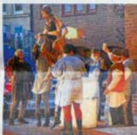
Zünftig: Die Mülner wissen zu lesem.