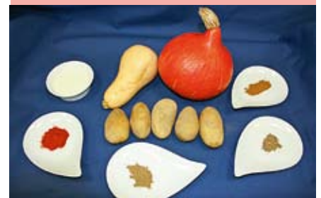
Mmmhhh ... leckeres Gemüse: Schön bunt und ganz frisch zubereitet