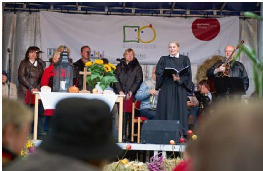
Dem Regen zum Trotz – Gottesdienst auf der Bühne.