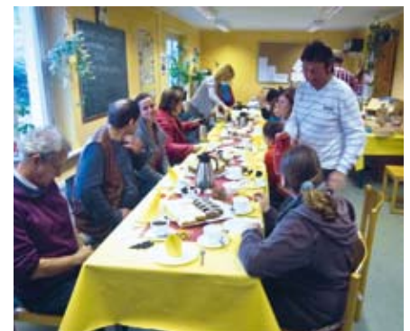
Gäste und Teilnehmer in geselliger Runde.

Um 14 Uhr waren fast alle Eltern und Betreuer anwesend. Die Teilnehmer zeigten sich sichtlich aufgeregt und stolz.