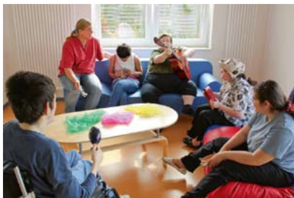
Schöner Raum mit schöner Musik.