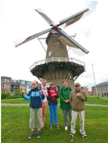
Typisch Holland: die Windmühlen.