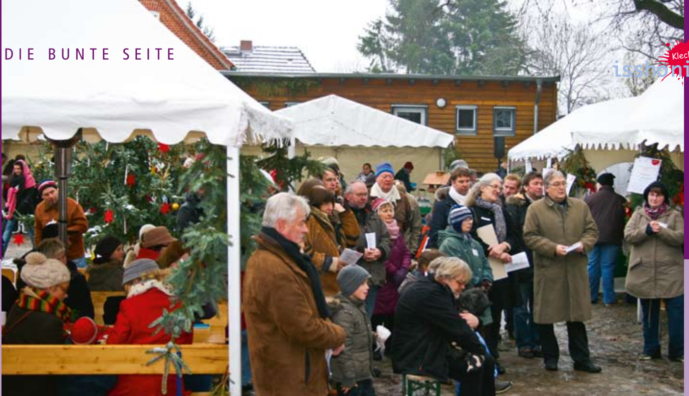
Stimmung auf dem Arche-Hof-Weihnachtsmarkt.