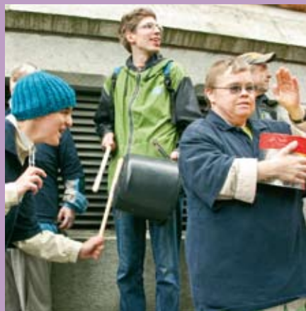
Beim Krach-Mach-Tach in Kiel.