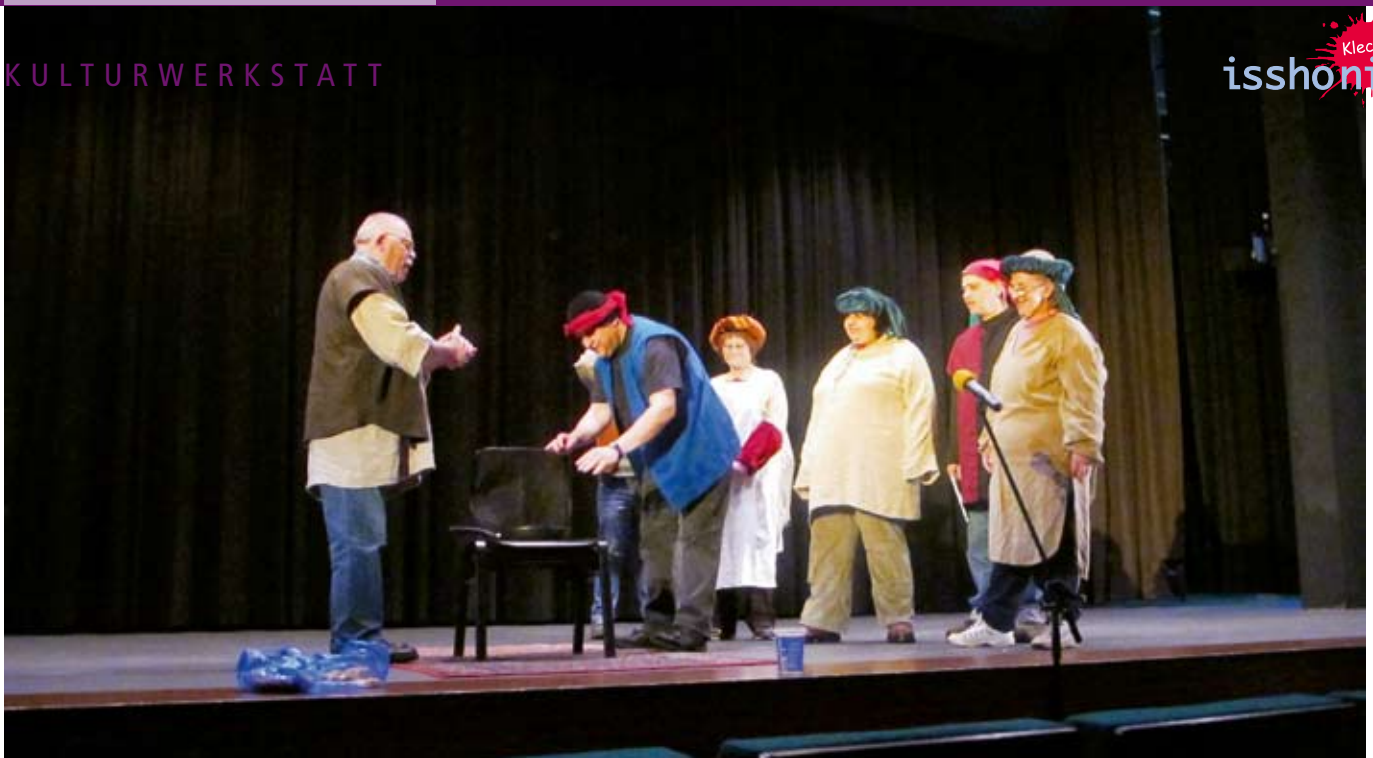
Die Aufführung „Klang des Geldes“ im Augustinum.