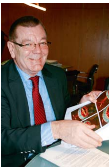
Landrat Gerd Krämer

„Die Unterzeichnung des Landesrahmenvertrages schafft eine gute Grundlage für eine Zusammenarbeit zwischen Leistungserbringern, wie dem Lebenshilfswerk, und den Leistungsträgern, wie dem Kreis Herzogtum Lauenburg. Ich hoffe, dass dies auch in den individuellen Verhandlungen zu einer konstruktiven und produktiven Arbeit beiträgt. Noch offene und sich auch in Zukunft neu stellende Fragen, müssen in der