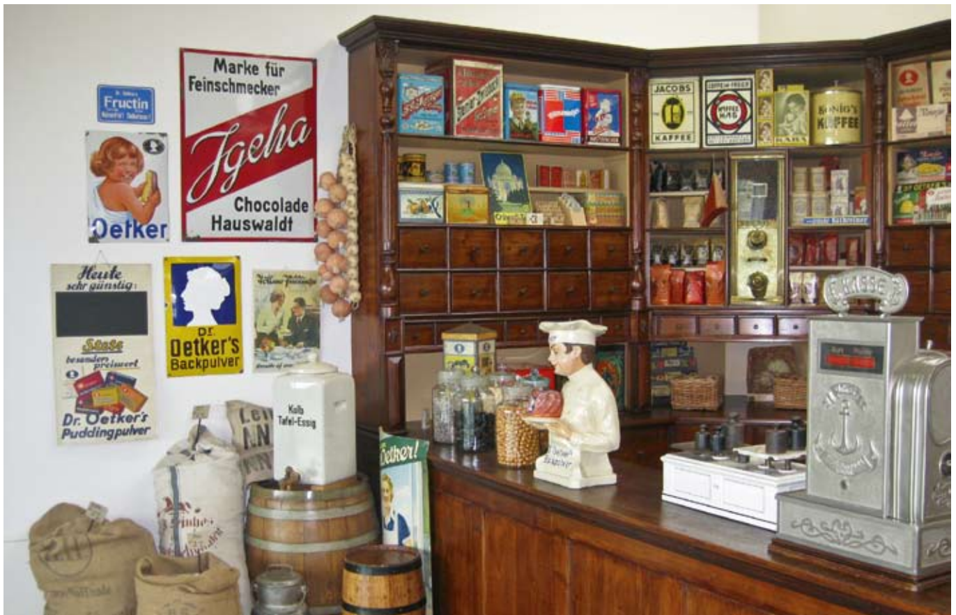
Der gute alte Kaufmannsladen.

Als wir nach zweieinhalb Stunden das Werk verließen, war doch manch einer aus unserer Gruppe beeindruckt. Wir fuhren zurück nach Essen, wo wir uns im Hotel kurz erfrischten, dann ging es mit den Fahrzeugen nach Bochum, wo wir uns das Musical „STARLIGHT-Express“ anschauten. Farbenprächtige Kostüme sowie Lichteffekte untermalt von lauter Musik; konnten den hohen Eintrittspreis jedoch nicht rechtfertigen. Die Akteure auf Rollschuhen, trugen Namen großer Eisenbahngesellschaften, wie z.B. TVG, ICE und SHIKANSEN. Als wir nach