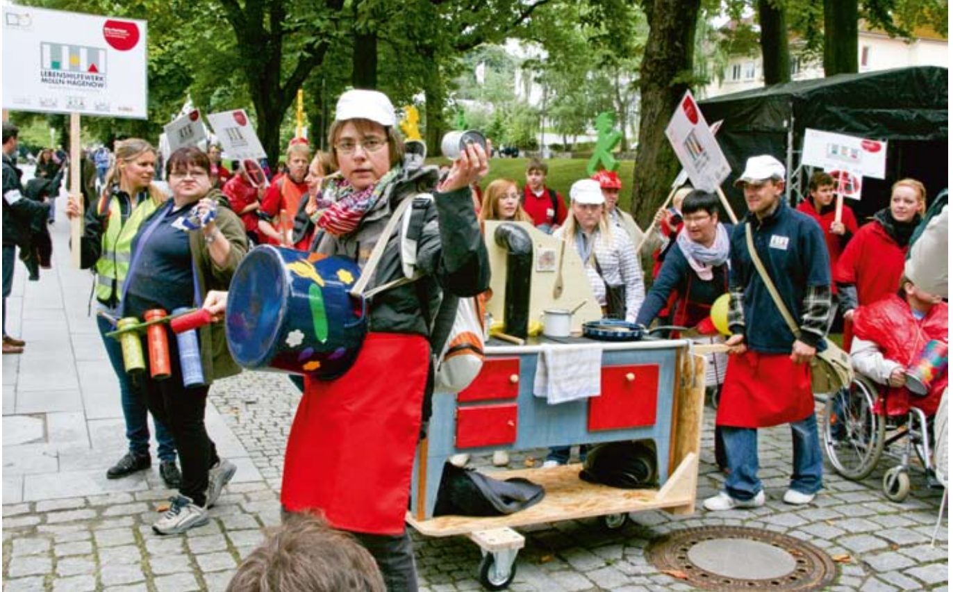
Die brodelnden Töpfe des Berufsbildungsbereichs aus Hagenow.