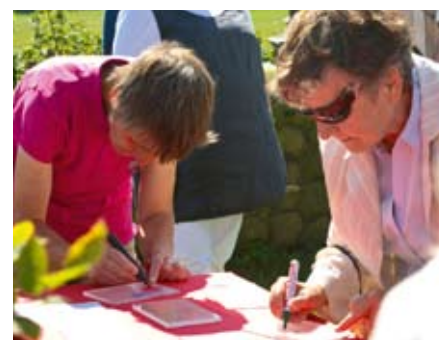
Plexiglascheiben werden mit Wünschen versehen.