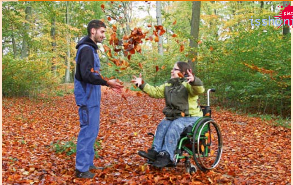
Herbstblätter sammeln zum Dekorieren? Das geht auch schneller – hier fang!