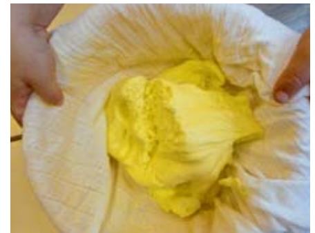
Die Butter ist fertig!

konnte. Nicht unerwähnt sei, dass das Projekt von einigen Firmen unterstützt wurde.