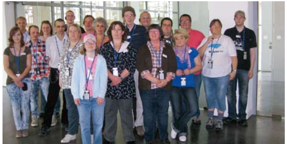
Die Reisenden aus Mensen und Küche.

Der Samstag begann bei einem guten Hotelfrühstück, bevor wir nach Bottrop in den „Movie-Park“ aufbrachen. Um „12 UHR-MITTAGS“ löste sich unser großer Tross in kleine und kleinste Grüppchen auf. Jeder bummelte nach eigenem Können und Wollen durch „Little America“, wir sorgten für so manche „Gaudi“. Stuntshows, Filmmuseum und Fahrgeschäfte waren die Highlights für Groß und Klein. Es regierten aber auch Kitsch und Nepp das bunte Treiben. Am frühen Abend wieder in Essen angekommen, verblieb allen Teilnehmern noch etwas Zeit für eigene Aktivitäten, bevor es zum Abendessen in ein schickes italienisches Restaurant, dem „CASA-LEO“ ging. Gegen 24 Uhr war der Spuk leider viel zu früh vorbei. Der Sonntag begann natürlich wieder mit einem opulenten Breakfast. Bevor es um 11 Uhr auf die