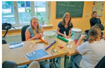
Der Berufsbildungsbereich der Hagenower Werkstatt und das Freizeithaus der AWO beim kreativen Bau ihres tollen Krachmachers.

Zunächst ging es aber darum, ein gemeinsames Motto auszuwählen. Das FZH hatte im Rahmen der Badewannenregatta zum Altstadtfest 2012 in Hagenow ein großes Floß mit zwei Küchenzeilen gebaut. Mit dieser Aktion wollten sie für eine neue Einbauküche im FZH werben. In Anlehnung an diese Idee kam uns ganz schnell der Gedanke, diese Küchen für unsere Aktion zu nutzen, denn mit Küchenutensilien (Töpfe, Schüsseln, Pfannen) konnten wir kräftig Krach