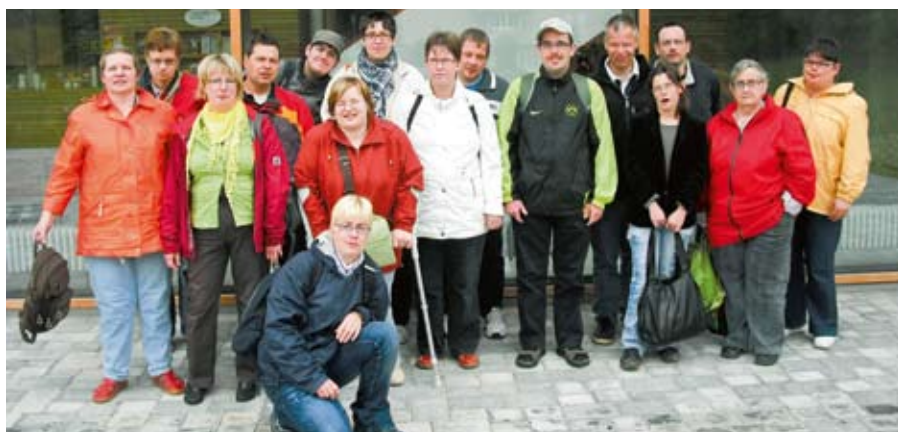
Die Verpackungsgruppe der Hagenower Werkstätten.