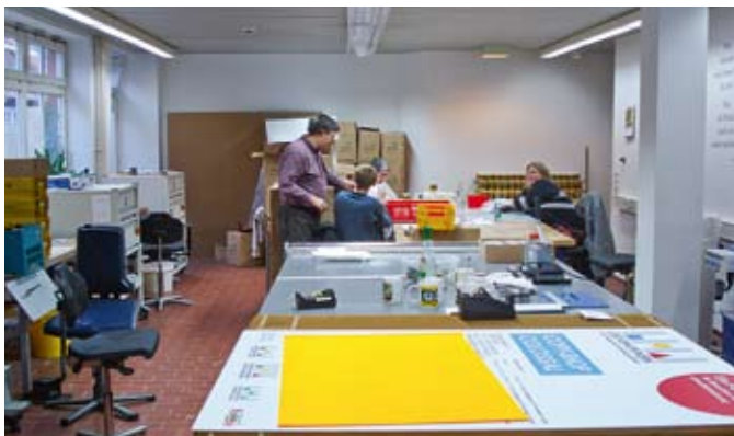
Schön viel Platz in den renovierten Räumlichkeiten.

Der gesamte Copyshop ist umgestaltet worden mit geeigneten Arbeitstischen und Regalsystemen, dem Bau eines neuen Kunden- und Kassentresens, geeigneten Computerarbeitsplätzen und Renovierung des Kundenbereiches. Dieses wurde von unseren Kunden positiv angenommen.