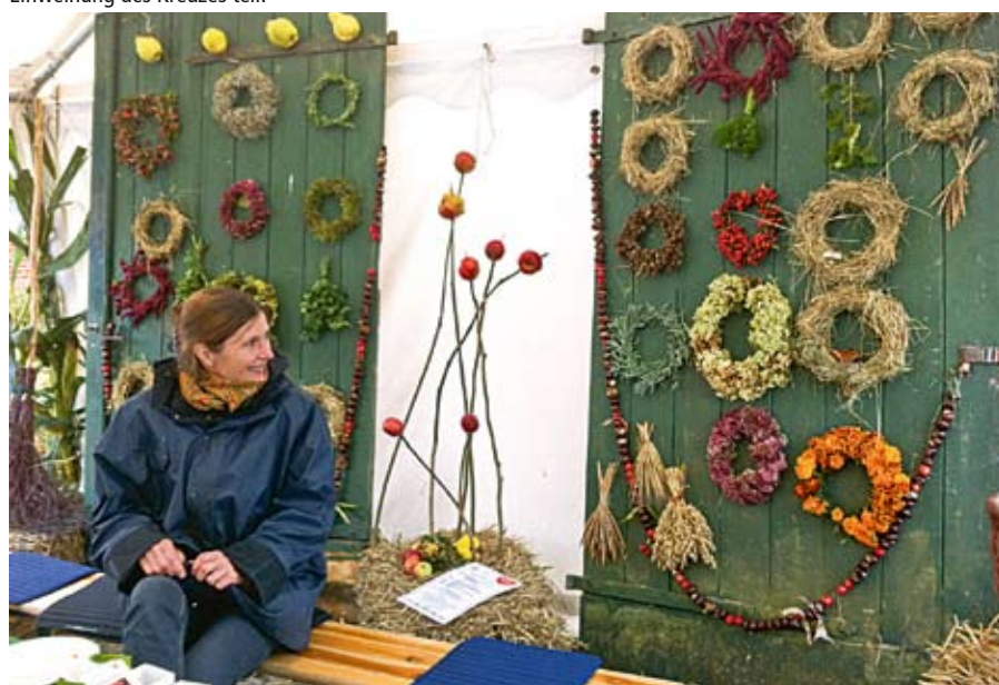
Wunderbar herbstliche Dekorationen.

Schlosserei der Möllner Werkstätten fertigte eine Metallhalterung und stellte das Kreuz in der Baumkirche auf. Das ausgesägte Kreuz in dem Holz ist so dimensioniert, dass die Plexiglasscheiben, die bereits zu Pfingsten auf dem Fest der Nordkirchengründung in Ratzeburg, dem Gottesdienst zur Bewahrung der Schöpfung und auch auf dem Erntedankfest mit guten Wünschen beschrieben und bemalt wurden, in diesen Hohlraum passen.