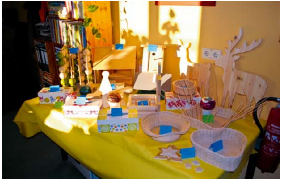
Wunderschöne Dinge wurden gefertigt.

Einige Teilnehmer hatten sich ganz viel Mühe bei der Vorbereitung gegeben. So wurden am Mittwoch schon 4 Kuchen und Torten gebacken und am Donnerstagvormittag die Tafel festlich gedeckt. Andere Teilnehmer hatten einen Tisch mit allen bereits entstandenen Vogelhäusern, Körben, Schlüsselkästen, Steckkugeln oder anderen Arbeiten vorbereitet. Die Freude war groß, als alles geordnet und sichtbar wurde, was in den letzten zwei Monaten schon geschafft und erlernt wurde.