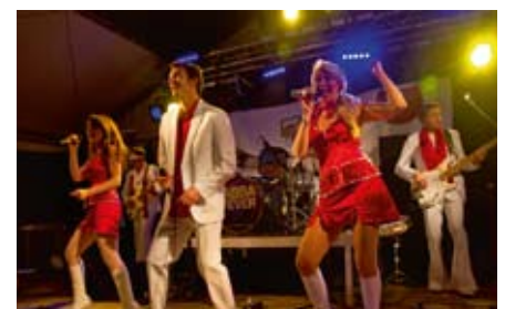
ABBA Fever heizt ein.