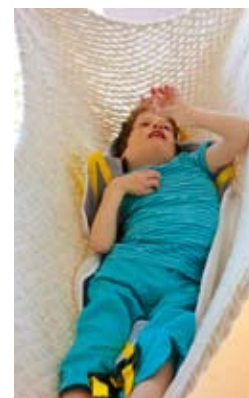
Einfach mal abhängen ...