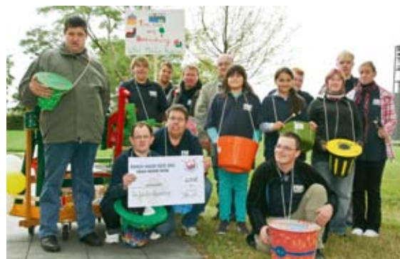
Tom Tom der BBB aus Boizenburg.