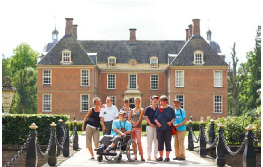
Gut gelaunt: Die Teilnehmer hatten viel Spaß in Holland.