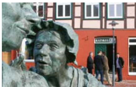
Kiek mol: in de Ratskeller deit sik wat!

Nach vielen Jahren des Leerstandes tut sich was in den Räumen des legendären Ratskellers in Hagenow! Nach langem Planen, Rechnen und Verhandeln kam es am 01.11.2013 nach der kürzlich erteilten Kostenzusage durch den KSV zur feierlichen Unterzeichnung des Mietvertrages zwischen Familie Kauschka, Besitzer des Hauses und dem Lebenshilfswerk.