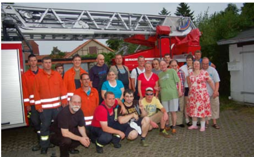
Gruppenfoto mit Bewohnern und Feuerwehrleuten nach der Übung.

Gut in brandschutztechnische Abläufe unterwiesene Menschen mit Behinderungen, verbunden mit einer schlagkräftigen Feuerwehr vor Ort, können alle Bewohnerinnen und Bewohner der Hagenower Wohnstätten ruhiger schlafen lassen.