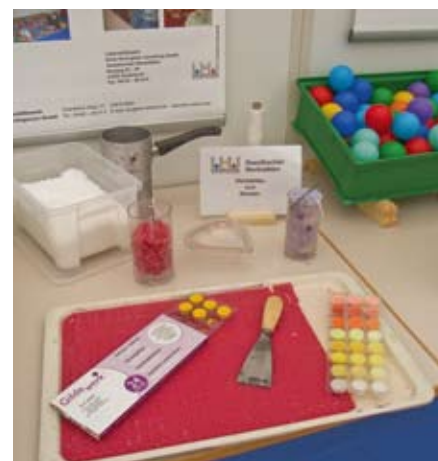
Präsentation des Materials zur Kerzenherstellung und der Ballwaschmaschine.