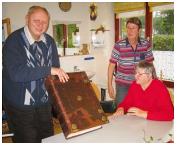
Groß, alt und schwer ist das kostbare Buch.