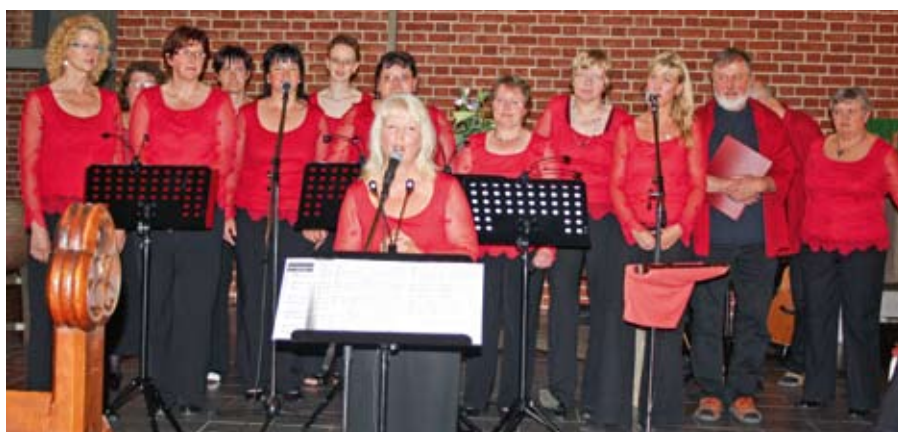
„Carpe diem“ – die Gastgeber des Chortreffens.

Heiter und beglückt verabschiedeten sich alle voneinander in der Vorfreude auf ein weiteres Chortreffen in 2 Jahren.