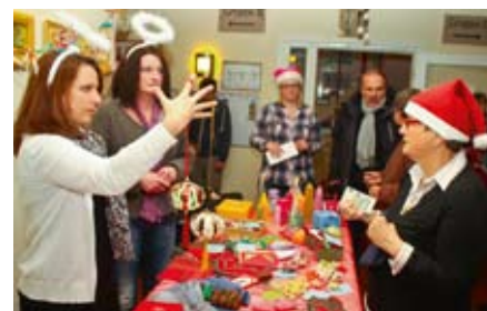
Adventskaffe mit Engeln und Nikoläusen.