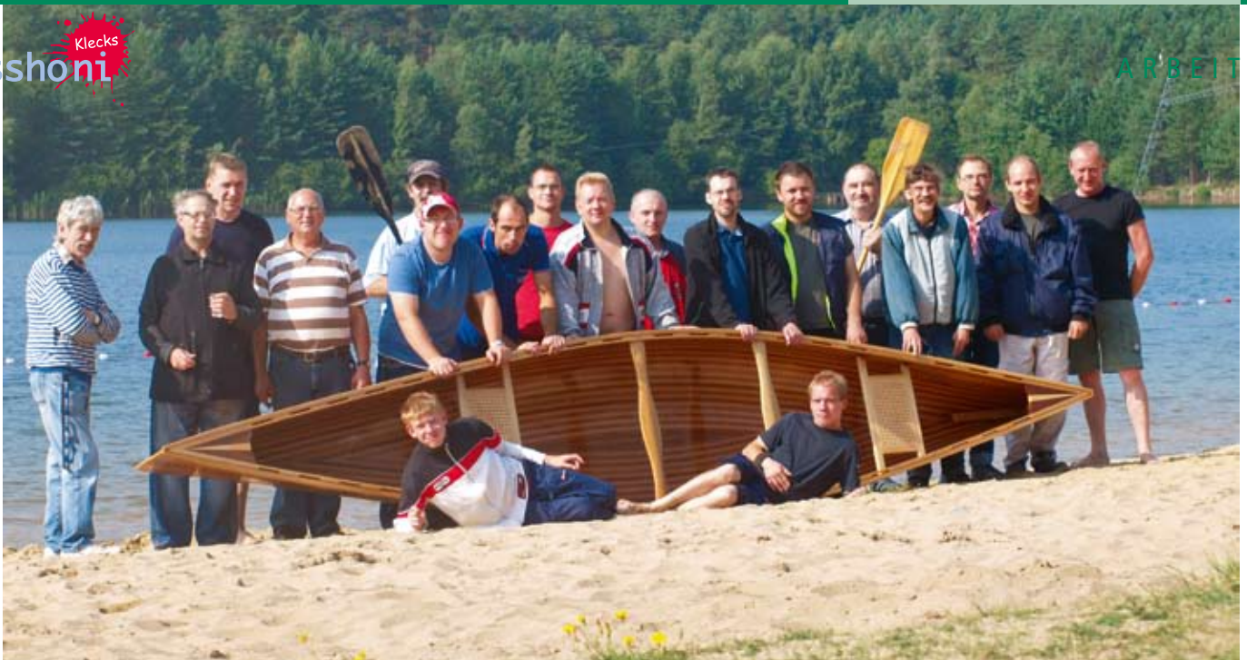
Auf ein solches selbstgebautes Kanu kann man einfach nur stolz sein.