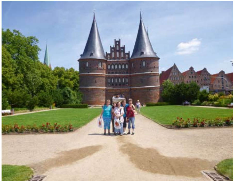
Die Hauswirtschaftsgruppe vor dem Lübecker Holstentor.