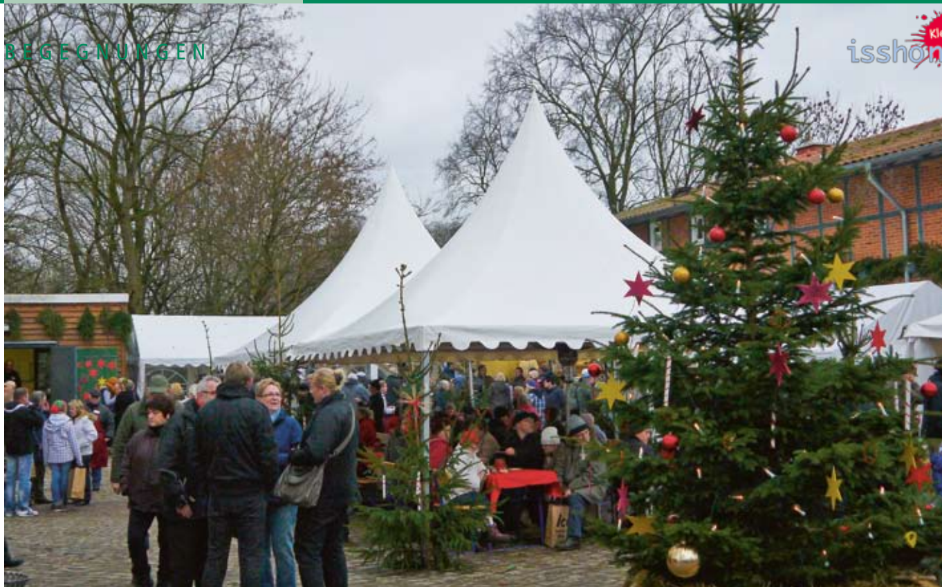
LHW Weihnachtsmarkt Kneese.