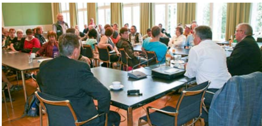
Anschließende Diskussion und Fragerunde mit dem Landtagspräsidenten Klaus Schlie.

extremistischer Gruppierungen und wie es ihnen gelang, sich später von diesen Gruppierungen zu distanzieren. Viele bekamen Lust, sich stärker politisch zu beteiligen.