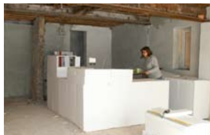
Verkaufstresen – Modell aus Styroporplatten.

vor Ort gerösteten Kaffee – als Filterkaffee oder Espresso geben. Der Kaffee kann als Bohne oder gemahlen gekauft werden oder mit einem Stück Kuchen in den gemütlichen Räumen des Ratskellers genossen werden. Für den kleinen Hunger wird es einige Snacks im Angebot geben. In den Einrichtungen des LHW wird es in Zukunft ebenfalls den Kaffee aus Hagenow geben.