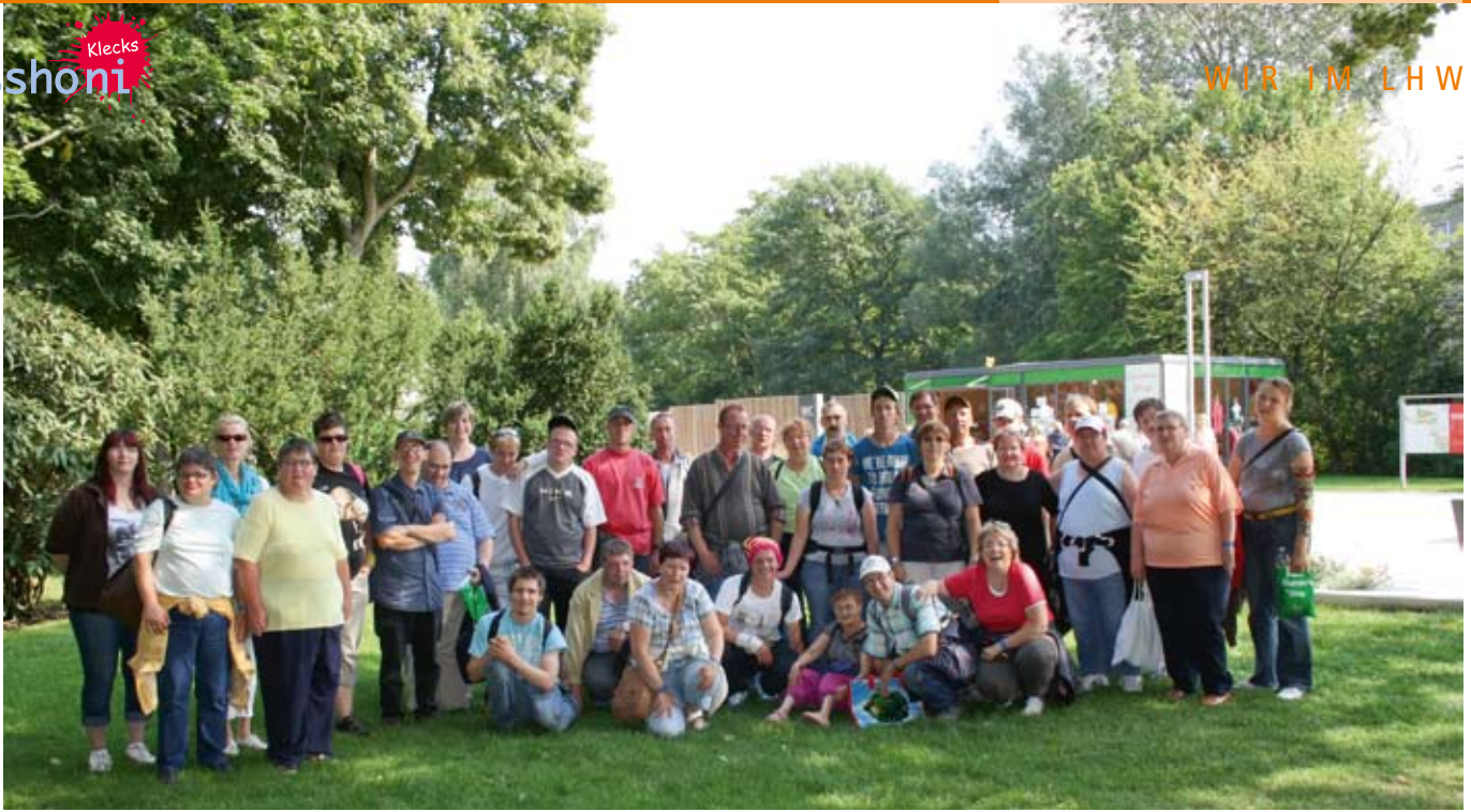
GaLa-, Hauswirtschaft- und der Berufsbildungsbereich der Hagenower Werkstätten auf der IGS.