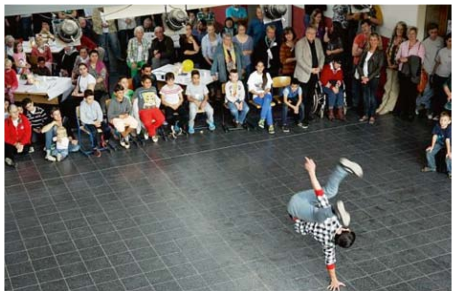
Die G-Breaker wurden nicht ohne Zugabe von der Bühne gelassen. (ARTIKEL | DI, 17/09/2013 - 12:04 | VON ANDREAS ANDERS)