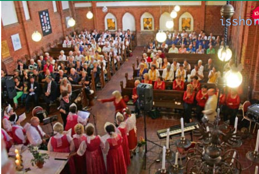
Ein stimmungsvoller Veranstaltungsort.