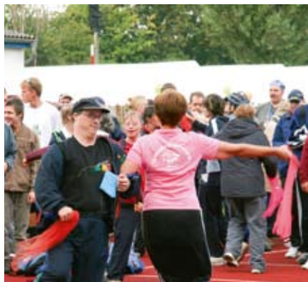
Voller Einsatz beim Aufwärmen.

Beim traditionellen Fußballspiel der Mannschaft der Hagenower Werkstätten gegen die Schülermannschaft des Gymnasiums gewann die Mannschaft der Werkstatt nach einem spannenden 9 Meter-Schießen 2:1.