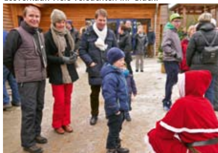
Der Weihnachtsmann war auch da.