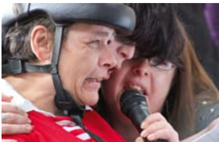
Auftritt Messe Schulberg.

denn am Montag den 1. Juli 2013 ging es gemeinsam nach Hannover. Dort empfing Spax die Workshop-Rapper im Tonstudio und der Song wurde professionell eingespielt und auf CD festgehalten. Nun hat das LHW seinen eigenen Rap-Song zum hippen und hoppen, um Köpfe und Herzen zu öffnen