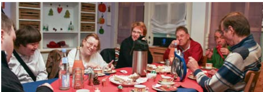
Ein gemütliches Miteinander mit leckeren Plätzchen, Kuchen, Kaffee oder Tee.