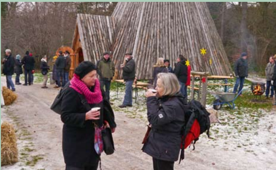
Warme Getränke, gute Gespräche und ein Feuerkorb ließen das kalte Wetter vergessen.