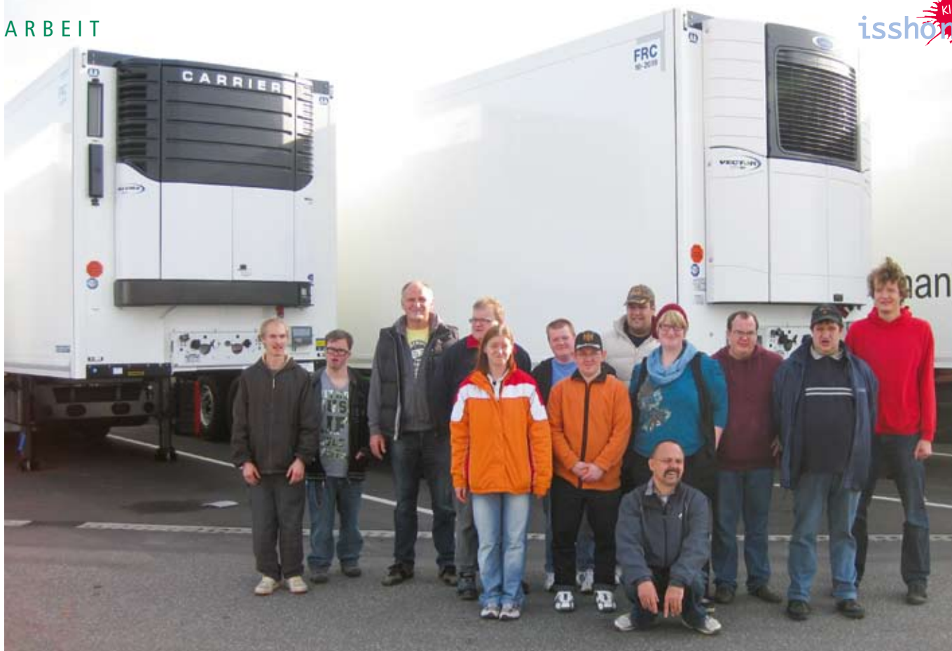
Die Metaller aus Boizenburg vor den imposanten nagelneuen Fahrzeugen im Fahrzeugwerk BRÜGGE