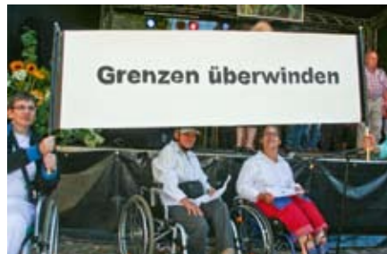
Inklusion heißt auch Grenzen zu überwinden.

Unsere Vision: „Lassen wir einfach unsere Herzen sprechen, dann werden wir erkennen, dass das Leben unendlich viel Freude und Liebe