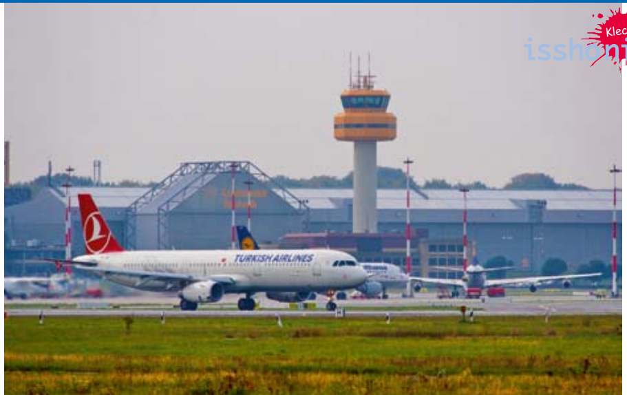
Ein Flugzeug der Turkish Airlines.

Während aller 3 Aktionen wurden wir von Frau Lea Atikossie vom Besucherservice des Flughafens sachkundig, lebendig und mit viel Humor über alle Abläufe auf diesem (Deutschlands fünftgrößten) Flughafen