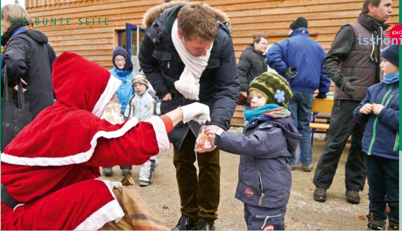
Auch auf die zweite Mitarbeiterweihnachtsfeier im Uhlenkolk kam der Weihnachtsmann und verteilte Geschenke.