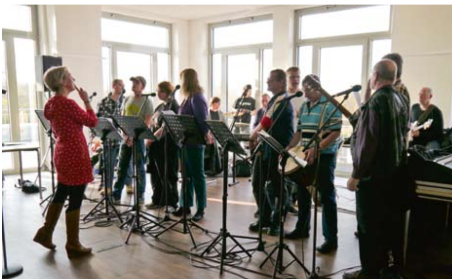
Das Singen klappt schon ganz gut zusammen.