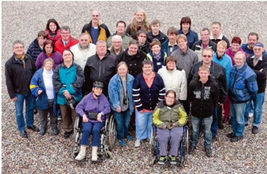
Die Lichtwerker – Foto von Günter Grätsch.

Dieser Workshop war ein Arbeitstreffen zu einem bestimmten Thema. Wir trafen uns zum Thema Fotografieren. Wir nennen uns Lichtwerker. Das sind alles Freunde des Fotografierens, und wir haben dabei großen Spaß. Unter der Anleitung von Günter Grätsch als Profifotograf und unseren Assistenten kommen viele Bilder zustande. Etwa 45 Fotografen aus allen Werkstätten und Wohnstätten des Lebenshilfwerkes Mölln-Hagenow trafen sich für zwei Tage im Haus der sozialen Dienste, in Mölln.