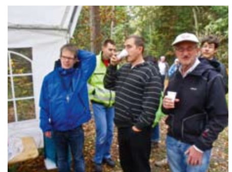
Eine Stärkung für die Wanderer.