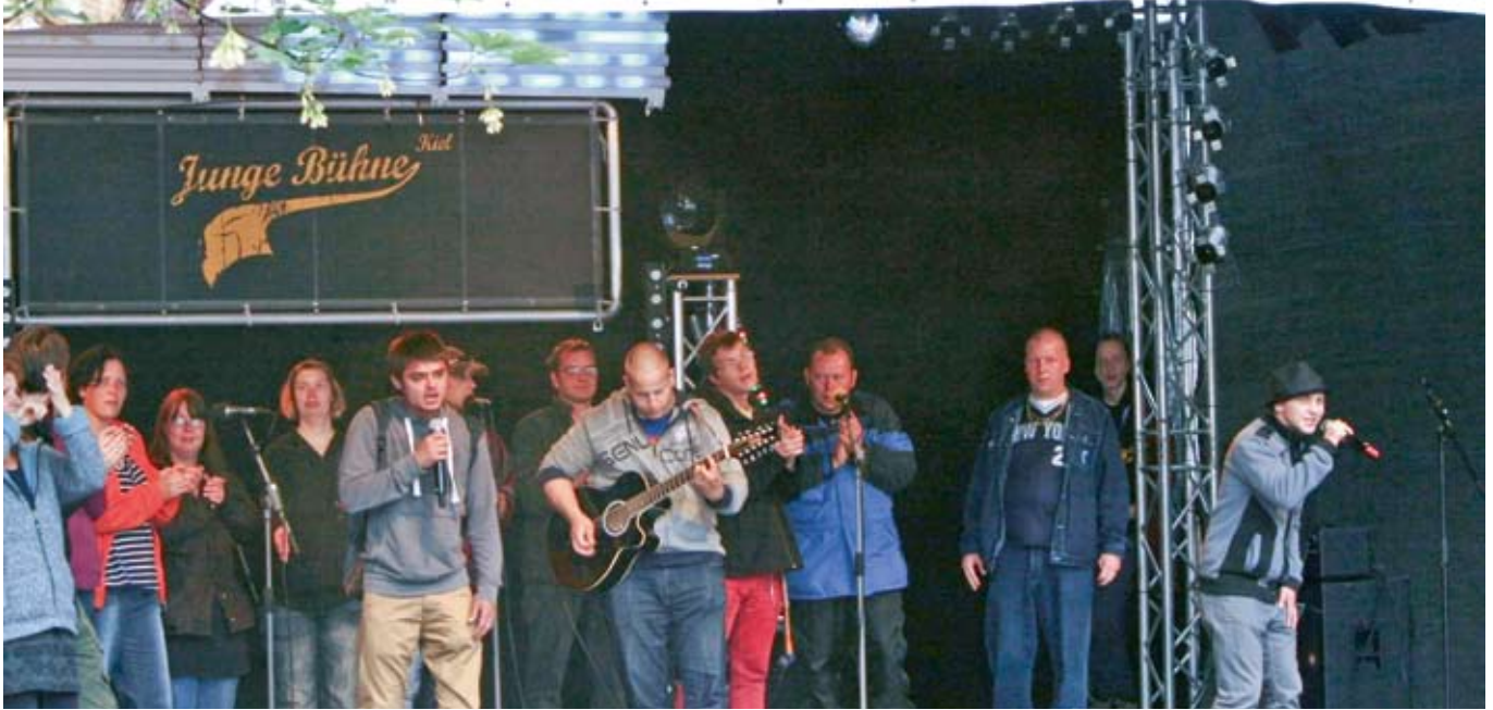
Auftritt KRACH MACH TACH Junge Bühne Kiel.