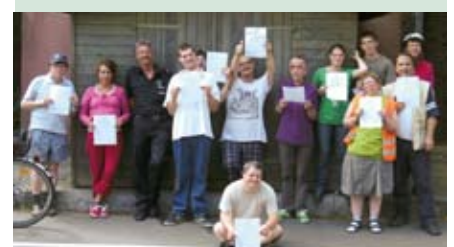
Toller Erfolg – das Fahrradsicherheitstraining wurde erfolgreich absolviert.