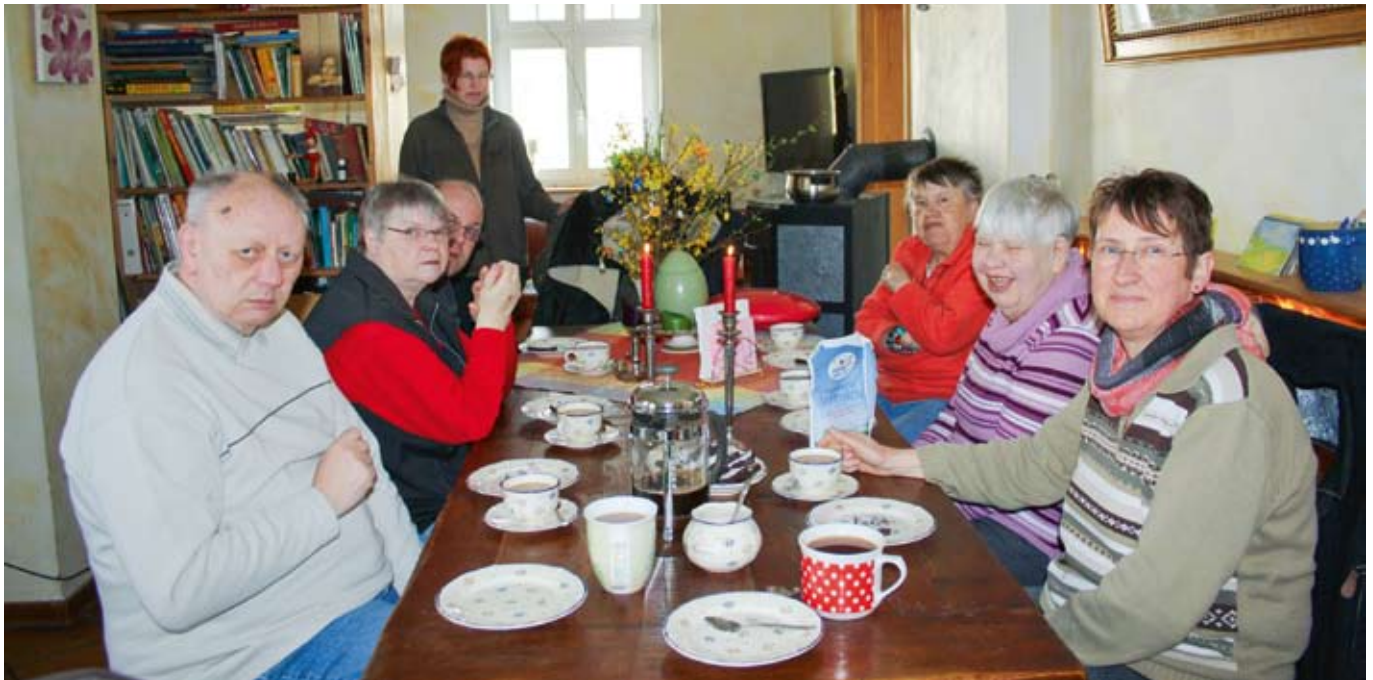
Ein herrlicher Urlaub mit toller Unterbringung in Berlin.