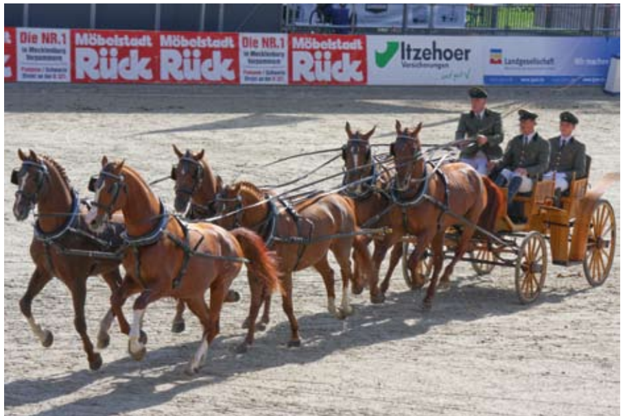
Kutsche fahren mit einem Sechser-Gespann.