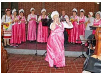
Nostalgie sang wunderschöne Lieder aus Russland.