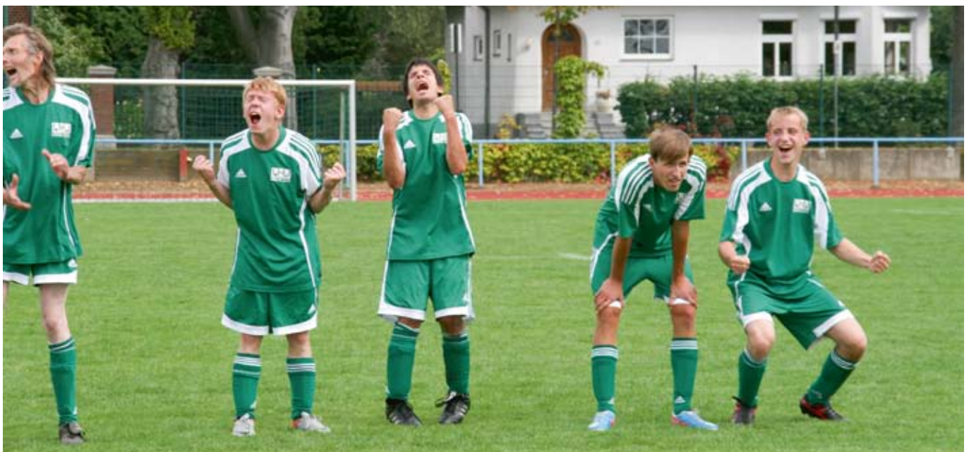
So sehen Sieger aus!