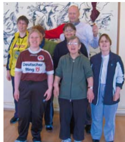
Die stolzen Teilnehmerinnen mit ihrem Trainer.

Herzlichen Glückwunsch, Mädels! Ich bin stolz auf Euch!