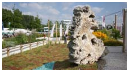
Faszinierende Landschaften und tolles Wetter.

Die GaLa-Gruppe, die Hauswirtschaft und der Berufsbildungsbereich aus den Hagenower Werkstätten waren am 21.08.2013 zu Besuch in Hamburg auf der Internationalen Gartenschau. Es gab viel zu sehen. Das Anlegen von Gärten und Pflanzungen, im Zusammenhang mit dem Element Wasser war sehr beeindruckend. Auch die Kleingärten und die „Achtzig Gärten“ aus aller Welt waren sehr interessant gestaltet. Das Wetter an diesem Tag war wirklich super, so dass wir doch einige Pausen machen mussten. Es gab auf dem weitläufigen Gelände aber genug Gelegenheit dazu. Einige Teilnehmer aus unseren