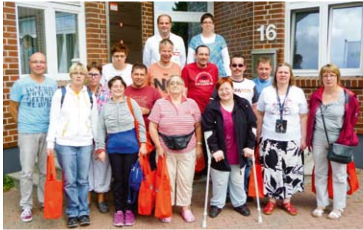
Verpacken die verschiedensten Sorten an Trockenfrüchten: Die Lebensmittelverpackungs-Gruppe.

Bevor wir mit der Besichtigung anfangen konnten, mussten wir Uhren und Schmuck aus hygienischen Gründen ablegen, einen Kittel