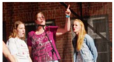
Auftritt beim Altstadtfest 2013.

Verschiedene Akteure aus dem Kreisgebiet informierten zu den Themen „Internationaler Jugendaustausch“, „Kulturen im Austausch“, „Kulturen erleben“ und „Interkulturelle Jugendarbeit“. Ebenfalls im Rahmen dieser Projekte-Messe stellten die Projektträger die Projekte vor, die 2013 über den Lokalen Aktionsplan (LAP) für Vielfalt, Toleranz und Demokratie des Kreises Herzogtum Lauenburg gefördert wurden. So waren das Lebenshilfswerk Mölln-Hagenow ebenfalls mit 2 Projekten vor Ort: Politische Bildung in leichter Sprache und mit der