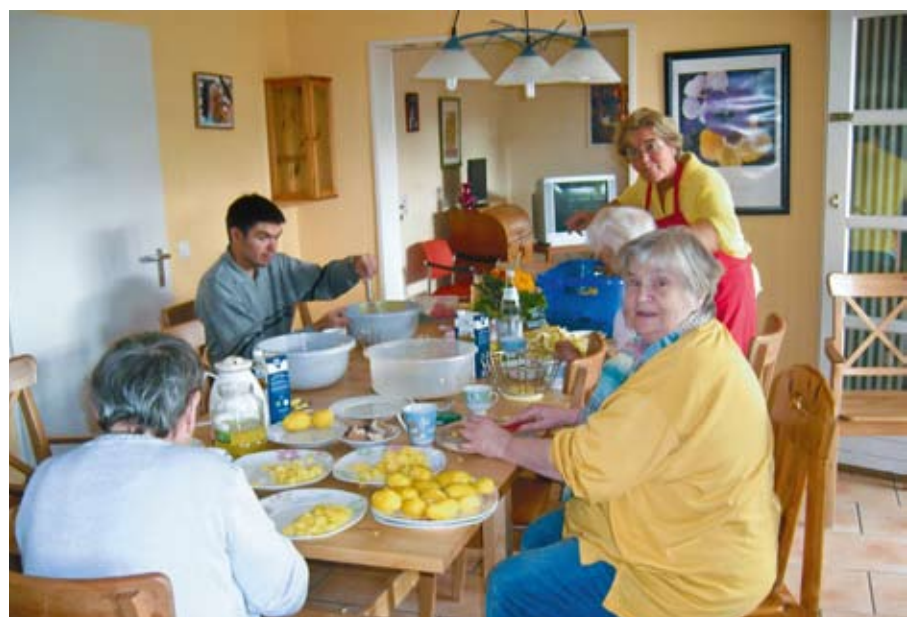
Was man selber kocht schmeckt doch am besten.

Deine „Kochlehrlinge“ der Geesthachter Wohnstätten, Charlottenburger Straße,