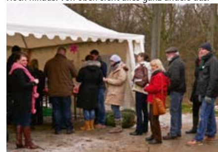
Großer Andrang bei der Weihnachtsbaumausgabe.