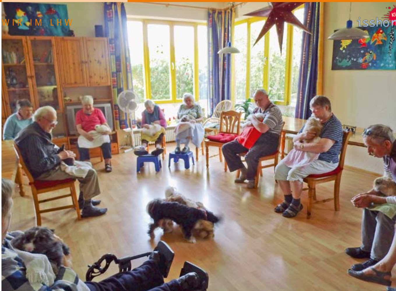
Tiertherapeuten: Weich und kuschelig, es gibt nichts schöneres.