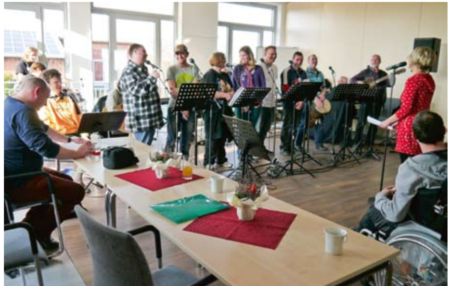
Das Üben bringt Spaß und wir werden immer besser.

Die nächste Probe fand am 14. November mit Godewind statt, worauf meine Gruppe „Mixed Generation Mölln Hagenow“ und ich uns sehr gefreut haben. Wir trafen uns im Haus der sozialen Dienste in Mölln. Toll war, dass die Gruppe Godewind uns bei dieser Probe begleiten konnte.