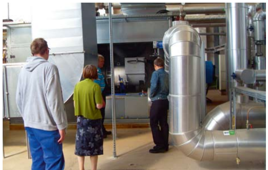
Hier wird der Strom eingespeist.