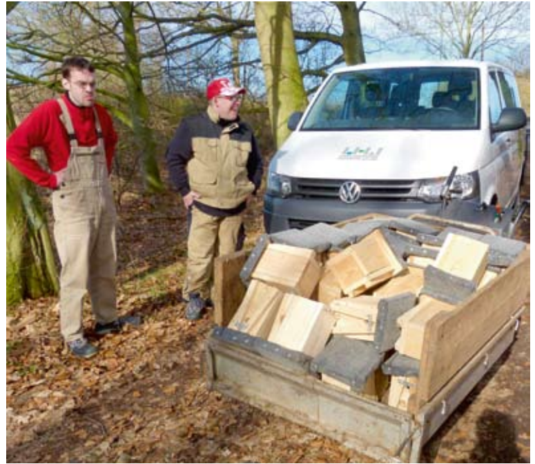
Wolfram Witt Hagenower Werkstätten

Im Frühling haben wir in einer gemeinsamen Aktion mit Rangern des Biosphärenreservates die Kästen aufgehängt und hoffen nun auf viel Nachwuchs bei den Haselmäusen.