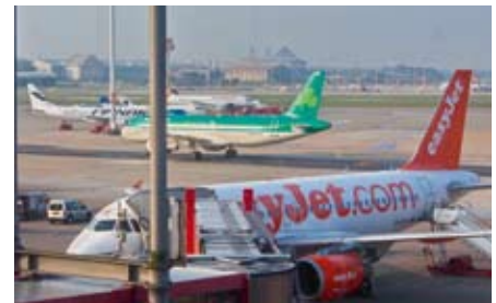
Flugzeuge, Flugzeuge, Flugzeuge.

Nach der Besichtigungstour gab es noch ein Mittagessen in der „Take-Off-Lounge“. Von dort hatte man einen tollen Rundblick auf das gesamte Flughafengelände. Als am