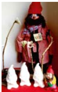
Zwerge zum bunt gestalten.

Zum ersten Mal haben auch Beschäftigte Ihre Werke gezeigt. Unter dem Motto