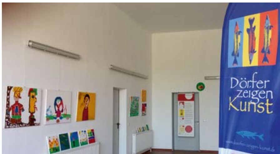
Ausstellungsaufbau im Dorfgemeinschaftshaus.

„Schelmenkunst“ wurden die Bilder im Dorfgemeinschaftshaus ausgestellt und es gab auch eine Mitmachaktion am 13. Juli. Zwerge die schon auf dem Landmarkt herumgeisterten, konnten von den Besuchern bei Kaffee und