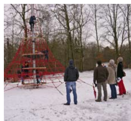
Hoch hinaus: Von oben sieht alles ganz anders aus.