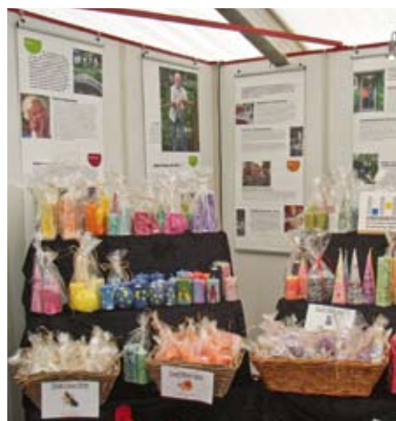
Die Geesthachter Werkstätten stellen wunderschöne Kerzen her.