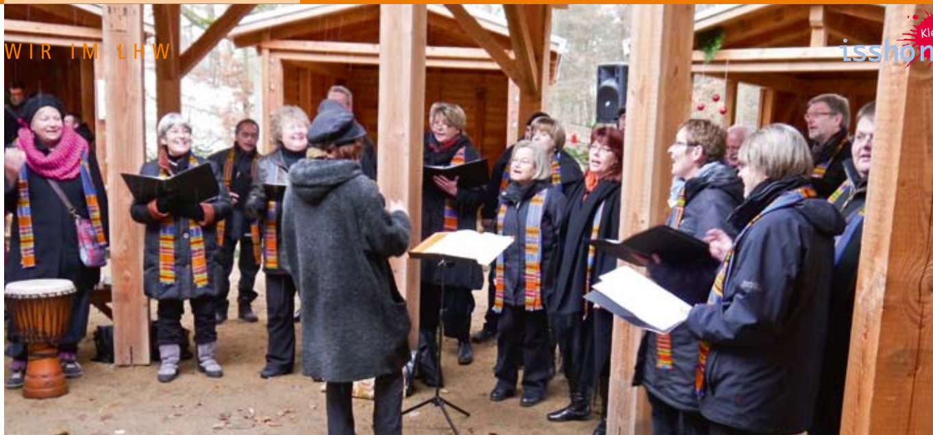
Der Nusser Gospelchor sang wunderbare Lieder.