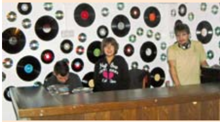
Tolle Idee: Platten als Wanddekoration. Die DJ's sorgten für Stimmung.