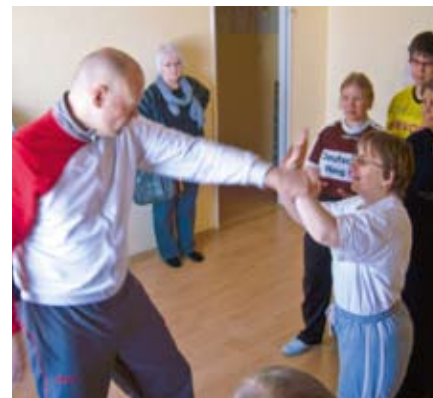
Im Training geht's zur Sache!

Das ist eine beachtliche Leistung, gerade bei körperlich überlegenen Gegnern. Ebenso wurden Hemmungen abgebaut, um sich zu trauen, auch körperliche Selbstverteidigung anzuwenden. Beim Training und auch bei der Prüfung blieben daher ein paar blaue Flecken und späterer Muskelkater nicht aus, so sehr waren die Bewohnerinnen engagiert.