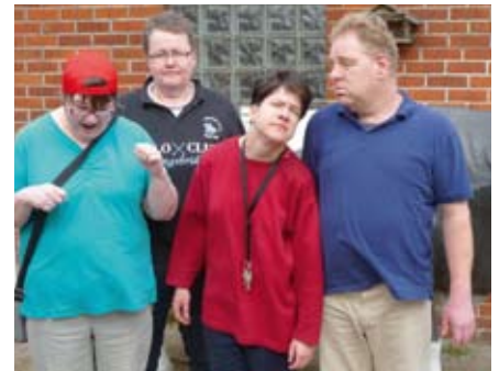
Die fleißigen Helfer nach getaner Arbeit.