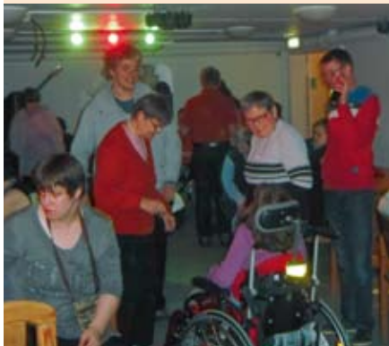
Die Tanzfläche wird gerockt.