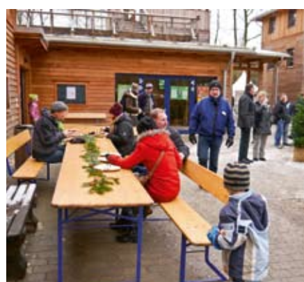
Kleine Sitzpause gefällig?