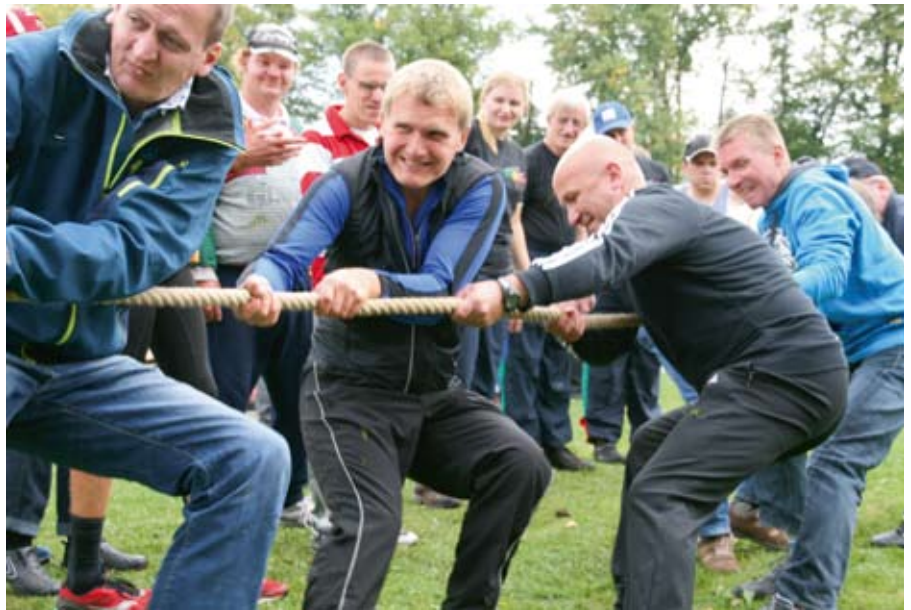
Die Fachkräfte müssen richtig ran!

Insgesamt meldeten sich 342 aktive Sportler aus den Werkstätten in Rampe, Ludwigslust, Parchim, Mölln, Geesthacht, Schwarzenbek, und den „Hausmannschaften“ aus Hagenow, Boizenburg, der Betriebsstätte „Am Hasselsort“ und Kneese, sowie die Schüler der Förderschule mit dem Förderschwerpunkt geistige Entwicklung an.