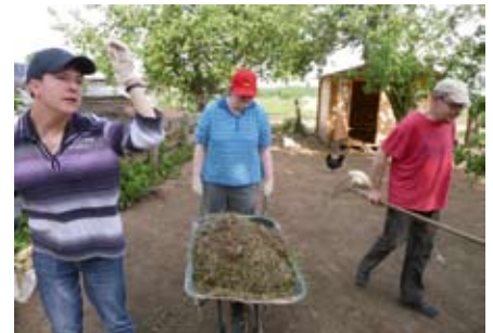
Die Arbeit auf dem Bauerhof macht Spaß.