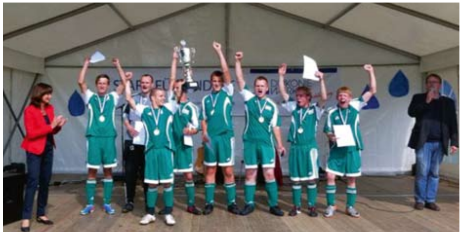
Die stolzen Gewinner des DiaCup.