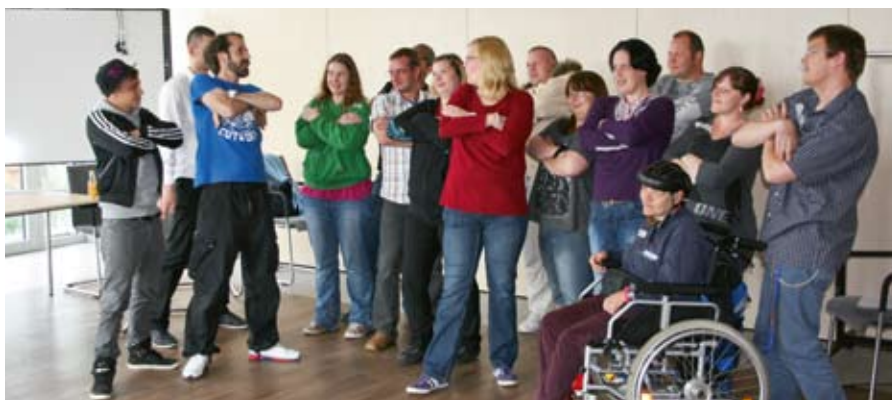
Workshop Gang in Mölln beim Rap-Workshop.