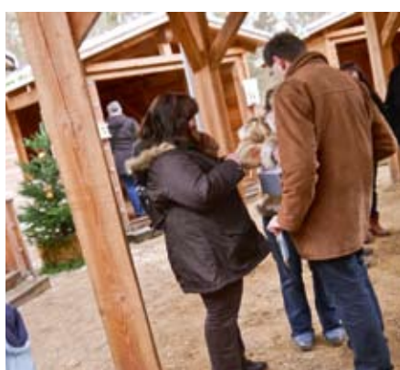
Losverkauf: Viele versuchten ihr Glück.

Nils Wöbke Lebenshilfewerk Mölln-Hagenow