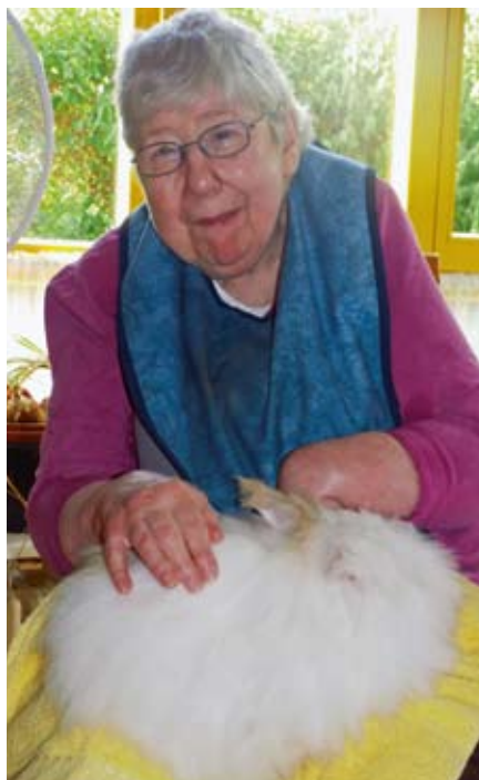
Wo ist denn hier hinten und wo vorne?

Jeder der wollte, und das waren natürlich alle Gruppenteilnehmer bekam ein Kaninchen auf den