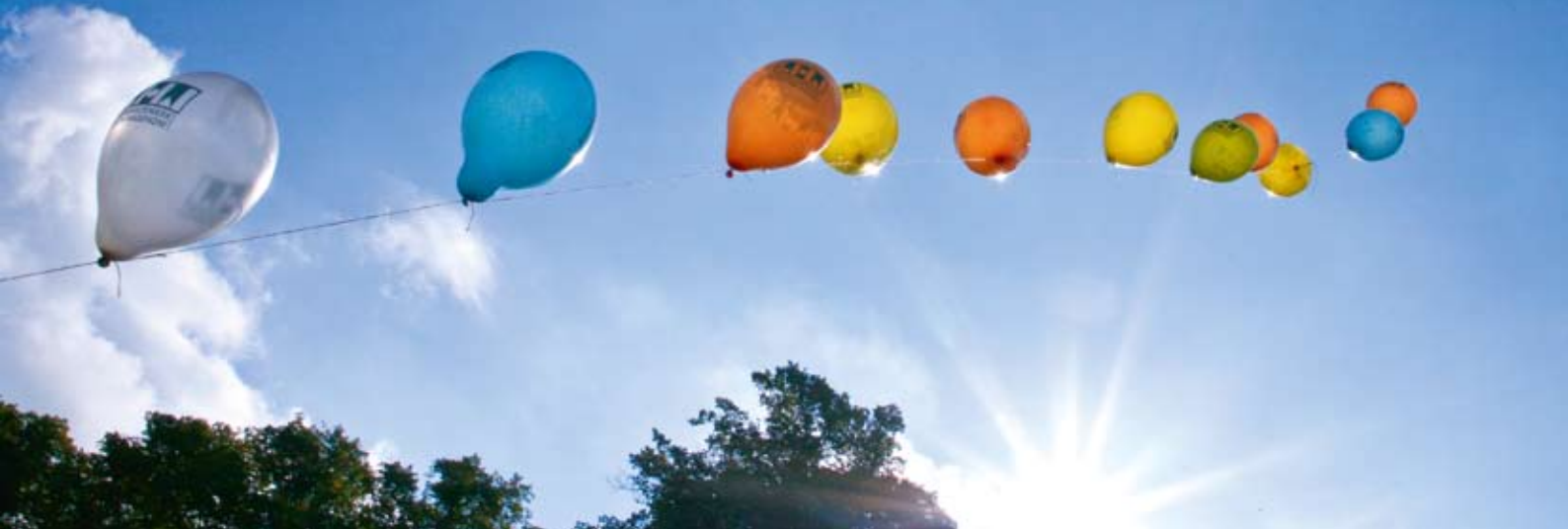
99 Luftballons weisen den Weg.