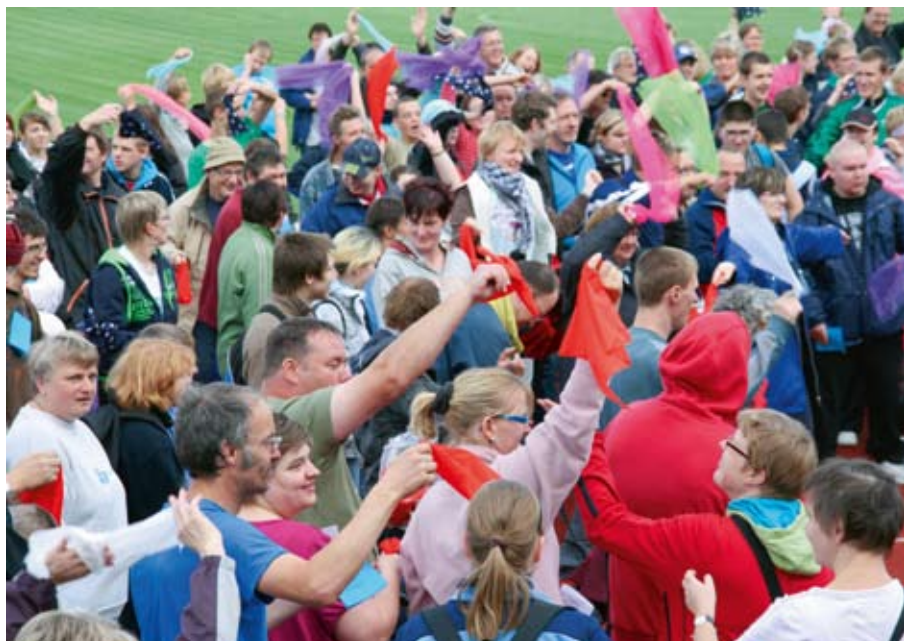
Aufwärmen vor dem Durchstarten.