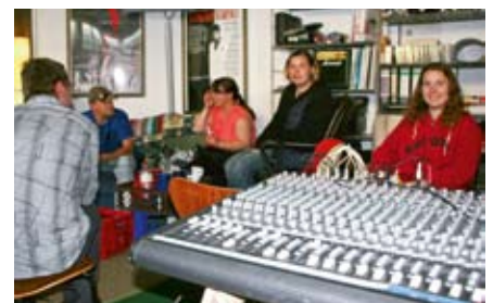
Studioaufnahme bei Spax.

Doch das Rap-Projekt war mit dem Auftritt auf dem KrachMachTach keinesfalls beendet,