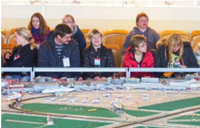
Das Modell des Hamburger Flughafens.