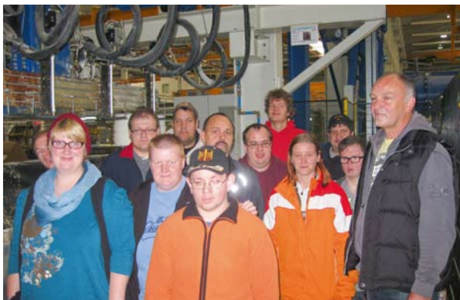
Besichtigung der Werkhalle.

Der Heimweg an diesem wunderschönen Herbsttag führte uns über Dömitz, wo wir den herrlichen Ausblick vom Panoramacafe auf die Elbniederung und den Hafen genießen konnten. Am Ende des Tages waren wir alle einer Meinung: „Es war ein interessanter, spannender aber auch anstrengender Tag“.