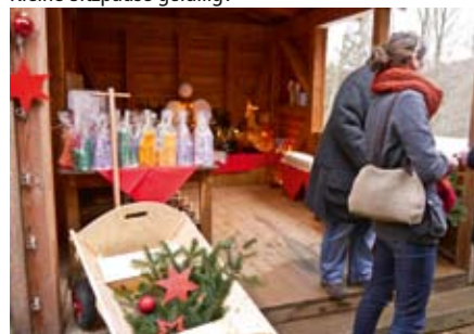
Gewinnausgabe: Viel Schönes für die Weihnachtszeit