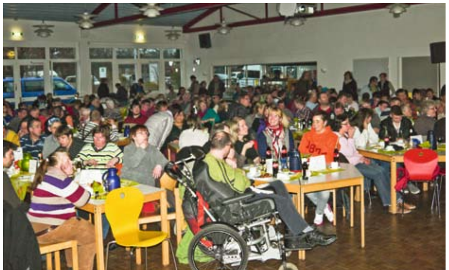
Treues Publikum: Der Saal war wieder rasselvoll.