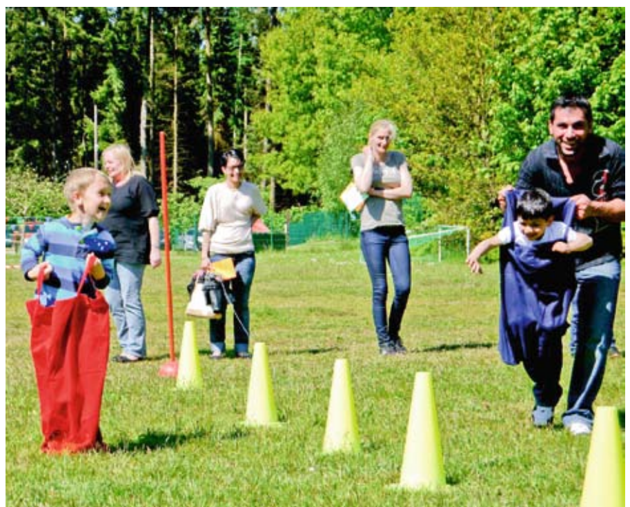
Slalom-Sackhüpfen: Eine echte Herausforderung.