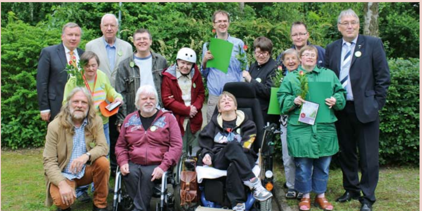
Die Jubilare mit Gästen.