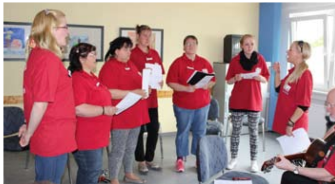
Konzentration bei der gemeinsamen Probe.