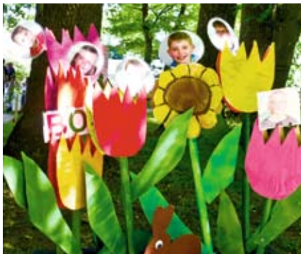
Kinder Gruppe: 2. Platz: Offene Ganztagschule Breitenfelde