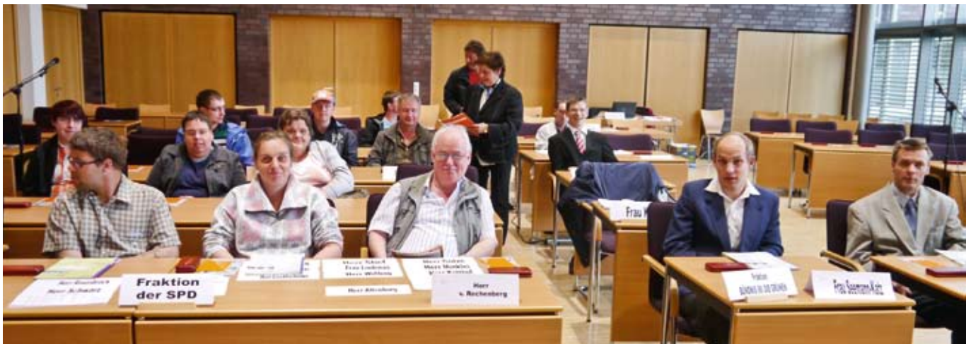
Teilnehmer des Workshops Politik im Sitzungssaal des Kreistages.

Nach der Auftakt-Veranstaltung in Boizenburg folgten noch zwei weitere Veranstaltungen zur Politischen Bildung für die Hagenower Werkstätten und die Betriebsstätte Am Hasselsort und den Arche-Hof.