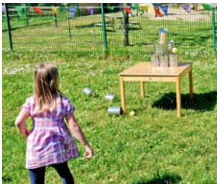
Dosenwerfen: Wie viele fallen um?