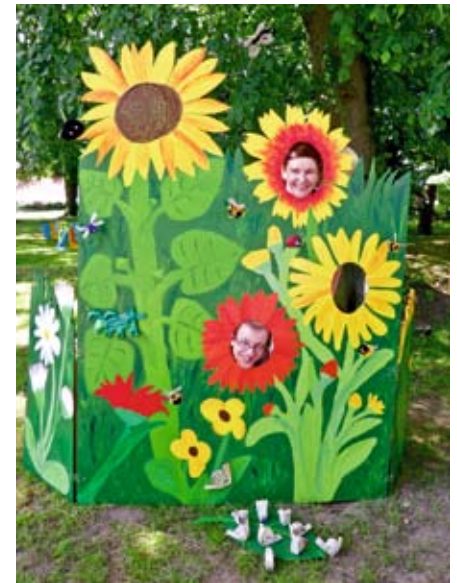
Kinder Gruppe: 1. Platz: Schneiderschere Grashüpfer: „Fotowand“