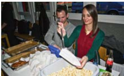
Gehört einfach dazu: Popcorn.