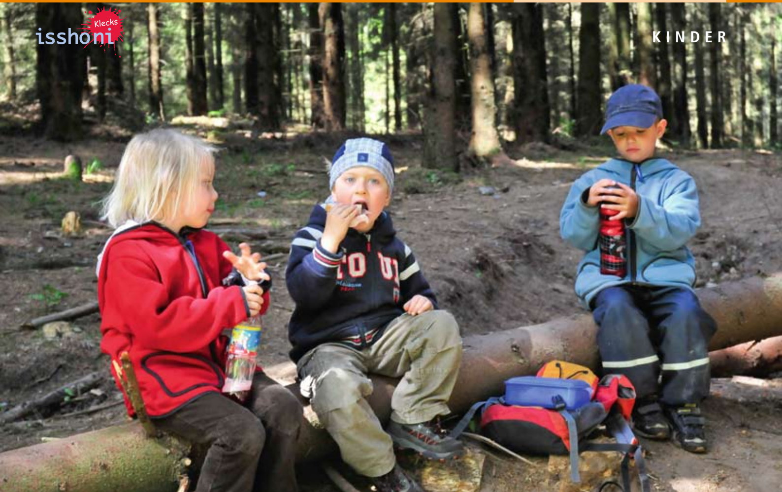
Frühstück im Wald.