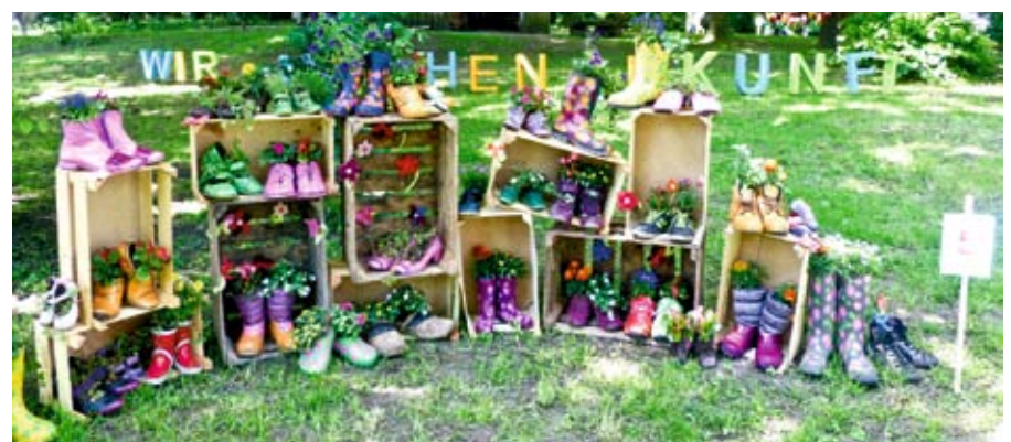
Erwachsene Gruppe: 1. Platz: Arche-Hof Wohnstätten: „Bepflanzte Schuhe“

Es war sehr ergreifend, diese Glocke das erste Mal läuten zu hören. Geweiht wurde die Glocke durch die Pröbstin Frauke Eiben.