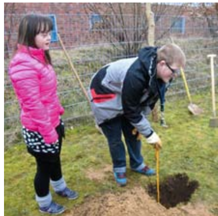
Wie tief muss das Loch?

So sind wir bereits in den Wald gefahren, haben heimische Laub- und Nadelbäume kennen gelernt, der Außenbereich des Beruflichen Förderzentrums wurde genauer erkundet, Bäume, Sträucher und Pflanzen gemeinsam bestimmt. Hierbei orientieren sich die Unterrichtsinhalte auch an dem Rahmenplan für den Arbeitsbereich Garten- und Landschaftspflege.