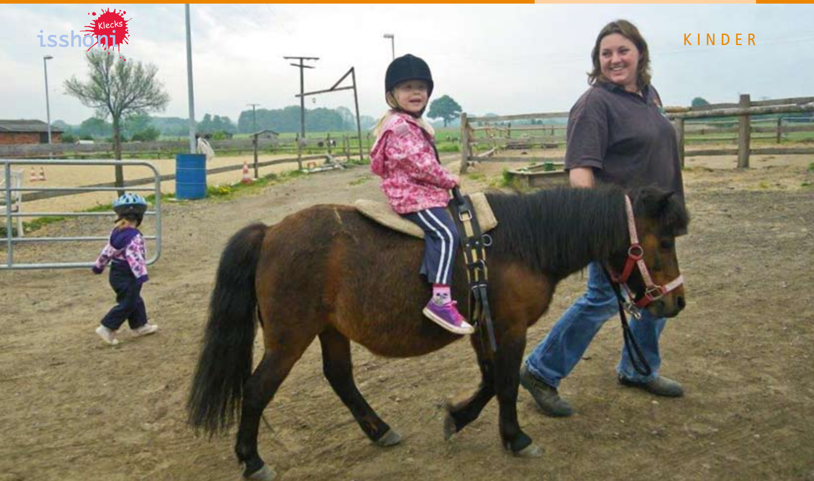
Pony-Reiten bringt Spaß.