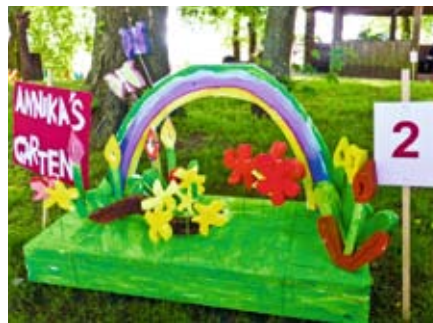
Erwachsene Einzel: 2. Platz Annika Tesch: „Regenbogengarten“