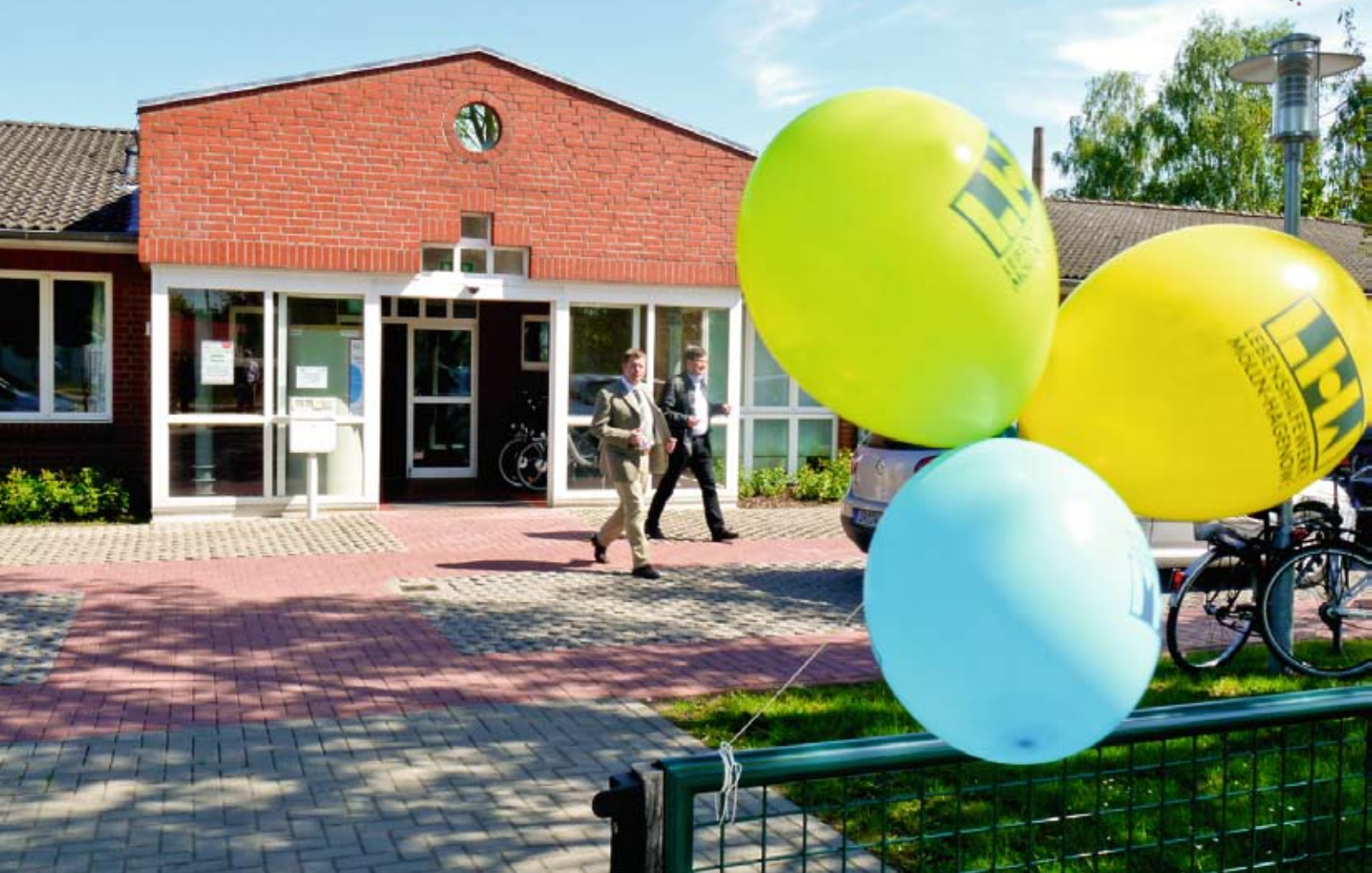
Zahlreiche Besucher nutzen den Tag der offenen Werkstatt.