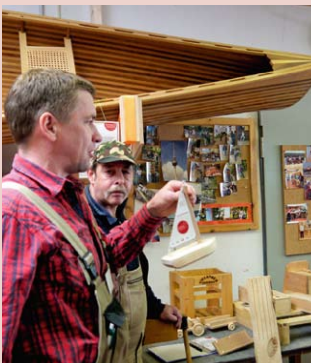
Souvenirs aus der Tischlerei