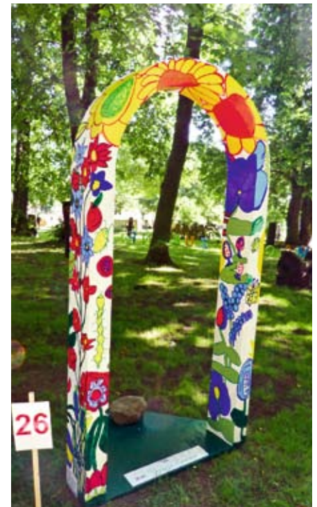
Erwachsene Einzel: 3. Platz Jennifer Kluth: „Tor zum Paradies“