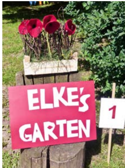
Erwachsene Einzel: 1. Platz Elke Werner: „Elkes Garten“