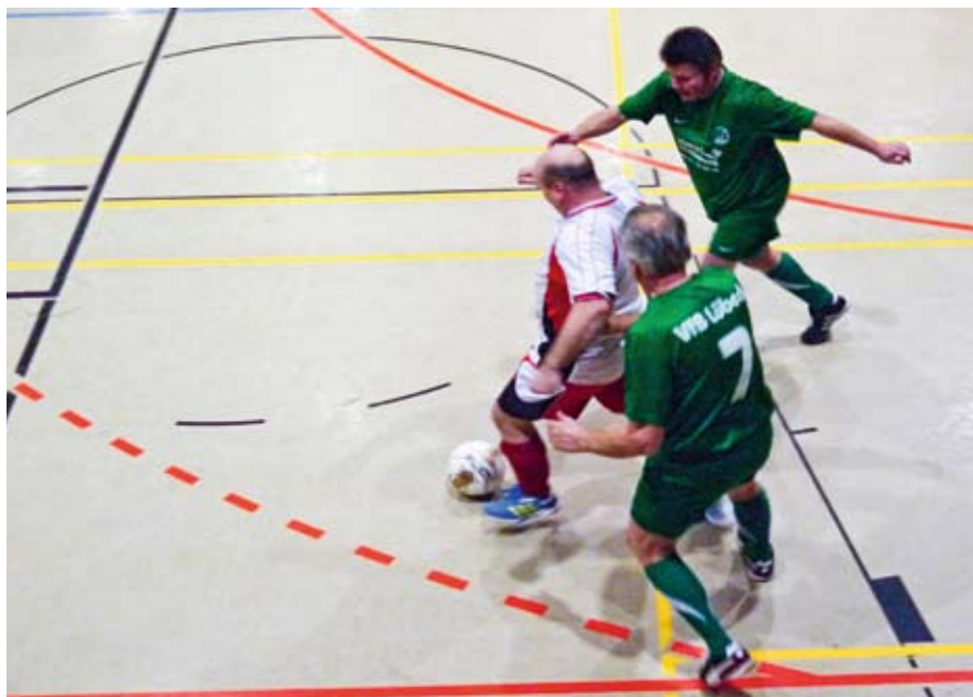
Absolut fair und ohne nennenswerte Blessuren endete am Sonnabend das 11. LHW-Hallenfußballturnier auf dem Möllner Schulberg.

So war auch in diesem Jahr der Sinn und Zweck des LHW-Hallenfußballturniers vielfältig. Wie immer war ein Raum für