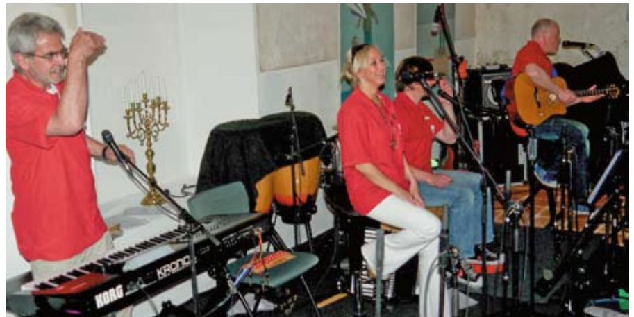
Hatten sichtlich Spaß: Im wunderbaren Ambiente der Alten Synagoge von Hagenow gaben Godewind ein ganz besonderes Unplugged-Konzert.