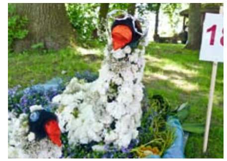
Erwachsene Gruppe: 2. Platz: Haus der sozialen Dienste Hauswirtschaft: „Schwäne im Teich“