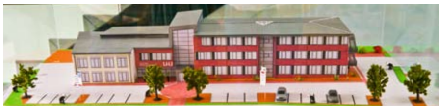
Das fertige Modell.