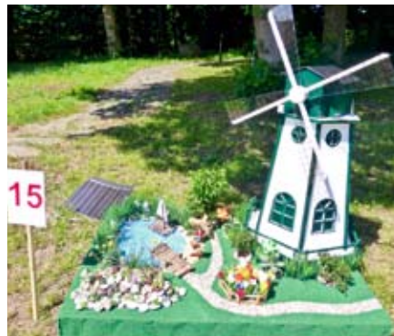
Erwachsene Gruppe: 2. Platz: Betriebsstätte Am Hasselsort: „Garten mit Windmühle“