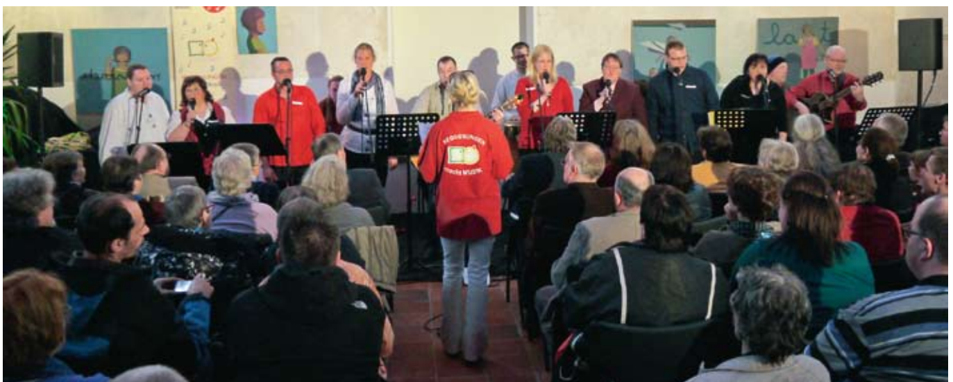
Nach nur drei Workshoptagen bot die Band ‚Halligalli‘ ein beeindruckendes Konzert.