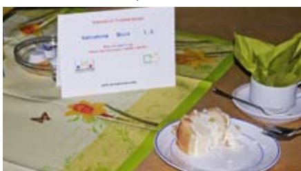
Darf auch nicht fehlen: Sahnetorte zum Sahnekino.