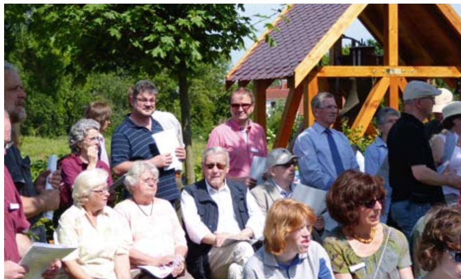
Gottesdienst in der Baumkirche.

Ein weiterer Höhepunkt war ein Wettbewerb zum Thema: „Blumengarten, bunt und fröhlich, schöne Blüten“. Hier konnten Einzelpersonen und Gruppen, unterschiedlichen Alters teilnehmen.