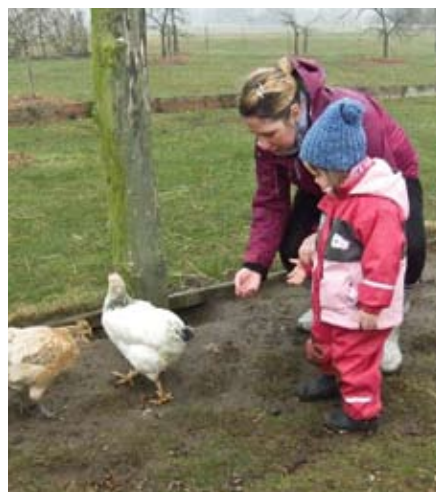
Die Kinder lernen die Hühner kennen.