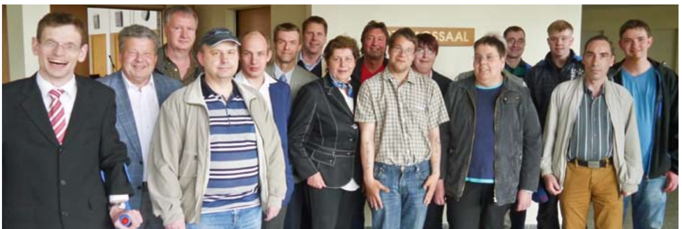
Teilnehmer des Workshops Politik in Hagenow.