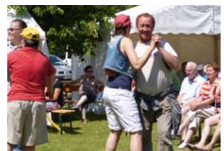
Musik lädt zum Tanzen ein.

Insgesamt waren es 28 Teilnehmer, die ihre liebevoll kreierten Ausstellungsstücke dargeboten haben. Für die Jury und auch für die Besucher war es schwer zu entscheiden, welches der Objekte