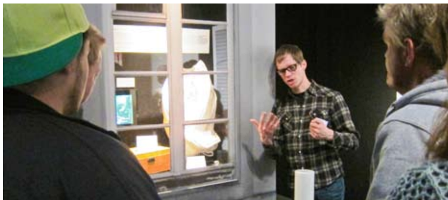
Blick in die Vergangenheit: Eine Zwangsjacke.