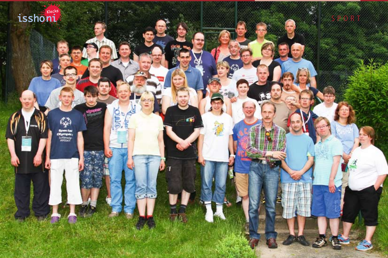
Die Teilnehmer des Lebenshilfewerkes – Gemeinsam sind wir stark!