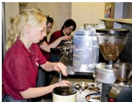
Das Team vom Café Sophie war gleich zur Eröffnung voll im Einsatz.

langjähriger Wegbegleiter des Lebenshilfswerks, Till Backhaus, das neue LHW-Projekt und versprach künftig häufiger in Hagenow anzuhalten, um im Café Sophie einzukehren.