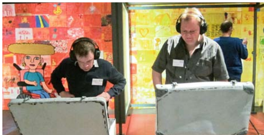
Wo beginnt eigentlich das Handicap? Mehr erfahren ...