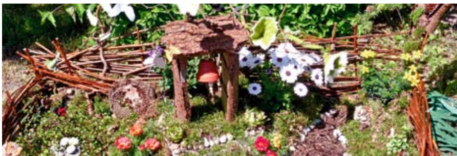
Erwachsene Gruppe: 2. Platz: Pflege- und Fördereinrichtung Hagenow: „Naturgarten mit Glocke“