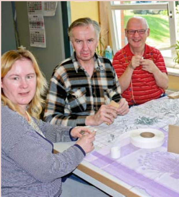
Montage von Rolloteilen: Die Beschäftigten führten am Tag der offenen Werkstatt ihre Arbeit vor.