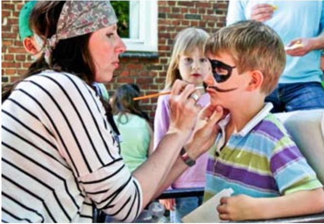
Kinderschminken für echte Piraten.