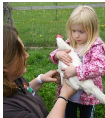
Ganz vorsichtig auf den Arm nehmen.