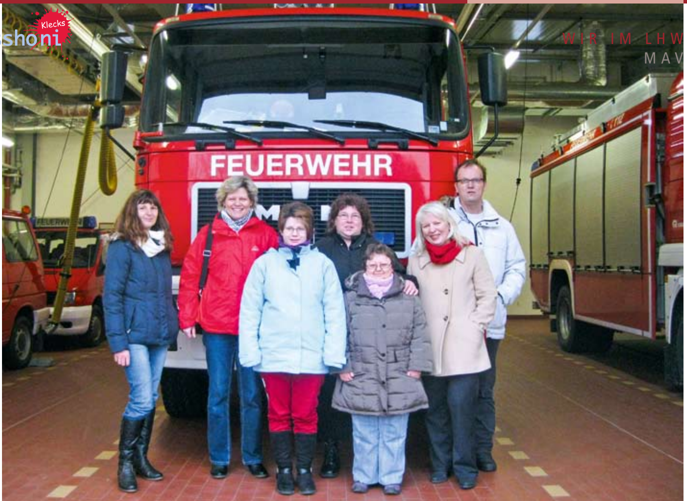
Das Näh-Atelier zu Besuch in der Feuerwehrezentrale in Hagenow.