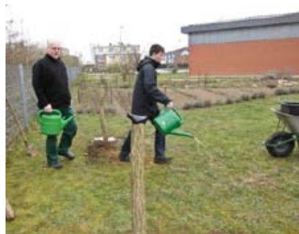
Nach dem pflanzen gießen.

Anhand von Holzscheiben haben wir die Jahresringe von Bäumen gezählt und aus den Scheiben mit Hilfe von Schleifpapier und Speiseöl hübsche Glasuntersetzer hergestellt.