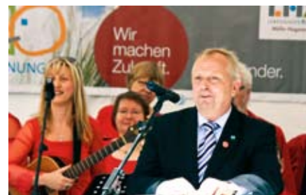
Dr. Till Backhaus lobte das Projekt. Im Hintergrund: der Chor „Carpe diem“.

Frau, ein Dienstmädchen, heißt im Volksmund ‚Fiek'n‘, was auf Hochdeutsch ‚Sophie‘ bedeutet. So ist dies auch der richtig gewählte Name für das neue Café in Hagenow, in dem es sicher künftig auch, wie es sich für zentrale Anlaufpunkte einer Stadt gehört, die neuesten Neuigkeiten zu erfahren gibt.