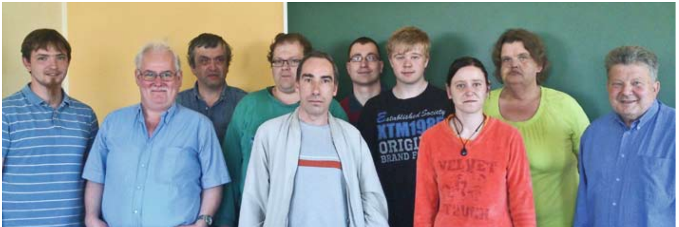
Teilnehmer des Workshops Politik in leichter Sprache in Boizenburg.

Nachdem in den Werkstätten des Lebenshilfwerkes Kreis Herzogtum Lauenburg in 2013 das Projekt „Politik in leichter Sprache“ stattgefunden hat, ist in den Werkstätten des Lebenshilfwerkes Hagenow in 2014 ein entsprechendes Projekt gestartet.